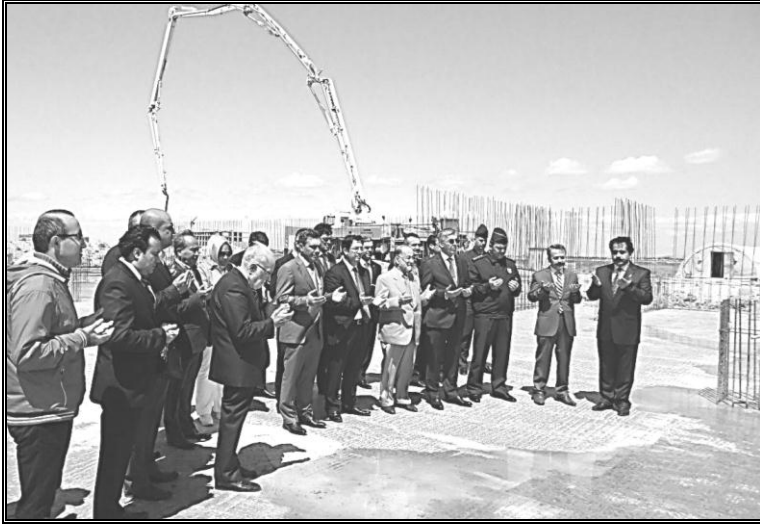
Fakülte inşaatı temel atma töreni.