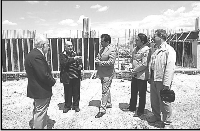
Fakülte binamızın inşaatı. 20.05.2014 17