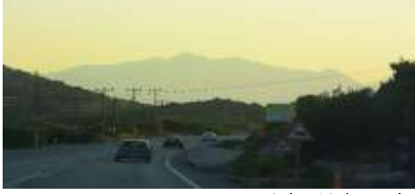
M. A. Akşit Koleksiyonundan