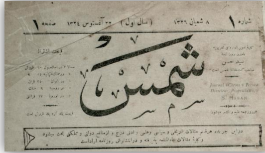
Görsel 1: Şems gazetesinin başlık ve logo kısmı