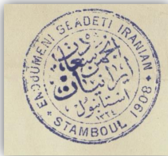
Görsel 3: Encümen-i Saadet-i İraniyan'ın Mühürü