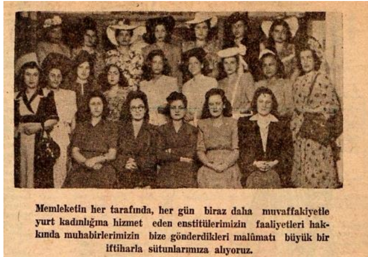
Şekil 5. 1947 yılına ait bir kadın dergisinde modern giysileriyle mezuniyet resminde yer alan Bergama Kız Enstitüsü öğrencileri (Dergideki orijinal alt başlığıyla verilmiştir) (Figure 5. Bergama Girls Institute students whose graduation picture is seen on a 1947's women's magazine with their modern clothings) (Presented with the original subtopic in the magazine) (Kaynak: Hanımeli Dergisi, 1947)

Üniforma tipi giysilerin yerini tekrar hareketlilik kazanan endüstrinin yuvarlak kesimlere sahip kadınsı giysileri hakim olmaya başlamıştır. Türkiye'de ise yurdun birçok şehrinde açılan kız enstitüleri mezunlarını vermeye başlamış, yaptıkları yılsonu defileleri ile kadınları moda hakkında bilgilendirmişlerdir. (Şekil 5) Modayı takip etmek isteyen özellikle kentlerde yaşayan kadınlar ise yenilikleri giysilerinde yansıtmaya çalışmıştır.