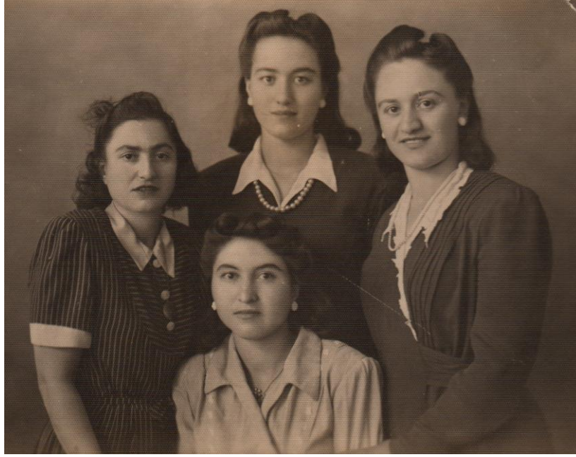
Şekil 4. Erzurum'da bir ailenin genç kızları (Figure 4. Teenager girls of a family in Erzurum)

Üniforma tipi giysilerin yerini tekrar hareketlilik kazanan endüstrinin yuvarlak kesimlere sahip kadınsı giysileri hakim olmaya başlamıştır. Türkiye'de ise yurdun birçok şehrinde açılan kız enstitüleri mezunlarını vermeye başlamış, yaptıkları yılsonu defileleri ile kadınları moda hakkında bilgilendirmişlerdir. (Şekil 5) Modayı takip etmek isteyen özellikle kentlerde yaşayan kadınlar ise yenilikleri giysilerinde yansıtmaya çalışmıştır.