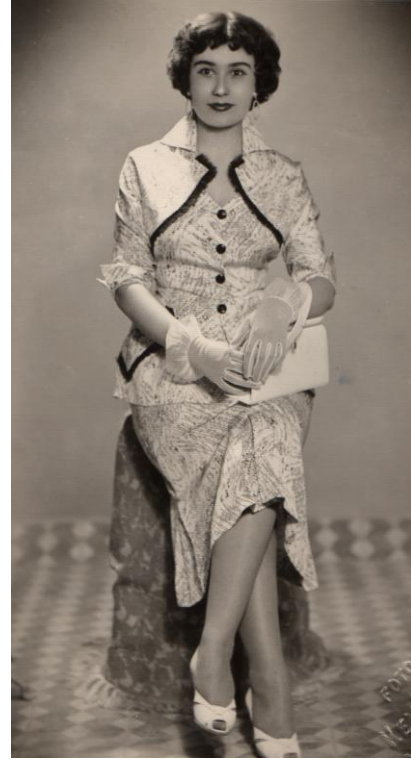
Şekil 8. Günün modasını takip eden Malatya'dan genç bir kadın (Figure 8. A young woman from Malatya following the fashion of the time)

1956 yılında çıkan sanat, estetik, sosyete kelimelerinin ilk harflerinden ismini alan SES dergisi devrin moda-kadın anlayışı hakkında ipuçları vermektedir. Dergi yazılarında modanın hakim gücünü vurgulamakta, insanların bile modasının geçebileceğine değinerek değişen moda trendlerine dikkat çekmektedir (Barbarosoğlu, 2002: 169).