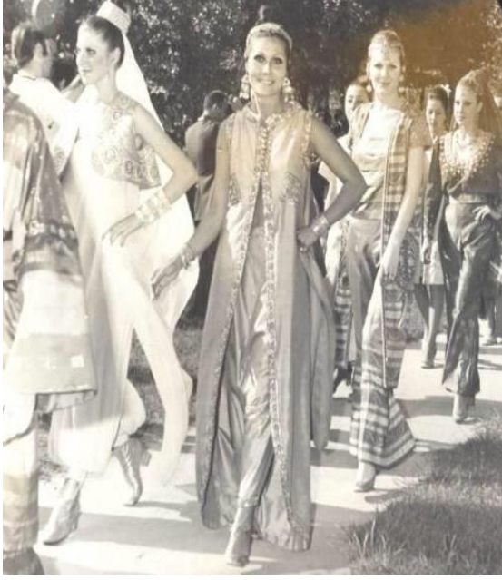
Şekil 11. 80'lerde İstanbul'da geleneksel giysilerden esinlenerek hazırlanmış olgunlaşma enstitüsü defilesi

(Figure 11. A "institute of maturing" fashion show from 80's İstanbul inspired by traditional clothings)