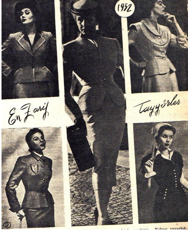
Şekil 7. Avrupa modasından örnekler veren tayyör modelleri (Orijinal sayfa dizaynı ile verilmiştir) (Figure 7. Women's suit models giving examples from European fashion) (Presented with original page design).