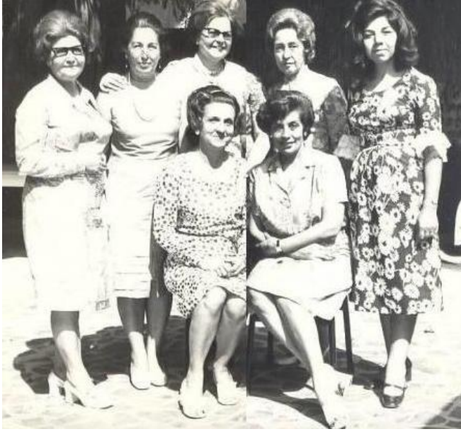
Şekil 9. Sağlık alanında çalışan kadınlar (Figure 9. Women working in the health sector)