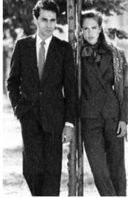
Şekil 12. 90'ların dergilerde yer alan erkeksi giyim hatları (Figure 12. Masculine clothing lines from 90's magazines)