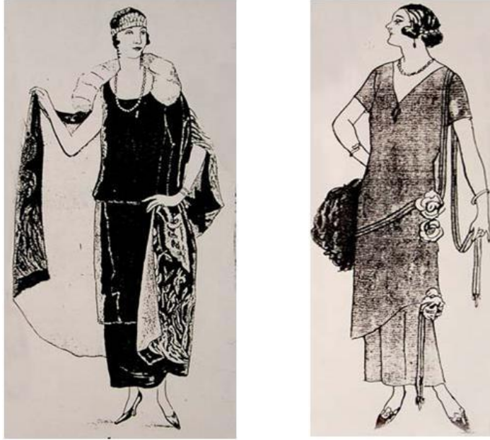
Şekil 2. Müsahipzade Celal'in "Süs Dergisi"ne yaptığı illüstrasyonlardan iki örnek (Figure 2. Two samples from the illustrations drawn by Müsahipzade Celal for the "Süs" magazine)

20'li yılların ortalarında henüz yeni kurulmuş bir devletin Avrupa'da olduğu gibi modacıları ve kendi moda dergilerinin olması ise söz konusu değildir. Ancak bu dönemin yazarlarından Müsahipzade Celal'in "Süs Dergisi"ne yaptığı illüstrasyonlar da (çizilerek hazırlanmış moda resimleri) (Şekil 2) adının yayınlanması, yazarın bu alanda varlığını göstermesi ve modanın gelişmesi yönünde katkı sağlaması açısından dikkat çekici ve önemlidir. (Şahin, 2009: 21)