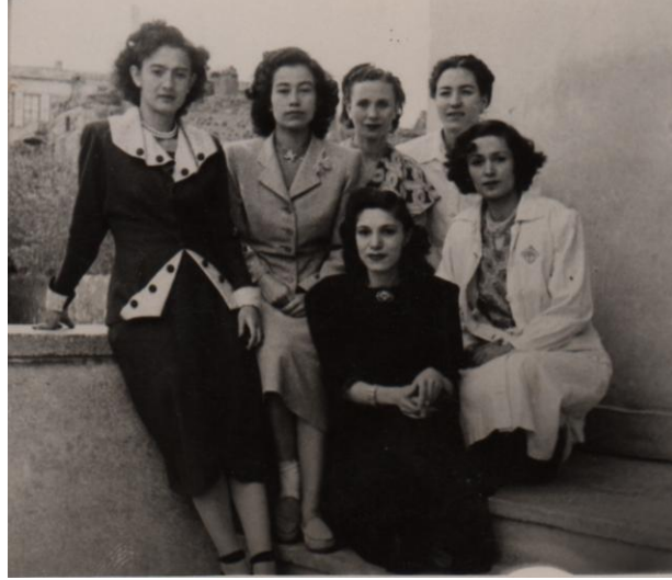
Şekil 6. Erzurum Kız Enstitüsü öğrencilerinden bir grup (Figure 6. A group of students from Erzurum Girls' Institute) (Kaynak: Anonim, 1951)

Cumhuriyetin ilanından 1950'li yıllara gelinceye kadar henüz çok genç bir Cumhuriyet olan ülkemizde de modanın karşısındaki en önemli engelin ekonomik güçlükler olduğu söylenebilir. Bu bakımdan iki savaş arasında yer alan bu dönemde modaya uyma konusunda zihniyet eleştirilerinden ziyade ekonomik eleştirilerin ağır bastığı dikkati çekmektedir (Karabıyık, 2002: 51). Ancak her olumsuzluğa karşın kadınların tüm yurttaki eğitim alanındaki gelişimleri umut vericidir (Şekil 6).