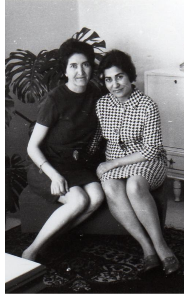
Şekil 10. Mini modasının izleri (Figure 10. Traces of the mini fashion)

70'li yıllarla birlikte hazır giyim ve tekstil endüstrisinin ülkemizde hızla gelişmeye başlaması daha fazla giyim ürününün piyasaya sürülmesi, iletişim araçlarındaki çeşitlilik, çalışan kadınların sayısının artması, ekonomik özgürlüğünü elinde tutan kadınların giyime ayırdıkları miktarın da artmasına neden olmuştur. Çalışan kadın kesimi standart çalışma giysilerinin dışına taşmış, etek boyları diz üstüne çıkmış, daha renkli bedeni saran trikolar iş giysileri olarak görülmeye başlamıştır.