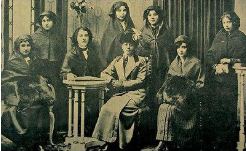
Şekil 1. 1913'de kurulan Teali-i Nisvan Cemiyeti Kadınları (Figure 1. Women of Teali-i Nisvan Community founded in 1913)

Bu dönemde aydın Türk kadınının gerek düşünce alanında, gerekse siyasi ve toplumsal haklar yönünde ciddi adımlar atarak, kadın statüsünün değerlendirilmesi amacıyla 28 Nisan 1913'de kurduğu Teali-i Nisvan Cemiyeti ( Kadınların Durumunu Yükseltme Derneği ) Osmanlı Devletinin ilk feminist örgütü sayılabilir. Cemiyet'in başındaki isim ise Halide Edip Adıvar'dır. Dernek üyelerinin yüzleri açık resim çektirmeleri ve bir bölümünün tamamen Avrupai giyim tarzı dikkat çekmektedir. (Şekil 1) O yıllarda modayı tamamen yurt dışından gelen moda dergilerinden takip eden bu kadınlar küçük bir zümreyi oluşturuyor olsalar da yaptıkları Türk kadını için bir devrim niteliğindedir.