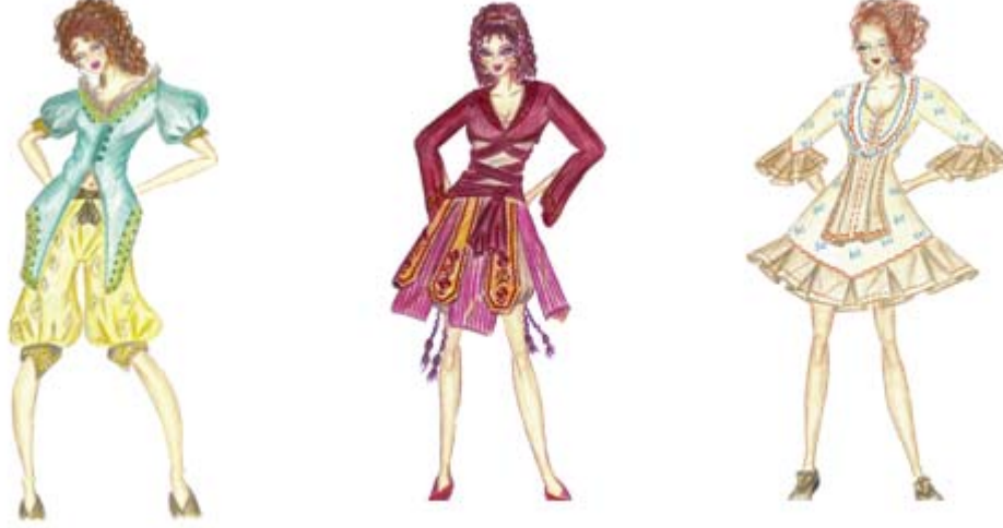
Tasarım 1. Design 1.

boyuyla modern bir tarzı yansıtmaktadır. Kol uçları şalvar paçalarıyla aynı şekilde toplanarak, tasarımda denge ve uyum sağlanmıştır. Şalvar pantolonun beli şal kuşakla bağlanan tasarımın, kullanım kolaylığı ve hareket serbestisi açısından fonksiyonel değerinin yüksek olduğu görülmektedir. Özgünlük ve günün trendlerini yansıtmaları tasarımın sembolik değerini artırmaktadır.