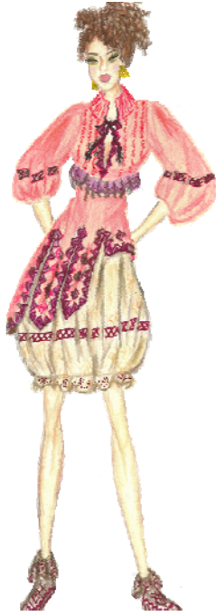
Tasarım 6. Design 6.