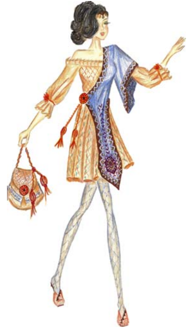
Tasarım 8. Design 8.