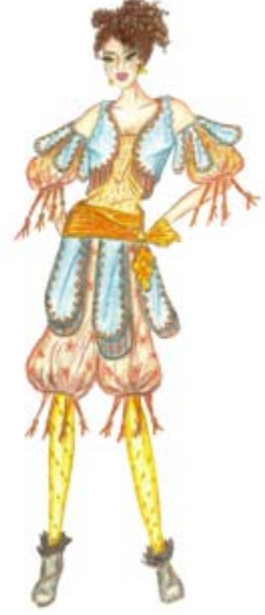
Tasarım 11. Design 11.