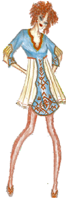
Tasarım 7. Design 7.