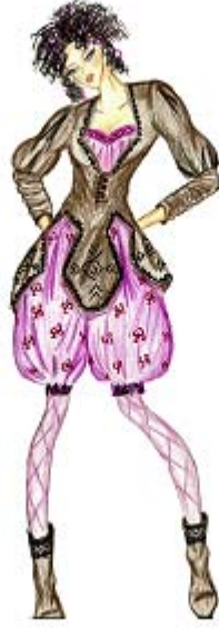
Tasarım 10. Design 10.