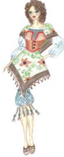
Tasarım 4. Design 4.