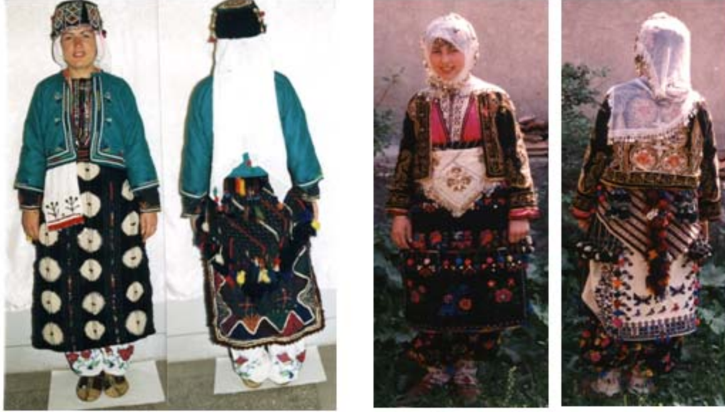
Resim 1. Bursa yöresi geleneksel kadın giysileri (Picture 1. Traditional women's clothings of Bursa)

Tasarıma esin kaynağı olarak seçilen Bursa yöresi geleneksel kadın giysisi; pek çok katmanın bir araya gelmesiyle oluşmaktadır (Welters, 1999:39). Katların sayısı ve çeşitliliği yöreye göre değişmektedir. Bursa kadın giysilerini iki temel parça oluşturmaktadır: şalvar ve fistan. Şalvar ve fistan üzerine geleneksel Türk giysilerinin bütünleyici bir unsuru olan işlemeli entari veya üçetek ismi verilen giysi giyilir. Üçetek üzerine ise güdük adı verilen bir cepken giyilir (Welter, 1999:41). Yöreye özgü birbirlerinden değişik motiflerle işli önlük, bel çevresini kalçaya doğru saran şal kuşak, boyanmış keçi kılından veya yünden elde edilen ucu püsküllü dizge ve ön bedeni koza ipliği ve sutaşlarıyla işli olan işlik ve sıktırma giysiyi tamamlamaktadır. Başa giyilen fesin üzerine bağlanan renkli pullu eşarp ve beyaz tülbindin uçlarına renkli kanaviçe işlenmiş bürgü giysiye yöresel özelliğini katmaktadır (Şentürk, 2007).