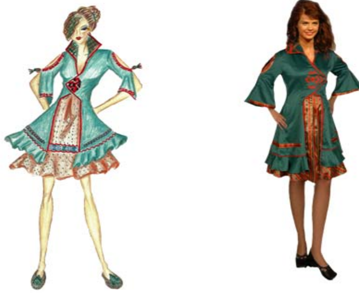
Tasarım 12. Prototip Design 12. Prototype Şekil 8. Tasarım 12 ve prototip Figure 8. Design 12 and Prototype

Güdüğün (cepken) üç etekle birleştirilerek uzatılmasıyla biçimlendirilen 12. tasarım geleneksel giysilerdeki çok katlı giyim tarzından esinlenilerek tasarlanmıştır. İki kat görünümünde tek parça olarak hazırlanan tasarımda, alt giysi kumaşı olarak çizgili kutnu, üst parça için meydana kullanılmıştır. İşlik kapamasıyla aynı özelliğe sahip olan ön kapamasına önlüklerde kullanılan geleneksel motif applike edilmiş ve etek ucu volanlarla süslenmiştir. Eteğin iki katının uçlarında kullanılan volan ve kol ve yaka çevresinde kullanılan biyeler tasarımda tekrarı vurgulamaktadır. Etek ucunda kullanılan yörenin vazgeçilmez süslemesi sutaşı, etek kıvrımına hareket kazandırmıştır. Katlı görünümüne rağmen tek parçadan oluşmasıyla kolay giyinme özelliğine sahip olan giysi tasarımının geniş eteği ve yırtmaçlı kolları da işlevselliğini artırmaktadır. Renk, süsleme ve biçim özellikleri ile de sembolik değer kazandırılmış olan giysi tasarımı prototip olarak üretilmiştir.