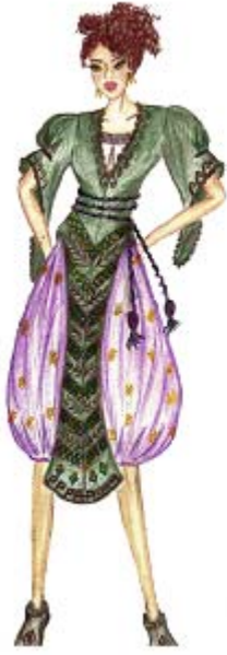
Tasarım 9. Design 9.