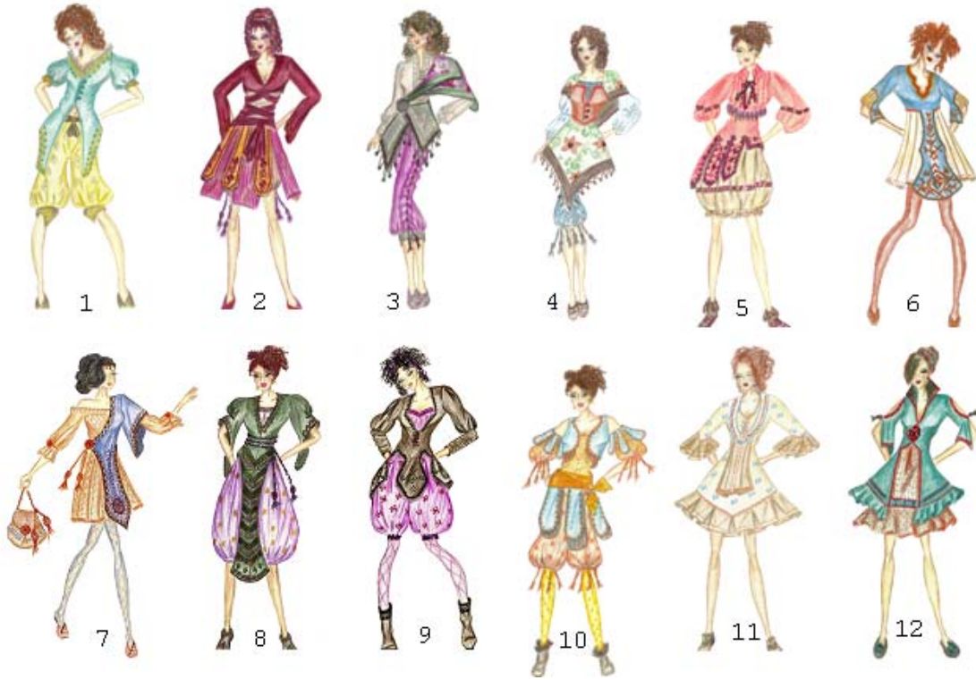
Şekil 3. 12 giysi tasarımından oluşan koleksiyon (Figure 3. The collection consists of 12 clothing design)

Tasarım öge ve ilkeleri doğrultusunda tasarım süreci izlenerek oluşturulan koleksiyonda; geleneksel giysi parçalarının biçim, form, renk, kumaş ve zengin süsleme özelliklerinin tasarımcının yaratıcılığına farklı bir boyut kazandırarak, koleksiyonu oluşturan tasarımlara yeni ve özgün nitelik kazandırdığı görülmektedir. Giysilerin kol, yaka, kup, yırtmaç gibi form özellikleri tasarımların silüetini belirlemede yönlendirici olurken, aynı zamanda giysinin fonksiyonel değerini de artırmaktadır. Şalvara monte edilen işlemeli paçalık, üç eteğin arka parçasındaki sutaşlarıyla işli motifler, üzeri yöresel motiflerle işli önlük, uçları işli ve püsküllü şal kuşak ve dizge, eski gümüş paralarla süslenmiş cingilli bağlama gibi süsleme özellikleri ise tasarımların sembolik değerlerini artırmada tasarımcıya esin kaynağı olmuştur.