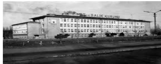
Şekil 1. Et ve Balık Kurumu

Et ve Balık Kurumu, su ürünleri araştırma ve geliştirme konularında Hidrobiyoloji Araştırma Enstitüsü ile birlikte bir çok su ürünleri araştırma projesinin gerçekleştirilmesini sağlamış, avcılık sonrası kayıpların minimize edilerek sektörün gelişmesine önemli katkılar yapmıştır (DPT, 2001). Ancak, ne var ki 1990'lı yıllarda 35 iş yerinde faaliyet gösteren kurumun 18 işletmesi satılmış, 5 işletmesi kamu kurumlarına bedelsiz olarak devredilmiş, 3 işletmesi ise kapatılmıştır. Akabinde (1993 yılı) Yüksek Planlama Kurulu kararı ile kurumun adı Et ve Balık Ürünleri A.Ş., 2005 yılında yayınlanan bir kararname ile de Et ve Balık Kurumu Genel Müdürlüğü, son olarak da 2013 yılında Bakanlar Kurulu Kararı ile Et ve Süt Kurumu olarak değiştirilmiştir.