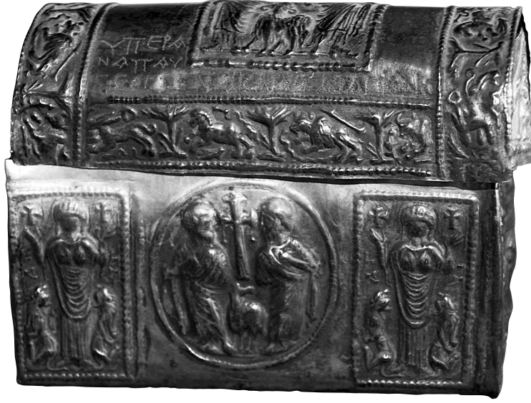
Res. 5 Adana Müzesi, Çırğa Rölikeri'ndeki Azize Thekla tasviri