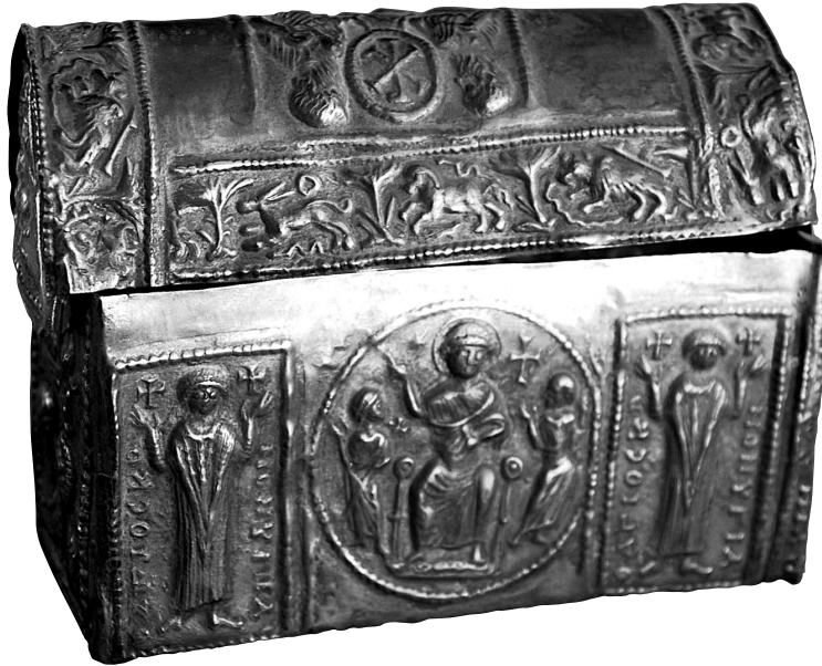
Res. 6 Adana Müzesi, Çırğa Rölikeri'ndeki Aziz Konon tasviri