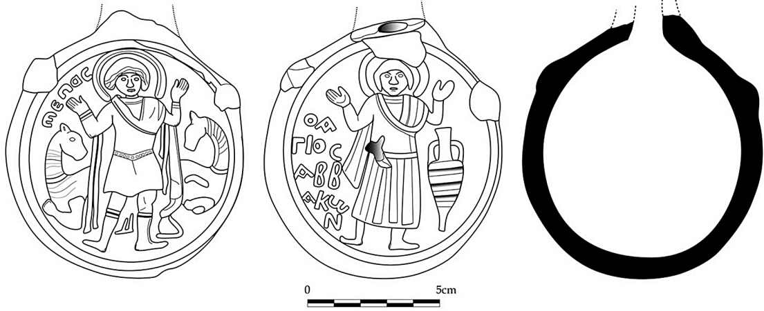
Res. 3 Aziz Konon tasvirli Menas Ampullası'nın çizimi