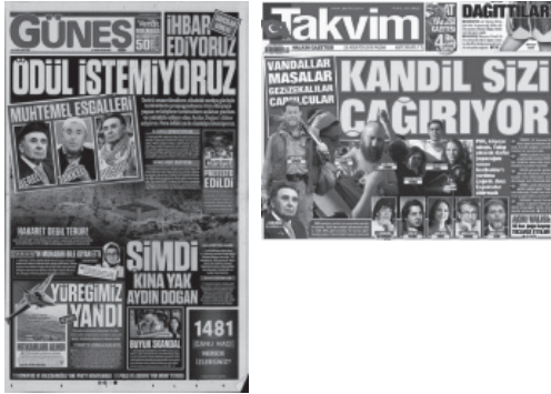
Güneş, 08.09.2015 20 ; Takvim, 23.08.2015

Buradaki “düşman” retoriğini gazetecilerden önce, devletin üst kademe yöneticileri kullanmaktadır. Yani basitçe “medya” ayırımı, savaş dilinin özgün yaratıcısı gibi görülmemelidir. 28 Şubat 2015 tarihinde HDP ve AKP temsilcilerinin Dolmabahçe’de açıkladıkları mutabakattan kısa süre sonra Cumhurbaşkanı Erdoğan’ın bu retoriği kullanarak “Kürt sorunu yok” demeye başlaması, AKP mediasındaki kalemlerin de aynı doğrultuda saf tutmasının temel nedenidir: