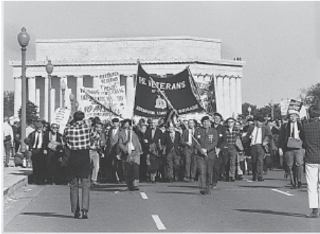
Abraham Lincoln Tugayı'nın Vietnam Savaşı Protestosu 1969

Özellikle ABD askerlerinin Güney Vietnam'da yüzlerce silahsız sivil öldürdüğü 16 Mart 1968 tarihli My Lai Katliamının duyulmasından sonra savaş karşıtı hareket ivme kazanmış, 15 Ekim 1969 tarihinde milyonlarca Amerikalının katıldığı sokak protestoları gerçekleştirilmiştir. Bu eylemlerin inanılmaz ölçüde artmasında, Vietnam'dan geçilen haberlerin önemli bir katkısı olsa gerektir 6 .