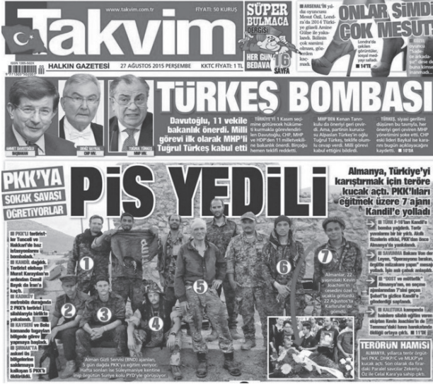
Takvim, 27.08.2015: “Pis yedili: Almanya Türkiye’yi karıştırmak için teröre kucak açtı”