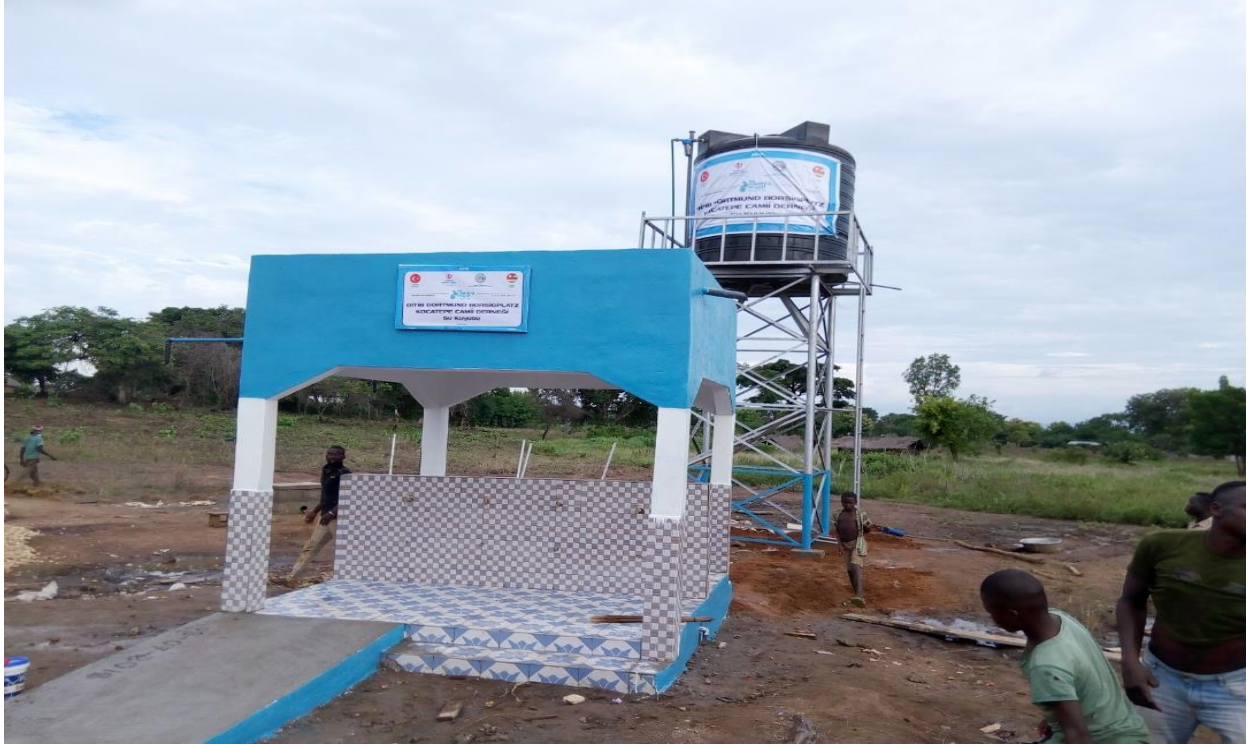
Şekil 1: Türkiye Diyanet Vakfı'nın yardımıyla CCSFTT dernek tarafından, Alokpadè köyünde kurulunan su kuyusu

Göçmenlerin kendi topluluklarında neden oldukları onca problemlere rağmen kendi topluluklarının gelişimine sağlayacakları katkıları göz ardı etmemek gerekmektedir. Bu katkılar eğer iyi yönetilir, iyi organize edilirse toplulukların, özellikle Orta Togo bölgesinin kalkınmasında adeta bir motor görevi üstlenebilmektedir.