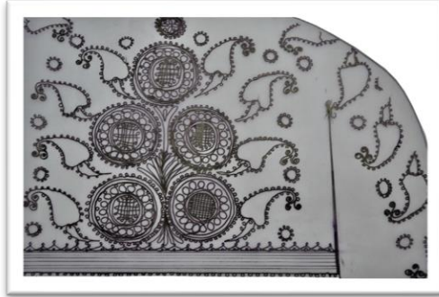
Çizim 1, Güneş gülü, hayat ağacı ve şal motifi

Tanımı: Hâkim yakalı, uzun kollu, önü acık cepken, siyah renkli ipek kadife kumaştan dikilmiştir. Cepkenin etek boyu kısadır. Kolu düz takma kol, koltuk altında rahat olması açısından “kuş” adı verilen parça eklenmiştir. Bedenin ön, yaka ve etek kenarları harçla temizlenmiştir. Cepken sarı simli ince bükülmüş kordonla kendi renginde iplik kullanılarak kordon tutturma tekniği ile süslenmiştir. (Fotoğraf 1, 2)