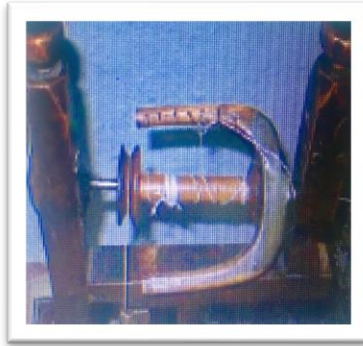
(Baran, Koca, Koç, 2014: 7)