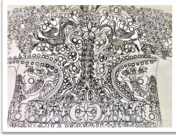
Çizim 6, cepken arka süsleme detayı