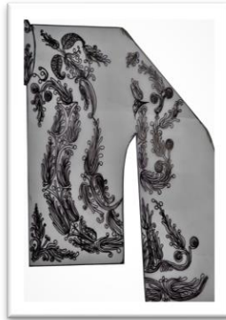
Çizim 2, Çengel ve şal deseni motifi

Tanıımı: Hâkim yakalı, önü açık, bel hizasında olan cepken mor renkli ipek kadifeden dikilmiştir. Kolları düz takma koldur. Koltuk altında rahat hareket edilmesi için “kuş” adı verilen parça eklenmiştir. Kol ağızları yırtmaçlı, biritli ve düğmelidir. Cepken sarı simli kordon kullanılarak kordon tutturma tekniđiyle süslenmiştir (Fotoğraf 3).