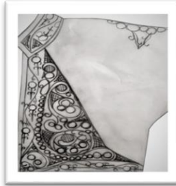
Çizim 3, Geometrik süsleme motifleri

Tanımı: Cepken; kahverengi çuha kumaştan dikilmiştir. Cepken düz beden üzerine, önden açık ve kapama yapılmadan tasarlanmıştır. Cepkenin boyu belde ve yakası hâkim yakadır. Kollar bedene düz, takma kol tekniği ile takılmıştır. Kolun rahat hareket edebilmesi için kol alt dikişlerine kuş parçaları çalışılmıştır. Cepkenin kol ve etek ucu düz kesimlidir (Fotoğraf 4, 5). Cepkenin omuzları dikişli ve arka ortası dikişsiz kumaş katından uygulanmıştır. Üçgen biçimli süsleme kompozisyonunda stilize edilmiş girift geometrik şekiller oldukça yoğundur. Bitkisel bezemeye az miktarda yer verilmiştir. Balıksırtı şeritlerde çırpma tekniği, işlemede kordon tutturma tekniği uygulanmıştır.