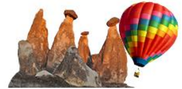
Cappadocia - Göreme Open Air Museum / Nevşehir