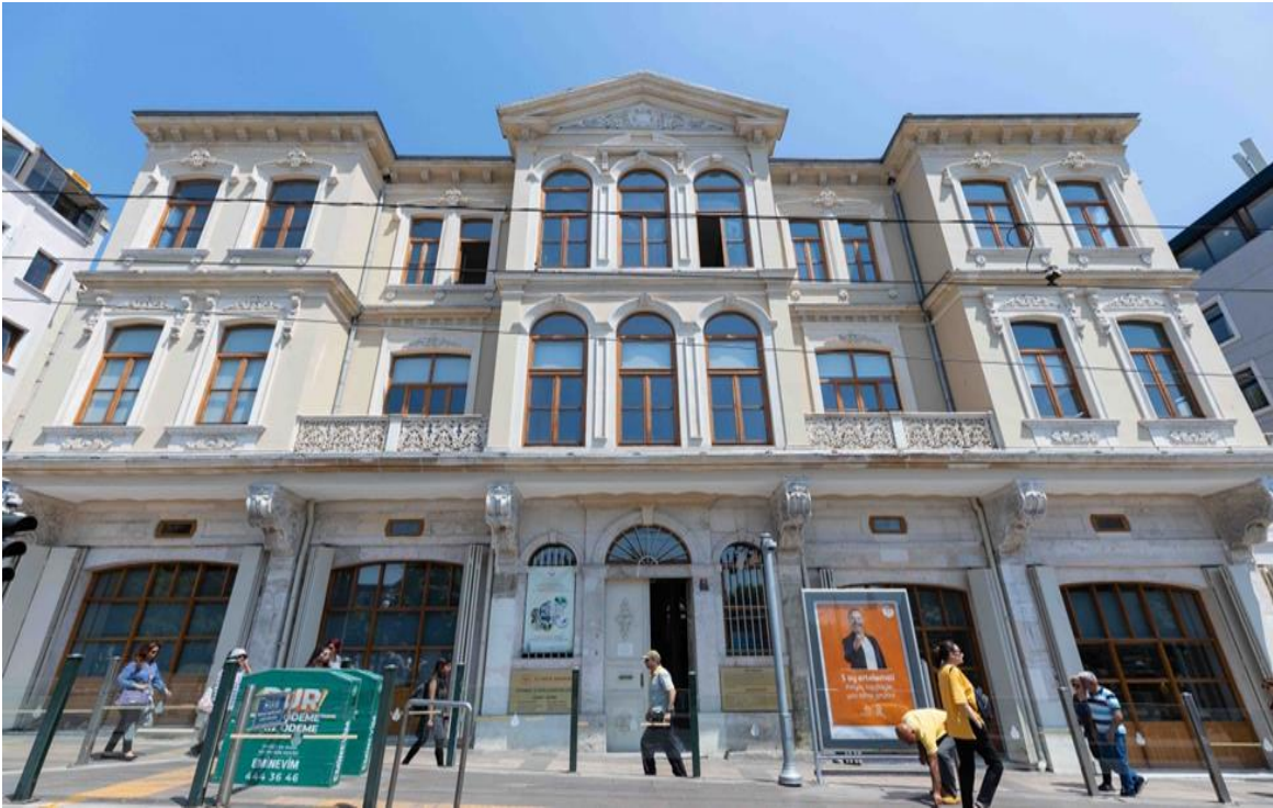
Fotoğraf 2. Yeni ( http://www.istanbul.gov.tr/kurumlar/istanbul.gov.tr/promo/saglik-muzesi-1.jpg )