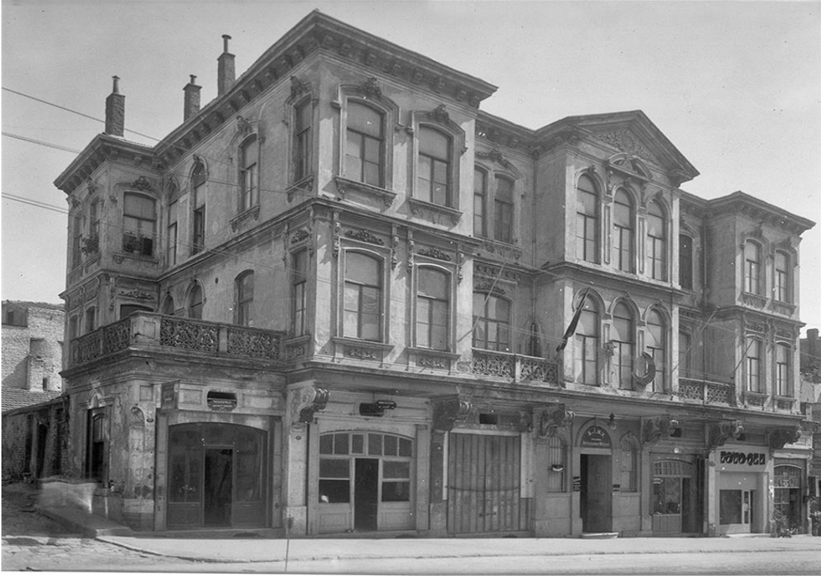
Fotoğraf 1. Eski ( https://dosyaism.saglik.gov.tr/Resim/81376.muze-eskijpg.png?0 )