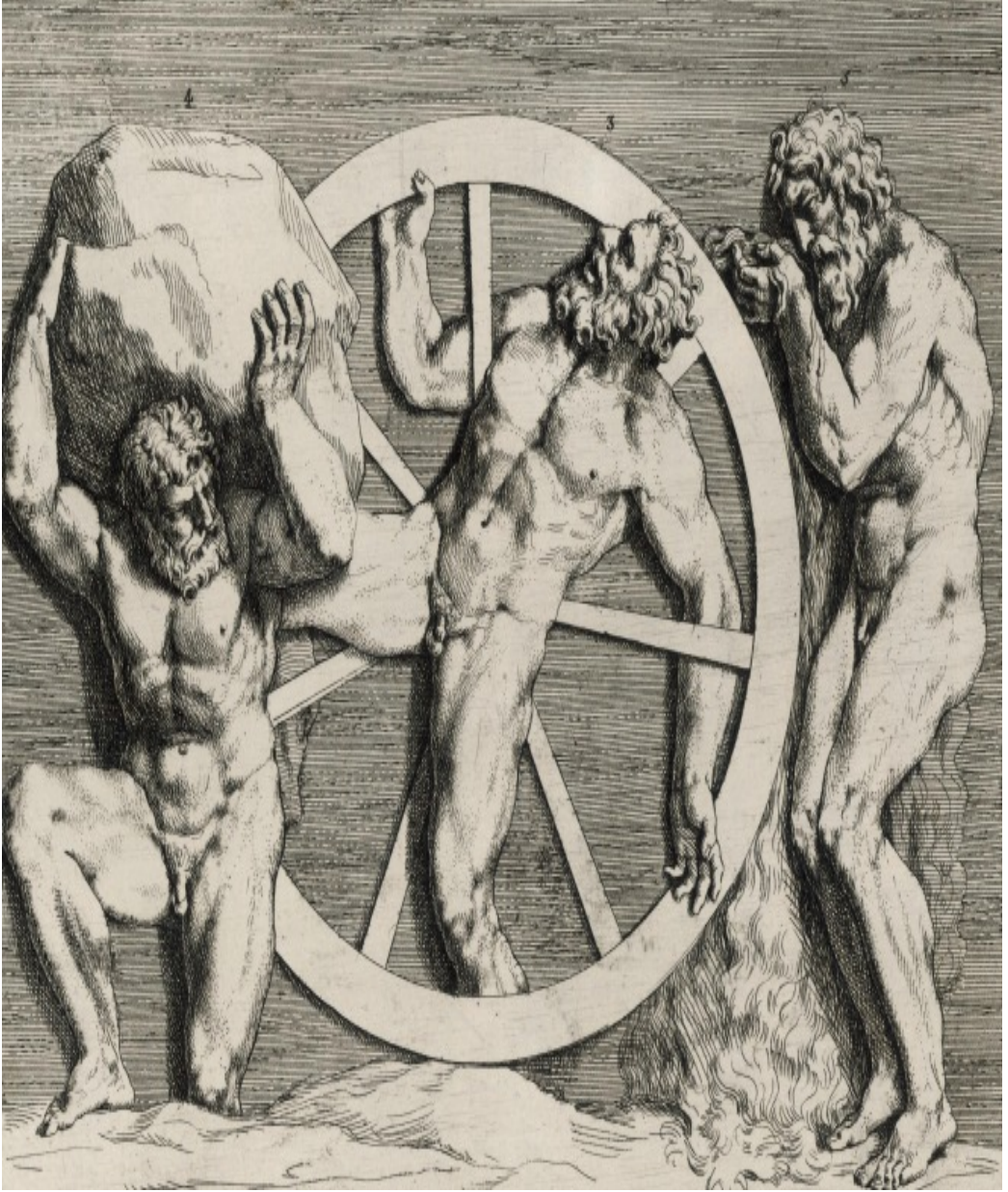
Sisifos ve Bitmeyen İşkence Çarkındaki Eziyet Torture: le retour de Sisyphe Jérôme Leroy - 3 Eylül 2016