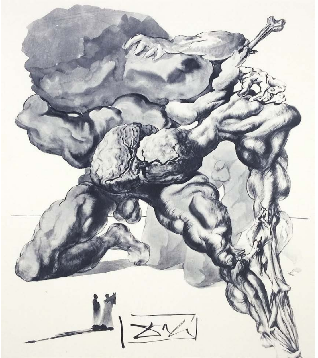
Açgözlü ve Savurgan (the Avaricious and the Prodigal) Salvador Dalí (1904-1989)