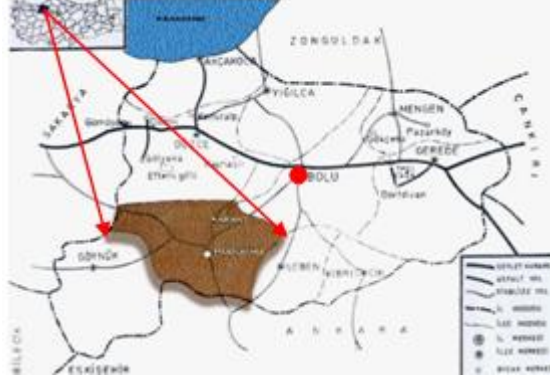
Şekil 1. Mudurnu'nun Türkiye ve bölge içindeki konumu

Mudurnu'da deniz iklimi ile İç Anadolu iklimi arasında bir geçiş görülür ancak İç Anadolu iklimi hakimdir. Yazlar ılık, kışlar ise oldukça soğuktur. Kış ve ilkbahar ayları yağış aylarıdır. Sıcaklık ortalama 9,3 C°, nispi nem oranı % 68, yıllık yağış ortalaması 570 mm.dir [3].