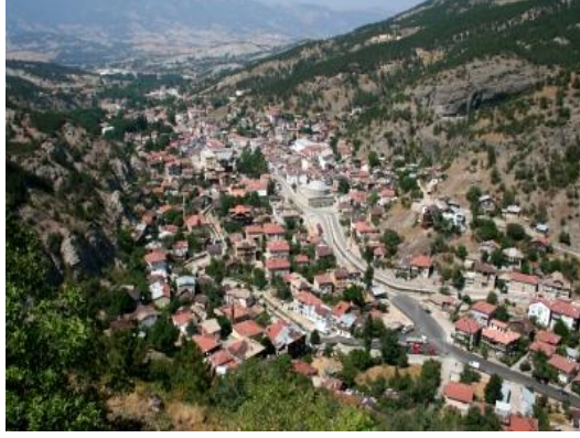
Şekil 3. Mudurnu kent dokusunun günümüzdeki görünümü

Kent merkezindeki çarşı 20. yüzyıl başlarında yapılmış olan 1 ve 2 katlı ahşap strüktürlü dükkanlardan oluşmaktadır. Kentteki çarşı iğnecilik, çakıcılık, bakırcılık, demircilik gibi zanaat kollarını içermektedir. Çarşı; birbirine paralel 3 sokaktan ve bunları belli mesafelerde kesip, birbirine bağlayan ara yokuşlu sokaklardan meydana gelir. Dükkanlar karşılıklı olup, büyüklükleri yaklaşık aynıdır. Plan şeması kabaca; dikdörtgen bir ana mekan, bazen arkasında bazen üstünde depo ve imalat bölümleri şeklindedir [7].