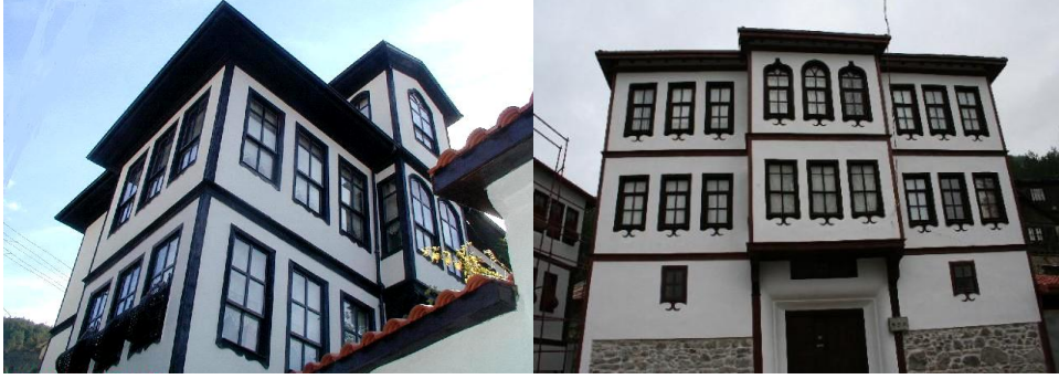
Şekil 6-7. Mudurnu kenti geleneksel konut mimarisinden bir görünüm

ormanın ve dolayısıyla ahşap ürünlerin bol ve ucuz olması nedeniyle yapılarda ahşap yığma ya da ahşap karkas sistem uygulanmıştır [8].