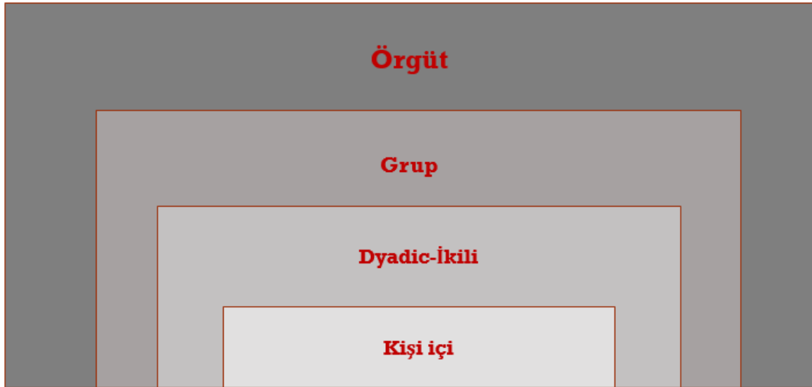
Şekil 3. Liderlik yazınının sınıflandırılma düzeyleri (Yukl, 2010, 33).

Liderlik alan yazını bireysel, grupsal ve örgütsel olarak üç bölümde sınıflandırılmaktadır (Dionne vd., 2014). Lussier ve Achua (2010) bireysel düzeyi bu sınıflandırmanın en önemli bileşeni olarak ifade etmektedir. Bazı kaynaklarda ise bireysel liderliğin önemi vurgulanmakta ve bireysel liderlik ikiye ayrılmaktadır (Yukl, 2010). Şekil 3 liderlik yazınının sınıflandırılma düzeylerini göstermektedir.