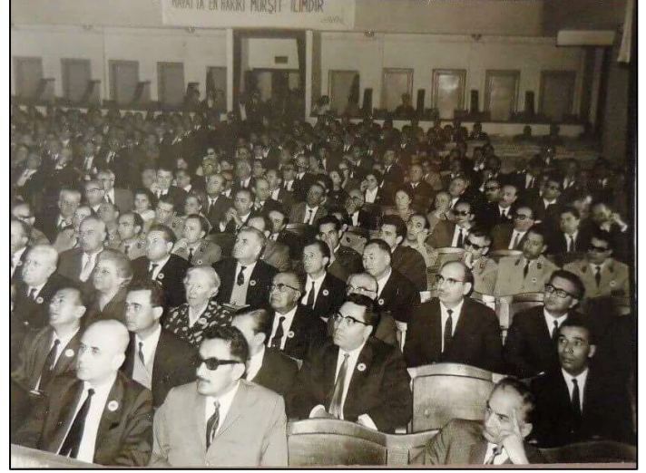
Şekil 1. Dilan Sineması'nda bir siyasi partinin toplantısı 1950'li yıllar [4]

ve benzeri gibi amaçlarla da kullanılmıştır. Bu bakımdan çok amaçlı kullanım, çok daha fazla insan grubunu bu yapılara yöneltmiştir. Birçok konserin verildiği büyük kapalı sinemaların başında Dilan Sineması gelmektedir (Şekil 1).