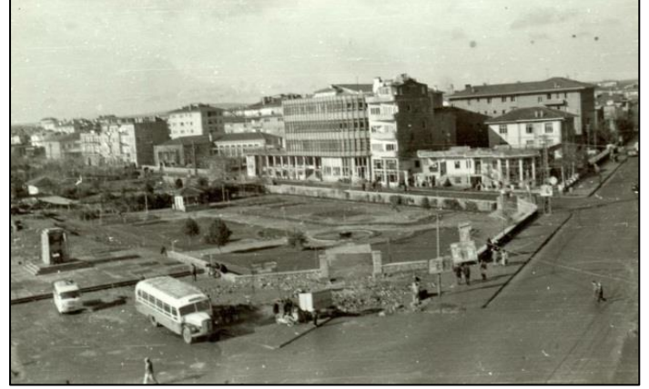
Şekil 4. Dilan Sineması ve Emirgan Çay Bahçesi [4]

1950'li yılların sonlarında Dilan Sinemasının bulunduğu alanda konumlanan Emirgan Parkı ve çevresindeki eğlence yerleri Diyarbakır'ın kültürel ve toplumsal yaşam kalitesinin en üst seviyelere çıktığı yerler olarak göze çarpmaktaydı (Şekil 4)