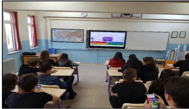
Fotoğraf 5: Web 2.0 Araçlarıyla Coğrafya Öğretimi Kahoot Çalışmaları

Çevrimiçi sınav aracı olarak kullanılan bir web 2.0 aracıdır. Bilgisayar, telefon ve tablet ile kullanılabilen araç; sınavı oyun formunda etkinliğe dönüştüren bir programdır. Ders sonunda etkileşimli tahtadan kahoot çevrimiçi sınavı açılmıştır. Öğrenciler ekranda görülen kodu kullanarak akıllı telefonları ile yarışmaya katılmışlardır (Fotoğraf 5). Öğrenciler etkileşimli tahtadan soruları takip etmişler, cevaplamayı telefonlarından seçeneğin rengini seçerek yapmışlardır. Sınavda ilk beşe giren öğrenciler yarışma sonunda ortaya çıkmıştır.