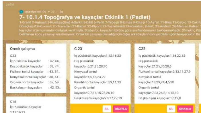
Fotoğraf 2: Web 2.0 Araçlarıyla Coğrafya Öğretimi Padlet Çalışmaları

Öğrencilere ilk hafta sonunda topoğrafya ve kayaçlar etkinlik 1 ve 2 padlet çalışmaları yönergeyle gönderilmiştir (Fotoğraf 2). Ders dışı etkinlik şeklindeki çalışmalar öğrencilerin diğer arkadaşlarının cevaplarını göremeyecekleri şekilde ayarlanmıştır. Çalışmalar tamamlandıktan sonra öğretmen tarafından içerik kontrolü sağlanarak pdf formatında dokümana dönüştürülmüştür.