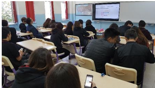
Fotoğraf 4: Web 2.0 Araçlarıyla Coğrafya Öğretimi Mentimeter Çalışmaları

Anket aracı olarak kullanılan bir web 2.0 aracıdır. Araç konu ile ilgili anket ya da kelime bulutu çalışması yapmak için kullanılabilir. Öğrencilerle püskürük kayaç, tortul kayaç ve grubunu hatırlamakta zorlandıkları üç kayaç ismi yazdıkları mentimeter çalışmaları yapılmıştır (Fotoğraf 4).