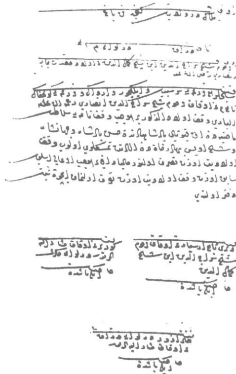
Şeyh Siraceddin Vakfı (s. 286).

Kısacası, Azerbaycan'da vakıf müessesesi kurma, onları yaşatma ve geliştirme geleneği, hükümetlerin bu sosyal kuruma karşı politikalarını açıkca sergileyecek bir panoramanın yaratılmasına hizmetedeceği düşüncesindeyiz. Bu amaçla 1593 yıl tarihli Gence-Karabağ eyaleti icmal defterinde yazılmış dört ünlü şeyh'in vakflarının yayınlanmasını uygun gördük.