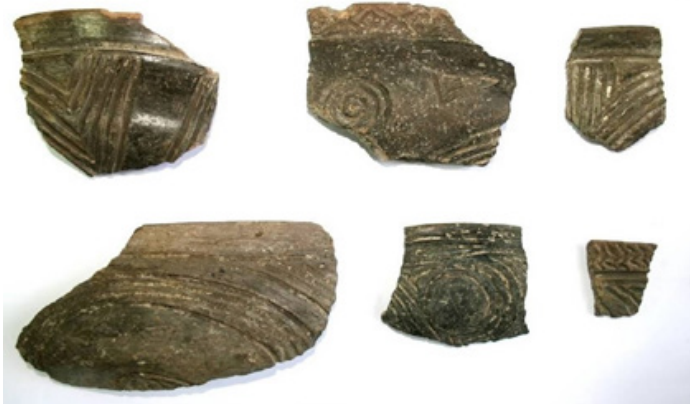
Görsel 4. Anadolu Medeniyetler Müzesi'nde bulunan, 1990-1991 yılı Güzelyurt kazı çalışmasından çıkarılan çanak parçaları. 4