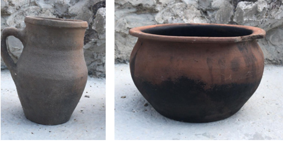
Görsel 14. Muharrem Vurgun, Civil, 1950, Kırmızı Çamur, Çarkta Şekillendirme, 25x14x10 cm. (Solda)

Gelveri çömleği ise günümüzde üretilen Gelveri çömlek formundan oldukça farklıdır. Taban kısmı dar, yukarı doğru genişleyen yapısı ile usta asıl gelveri çömleğinin bu olduğunu eklemiştir. (Bkz. Görsel 14 ) Zamanında Nevşehir ve civar illerden en çok sipariş aldığı ürünün gelveri çömleği olduğunu ifade etmiştir.