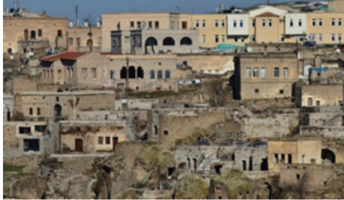
Görsel 2. Güzelyurt ilçesi görünüm. 2

Güzelyurt'un 1,5 km kadar güneybatısında, Hagios Analipheos Manastırı'nın yakınındaki Gelveri Höyüğü'nde yapılan kazı çalışmaları sırasında, yüzeyden toplanan sırsız seramik parçalarına göre höyükte Kalkolitik, İlk Tunç Çağı, Demir Çağı ve Roma yerleşimlerin var olduğu anlaşılmaktadır. Ayrıca; Hitit, Lidya ve Pers gibi birçok kültüre de ev sahipliği yapmıştır (Esin, 1993: 47-56).