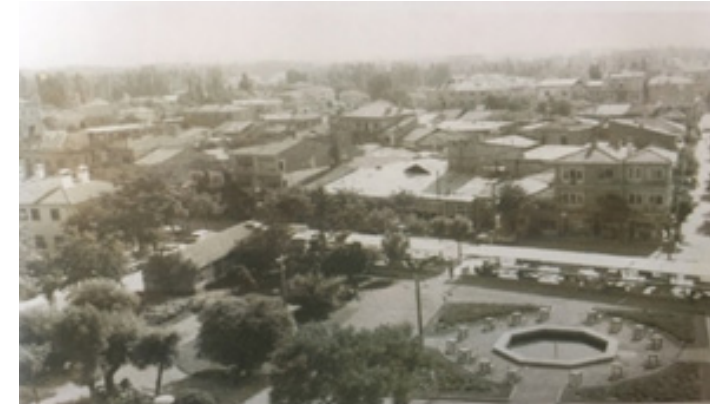
Görsel 1. Aksaray ili genel görünüm. 1

Aksaray ili Neolitik çağdan günümüze kadar farklı medeniyetlere ev sahipliği yapmıştır. Asur, Frig, Lidya, Medler, Pers, Kapadokya Krallığı, Roma, Bizans, Selçuklu Osmanlı gibi birçok uygarlığa kapılarını açan Aksaray, Anadolu'daki en eski yerleşim yeri olma özelliğini göstermektedir (Anonim, 1982-1983: 6235-6238). Kapadokya bölgesinde yer alan Aksaray; İhlara Vadisi, İpek Yolu, Tuz Gölü, Hasan Dağı, antik kentleri, tarihi yapıları, yeraltı şehirleri, termal merkezleri ve kültürel zenginlikleri ile dikkat çeken ender şehirler arasında yer alır.