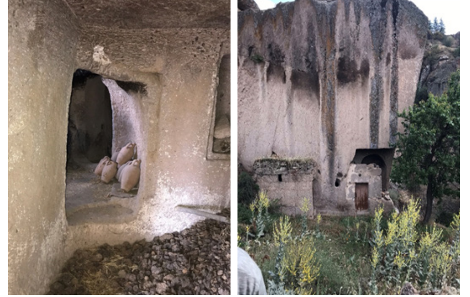
Görsel 6. Çömlek atölyesi iç (sağda) ve dış (solda) görünümü.

üç oda bulunmaktadır. Tüm üretimini bu atölyede yapan ustanın ayrıca atölyesine elli metre mesafede bir de kara tip fırını yer almaktadır. Fırının ana malzemesini yörede temin edilen taşlar oluşturmaktadır. Silindirik bir yapıya sahip olan fırının yüksekliği 1,80 m, eni ise 1,55 m ölçülerindedir. Fırını yükleme ve boşaltma işlemleri ise üzerinde bulunan kapaktan yapılmaktadır.