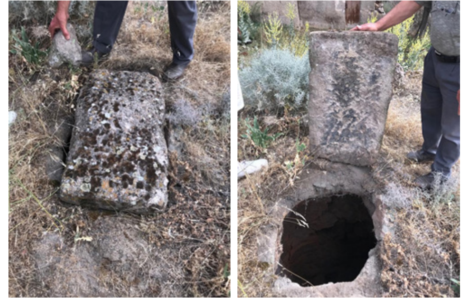
Görsel 10. Fırın yükleme ve boşaltama işleminin yapıldığı üst kapak.