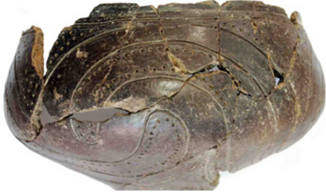
Görsel 3. Anadolu Medeniyetler Müzesi'nde bulunan, 1990-1991 yılı Güzelyurt kazı çalışmasından çıkarılan çanak. 3