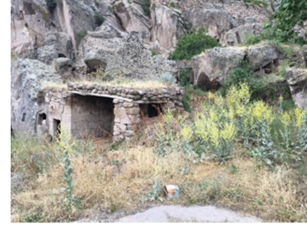
Görsel 9. Kara tip fırın genel görünüm.

tamamlandığını belirtmiştir. Alaf Dede kurutma işleminin gerçekleşeceği yerde hava akımının olmamasına (çatlamaması için) dikkat ettiğini ve kurutma işlemine alınan her bir toprak ürünü belli aralıklarla ters düz yaparak kurutma işlemini sonlandırdığını ifade etmiştir. 8