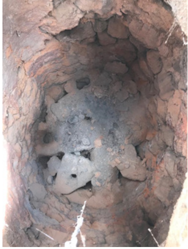
Görsel 11. Çömlekçi fırının içi. (Solda)

Usta; kuruyan toprak ürünleri, atölyenin 50 metre uzağındaki Rum ustalar tarafından inşa edilen kara fırında pişirilmek üzere fırına taşındığını ifade etmiştir. Yaklaşık 1,80 cm yüksekliği ve 1,55 cm eninde silindir bir yapıya sahip olan fırın Gelveri yöresinde çıkan yöreye özgü taşlardan örülerek yapılmıştır. Ürünleri fırının üstünde bulunan küçük kapıdan içeri girip, silindir şeklindeki fırının içinde ayaklarını iki yana açarak yükleyen usta boşaltma işlemini de yine aynı şekilde yaptığını ifade etmiştir.