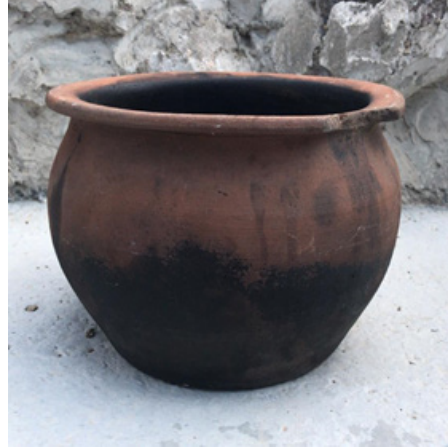
Görsel 17. Metin Nalbantoğlu, 2019, Günümüz Gelveri Çömleği, Kırmızı Çamur, Çarkta Şekillendirme, 25x30cm. (Solda)