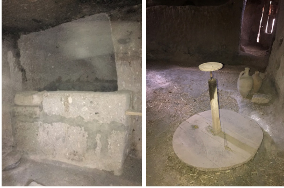
Görsel 7. Atölyenin içinde yer alan çamur havuzu. (Solda) Görsel 8. Çömlekçi çarkı. (Sağda)

su ile doldurulmuş çamur havuzuna kürek yardımı ile göz kararı bir kara toprak bir de beyaz kumdan attığını söylemiştir. Birkaç gün bekleddikten sonra dinlenen çamuru ayakları ile dört-beş saat belli aralıklarla çiğnedikten sonra çamurun kullanıma hazır olduğunu belirtmiştir. 6