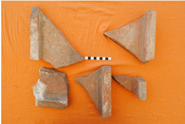
Lev. 7. Kazıda bulunan kiremit parçalarından bir bölüm.