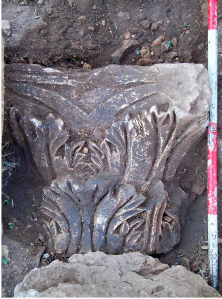
Lev. 4. Manastırda yapılan kazıda bulunan korinth sütun başlığı.