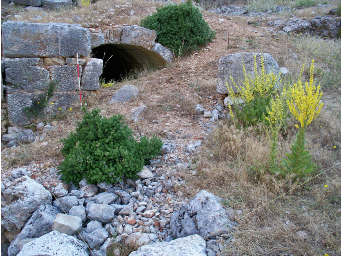
Lev. 1. Kazı öncesinde tonozlu mezarın görünümü.