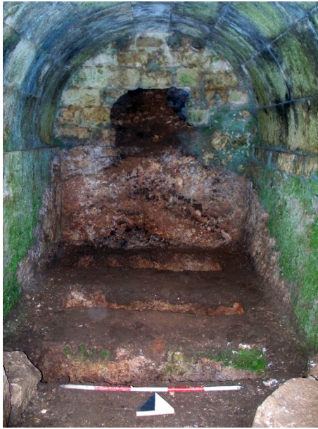
Lev. 2. Tonozlu mezarın içindeki yeni bulunan mezar yerleri.