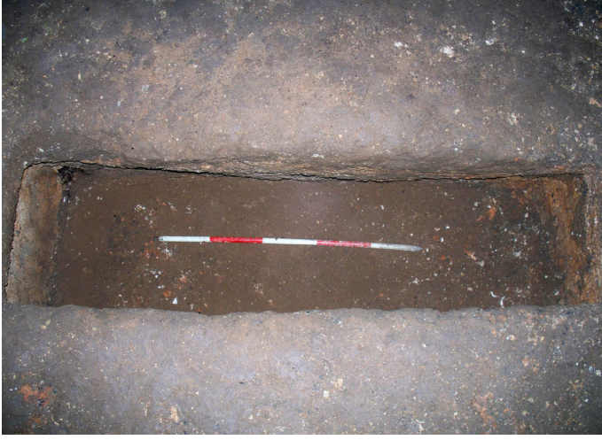
Lev. 3. Mezar 2.