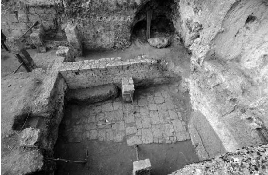
Lev. 2: Olba Manastırında ana mekânda yer alan alt kat kuzey -mahzen- ve güney odalarının görünümü.