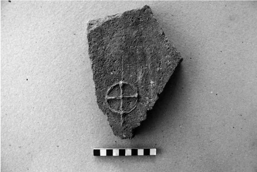
Lev. 6: Olba Manastırında bulunan Yunan haçı kabartmalı çatı kiremiti parçası.