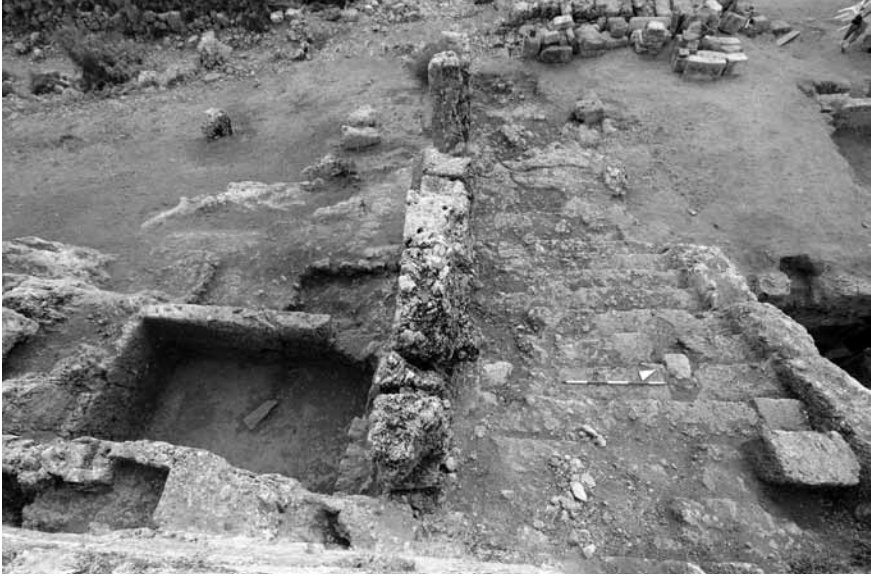
Lev. 5: Manastırın güney girişindeki tekne ve merdiven basamaklarının kazı sonrası görünümü.