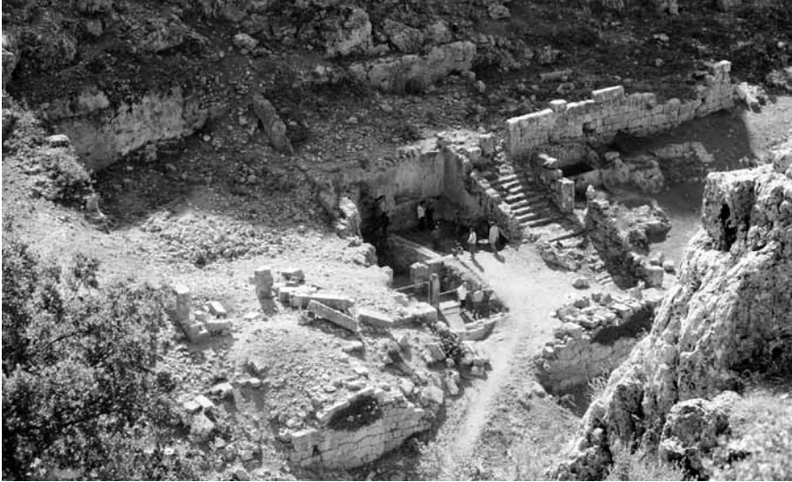
Lev. 1: Olba Manastırı kazıları ve yapının genel görünümü.