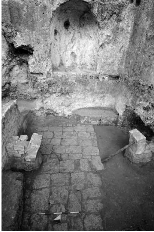
Lev. 3: Alt kat güney odasının kazı sonrası görünümü.