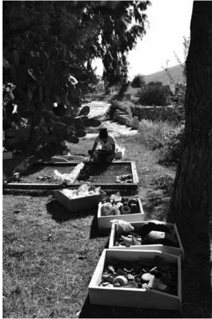
Lev. 2: Depodaki eserlerin temizlenmesi ve tasnif çalışmaları.