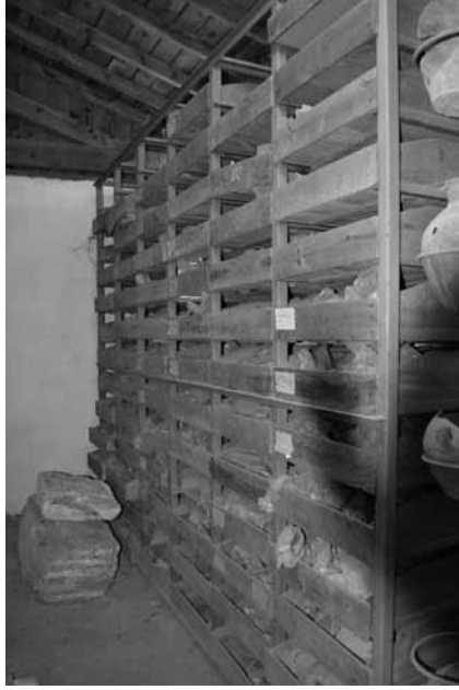
Lev. 1: Ayasuluk Tepesi ve St. Jean Anıtı kazı deposu 2012.