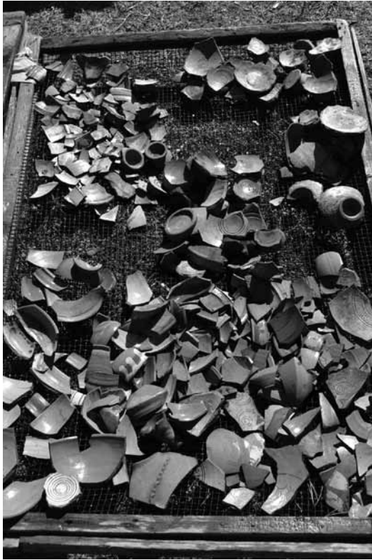
Lev. 4: Geç Bizans Sgraffitoları veya Zeuxippus Türevleri.