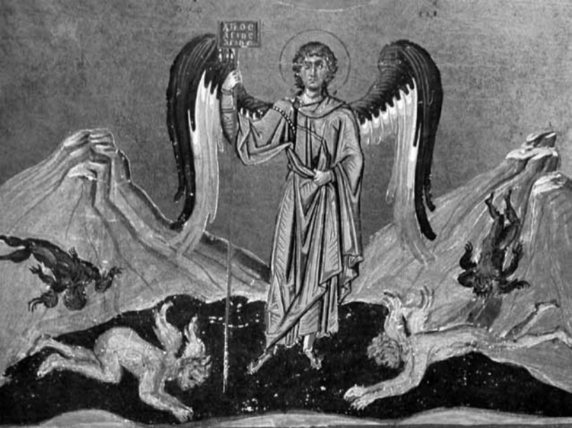
Lev. 2: Bir Bizans minyatrnde Őeytanı yenmiŐ, kt ruhlara baŐ eđdirmiŐ baŐmelek Mikail, 11. II. Basil Menelogion'u MS Graec.1613, Roma, Vatikan Ktphanesi.