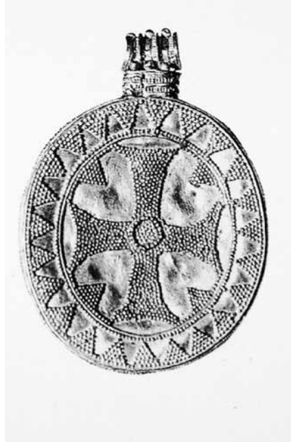
Lev. 10: Altın pandantif, ön yüzündeki kahverengi cam üzerinde Aziz Theodore, arka yüzde büyük bir haç granülasyon tekniğiyle işlenmiştir. Washington, D.C., Dumbarton Oaks Koleksiyonu (env. no. 38. 28), 12. yüzyıl.