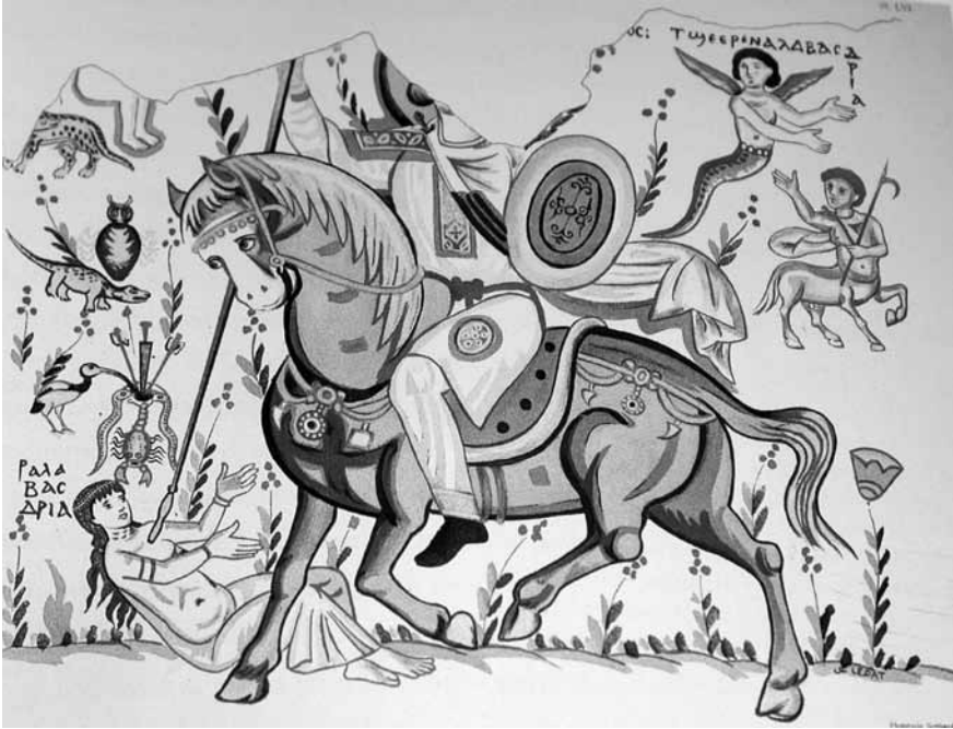
Lev. 6: Üzerinde Alabasdrria tasviri olan bir muskanın ön ve arka yüzleri.