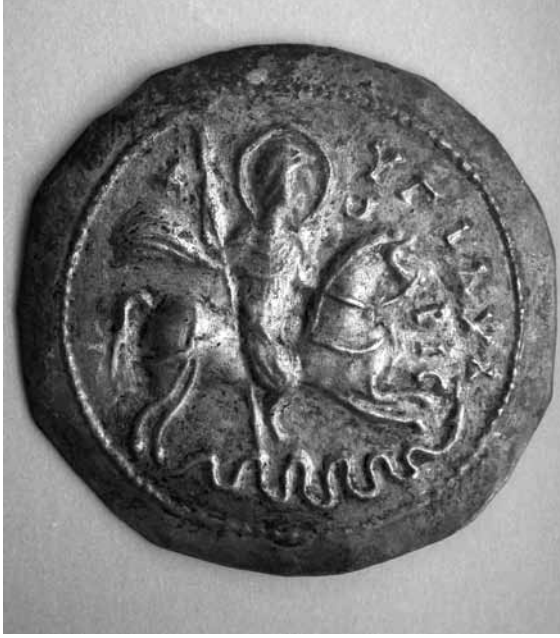
Lev. 7: Silifke Müzesinden 2404 env. no'lu gümüş madalyon tılsım.