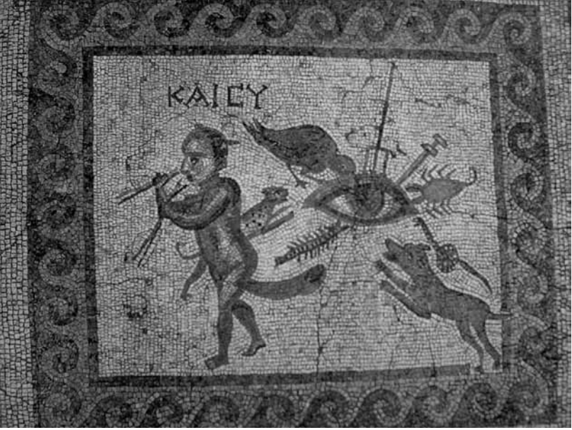
Lev. 1: Hatay Arkeoloji Mzesi'ndeki Kem gz mozađı.