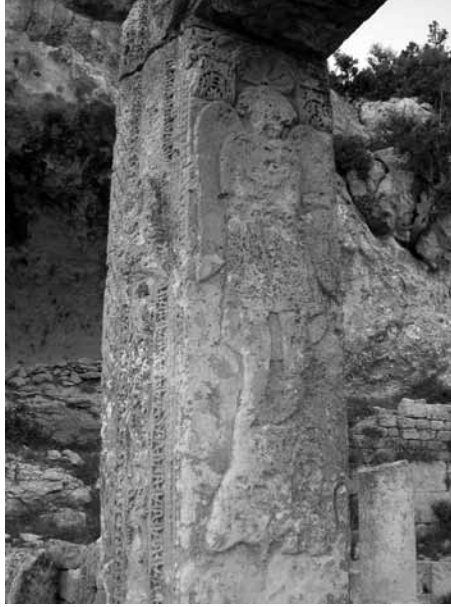
Lev. 3: Mut, Alahan Manastırı Batı Kilisesi'nin orta kapısının iki yan tarafındaki kabartmada şeytanı ezen Başmelek Mikail tasvir edilmiştir.