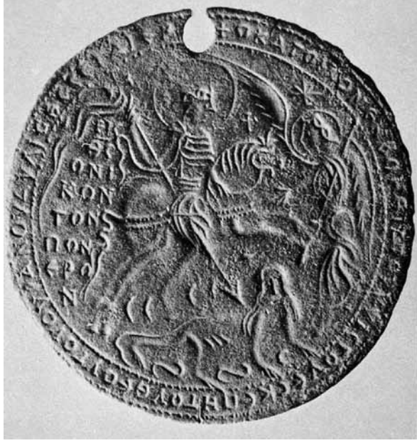
Lev. 5: Washington, D.C., Dumbarton Oaks Koleksiyonu'nda yer alan madalyon tilsimin ön yüzünde kutsal binicinin dişi şeytanı yenmesi tasvir edilmiştir.