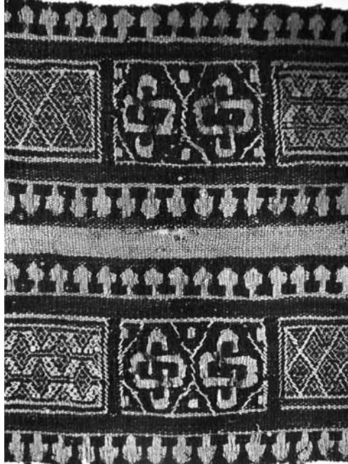
Lev. 4: Kıptilere ait bir dokuma üzerinde "Süleyman düğümü" denilen tılsım amaçlı kullanılmış haç deseni, Kahire, Kıpti Müzesi, 5. -7. yüzyıl.