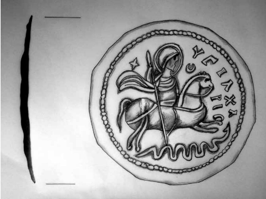
Lev. 8: Silifke Müzesi 2404 env. no'lu gümüş madalyon tılsımın çizimi.