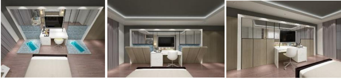
Şekil 2. Namaz kılma biriminin kullanım aşamaları

fonksiyonel rahatlık ve konfor ile birlikte psikolojik olarak da ibadeti destekleyen bir nitelik taşımaktadır.