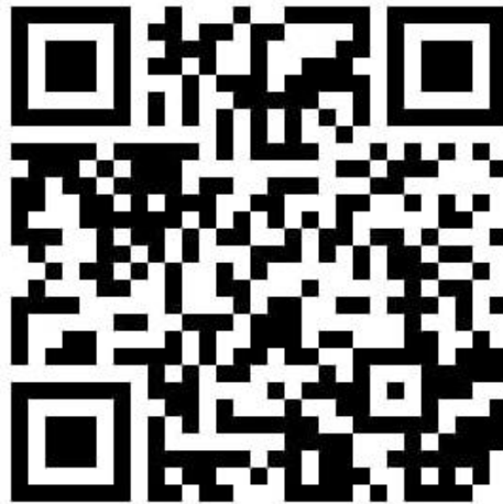
Şekil 3. Kullanımı önerilen namaz kılma birimi animasyonu (URL-1, 2020)

piyçası içinde farklılaşan çözümlerin hedef kitleye özel olarak üretilmesi, mekânların birer cazibe odağı haline gelmelerine olanak vermektedir. Bahsi geçen bu modülün çalışma prensibi Şekil 3'te yer alan QR kod aracılığı ile izlenebilmektedir (Şekil 3).