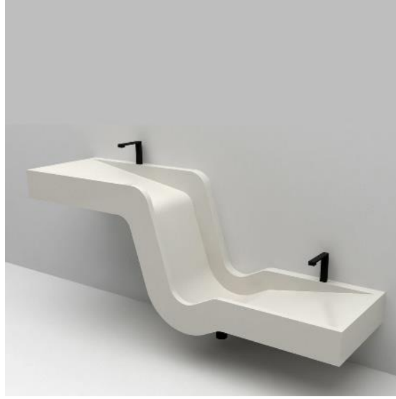
Şekil 4. Lavabo tasarım önerisi 1 "Vav"