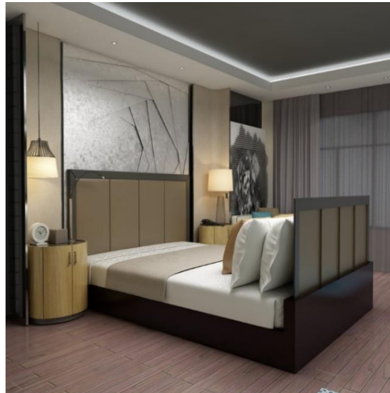
Şekil 6. Yatak başlığı tasarım önerisi