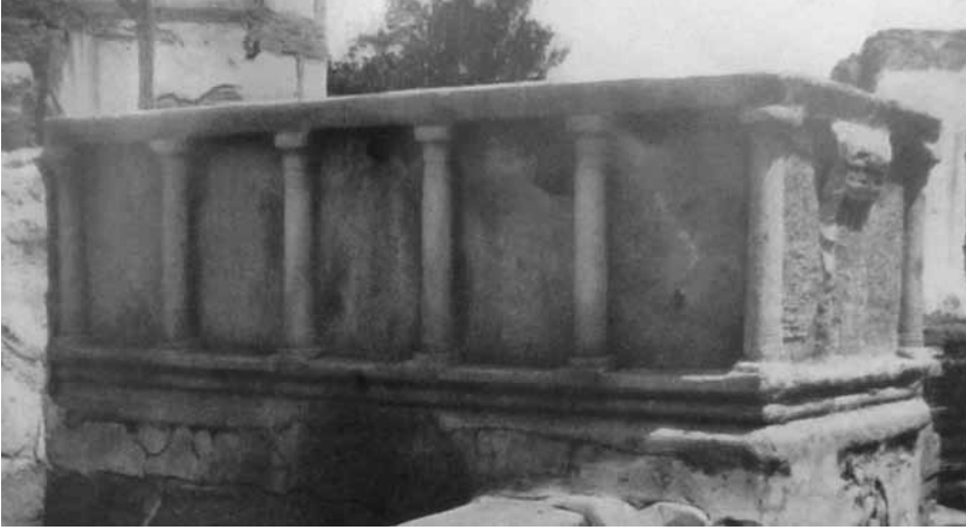
Lev. 1: İznik Müzesi'nde bulunan Geç Hellenistik Dönem Sütunlu Lahdi (Kleiner 1957, Taf. 5, 1.).