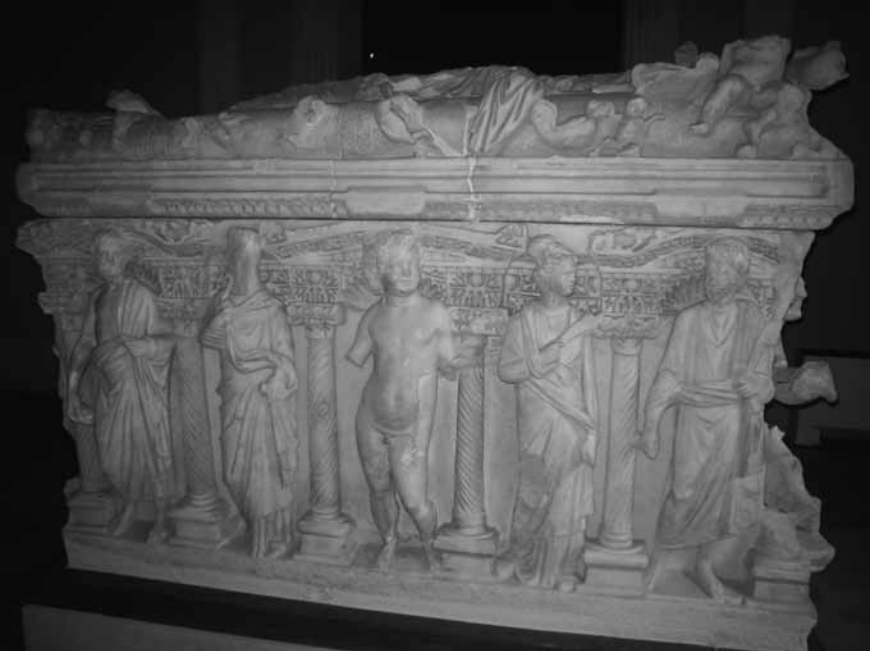
Lev. 4: İstanbul I lahdi uzun yüzü (İstanbul Arkeoloji Müzeleri).