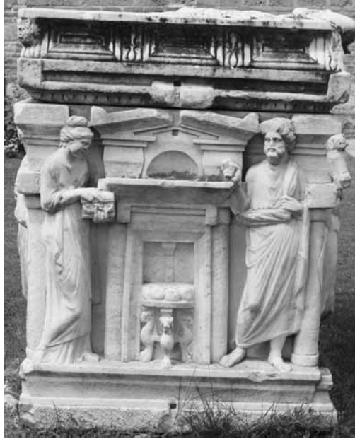
Lev. 7-8: İznik Müzesi'nde bulunan Sütunlu lahdin kısa yüzleri ( http://www.flickr.com/search/?q=iznik%20musuem-16.06.2013 ).