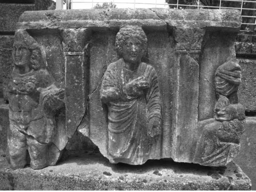
Lev. 3: Bursa G Arşitravlı Lahdi (Bursa Arkeoloji Müzesi).