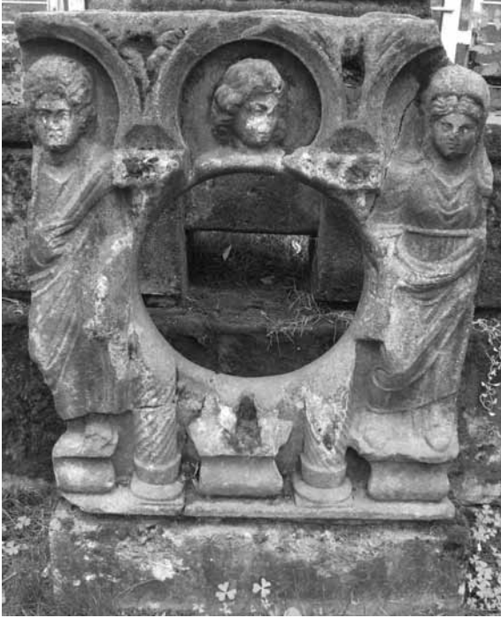
Lev. 2: Bursa E Kemerli Lahdi (Bursa Arkeoloji Müzesi).