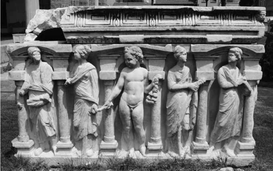
Lev. 5-6: İznik Müzesi'nde bulunan Sütunlu lahdin uzun yüzleri.