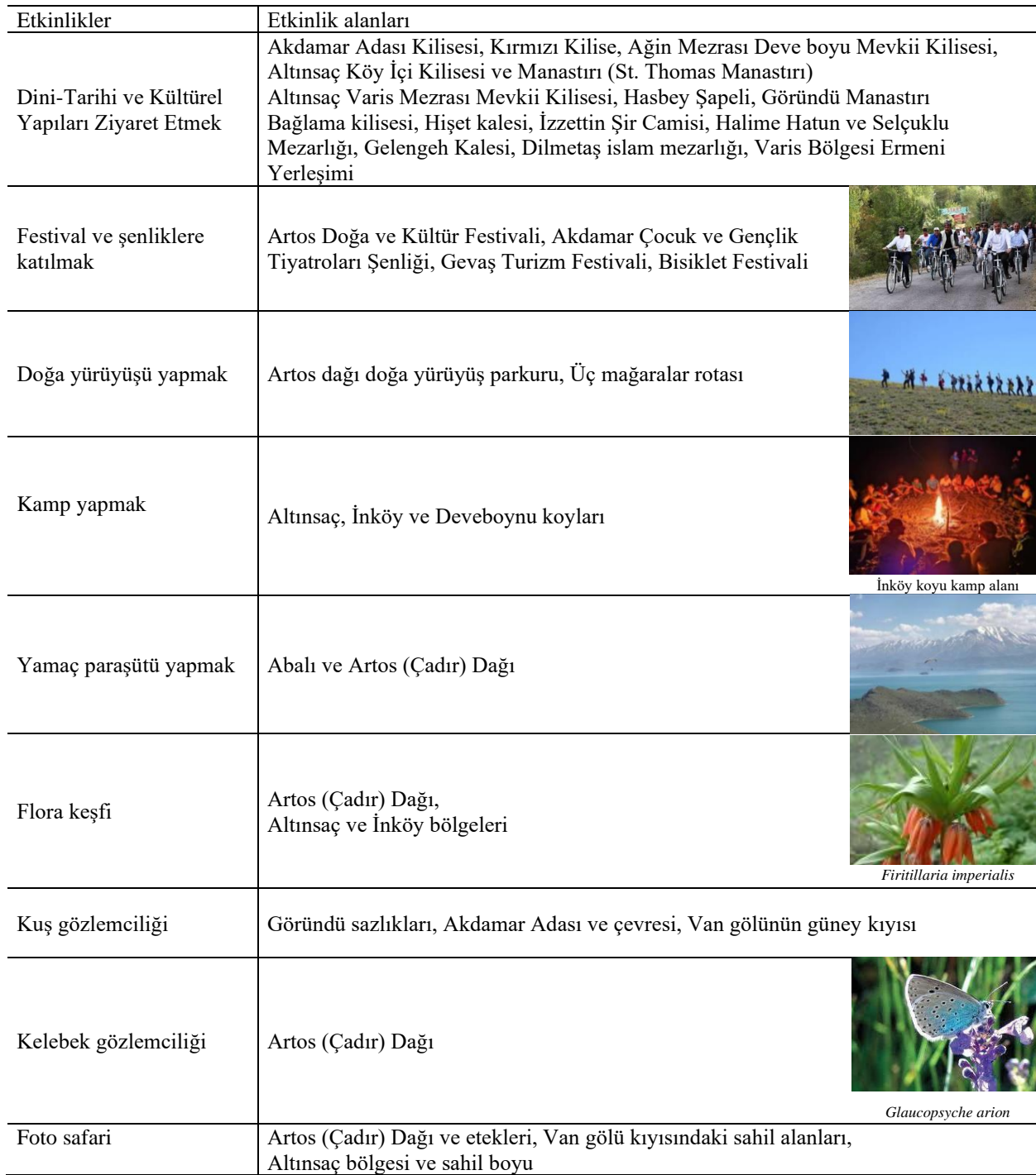
Tablo 2. Araştırma alanındaki potansiyel turizm etkinlikleri