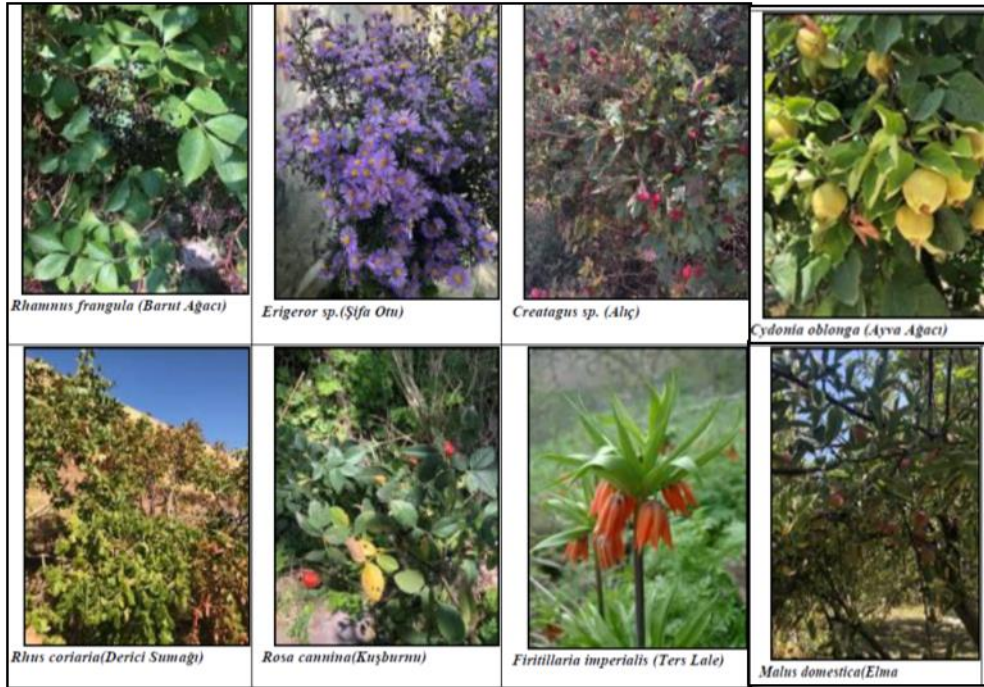
Şekil 2. Çalışma alanında peyzaj değeri olan bitki türlerinden görseller

Bir bölgede yer alan doğal bitki örtüsü bölgenin kalkındırılmasında ve turizm açısından çok önemli bir faktördür. Araştırma alanında doğal koşullar, bitki örtüsü açısından orman için elverişli olmasına rağmen Nemrut Kalderası içindeki huş ( Betula pendula ), titrek kavak ( Populus tremula ) gibi ağaçlar ile su boylarındaki kavak ve söğüt ağaçları, İnköyü ve Altınsaç köylerinde ardıç ( Juniperus oxycedrus subsp. oxycedrus ve Juniperus excelsa ) ve meşe ( Oercus robur subsp. pedunculiflora ve Quercus petraea subsp. pinnatiloba ) vb. türlerin yanı sıra Astragalus spp. , Centaurea spp. , Silene spp. ve Orchis spp. gibi otsu türlere de rastlanılmaktadır. Van'a özgü olan ve aynı zamanda endemik olan ters lale ( Firitillaria imperialis ) ve birinci dereceden sit alan olarak ilan edilen Akdamar Adasının üzerinde mevcut olan badem ağaçları ( Prunus dulcis ) bahar mevsiminde ada ve çevresinde görsel şölen oluşturmaktadır (Şekil 2) (Bingöl, 2004).