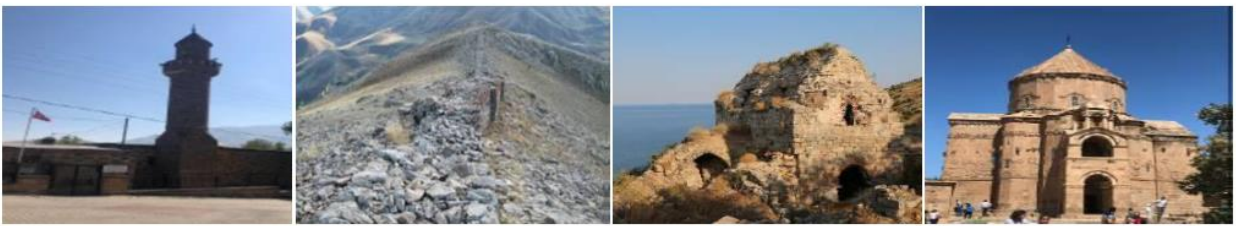
İzzetin Şir Camisi ve Gelengeh Kalesi