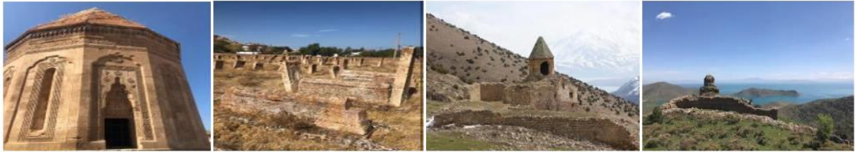
Halime Hatun Kümbeti ve Selçuklu Mezarlığı

Yöre ve yakın çevresinde Ortaçağ ve sonrası inşa edilen birçok tarihi ve mimari yapıların başında dini yapılar mevcuttur. Bölgenin tarihi geçmişi Eskiçağ dönemine kadar gitmektedir. Aynı zamanda farklı İslam ve Türk devletlerinin alanda oluşturmuş oldukları tarihi kalıntı ve miraslar, bölgede kültürel canlılığın üst düzeyde olduğunun bir göstergesidir. Hıristiyan Ermenilerin yaptığı dini eserler arasında ise mabet ve manastır kuruluşları hem mimari hem de süslemeler ile ön plandadır. İlçede Selçuklulardan kalma bölgenin ikinci büyük mezarlığı olan ve 400'den fazla mezarı içinde barındıran Selçuklu Mezarlığı vardır. Bu mezarlığın yanı sıra Urartular devrinde yapılmış ve sonradan Selçuklular zamanında kullanılmış olan Selçuklu taş ve oyma sanatı kendine has yapısını süsleme ve hat sanatının en güzel örneklerinden olan Halime Hatun Kümbeti ilçede bulunmaktadır (Şekil 3) (Baş & Gül, 2018).