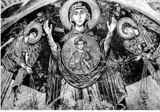
Levha 5- Blakhernitissa Meryem ve melekler, Pedulas Başmelek Mikhaïl Kilisesi, 15. yüzyıl (Stylianu-Stylianu 1985, 342, fig. 205).