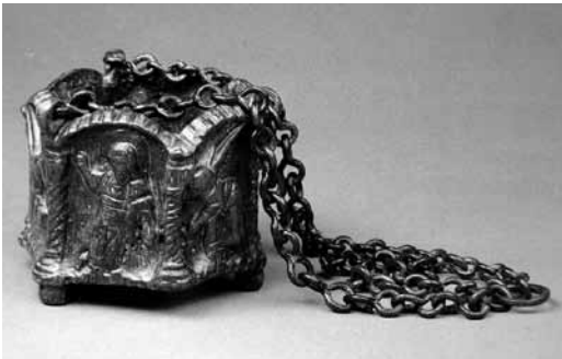
Levha 11- Altıgen Bronz Buhurdan, Mut, Dağpazarı Kilisesi buluntusu, Adana Müzesi, 5/6. yüzyıl.