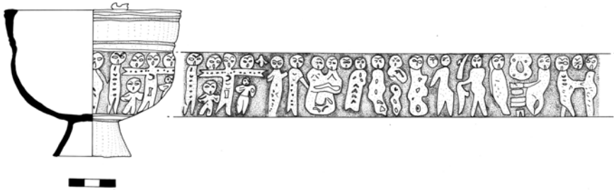
Levha 21- Mersin Müzesi 00.16.3 env.no.lu bronz buhurdanın çizimi.