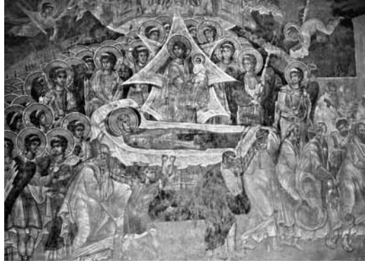
Levha 4- Koimesis sahnesi, Gračanica Manastır Kilisesi, 14. yüzyılın ilk yarısı (Çurčić 1979, 149, fig. 181).