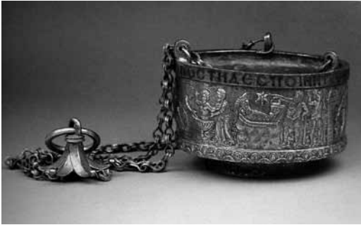
Levha 8- Altın Yıldızlı Gümüş Buhurdan, Kumluca/Sion defnesi, Antalya Müzesi, 6. yüzyıl.