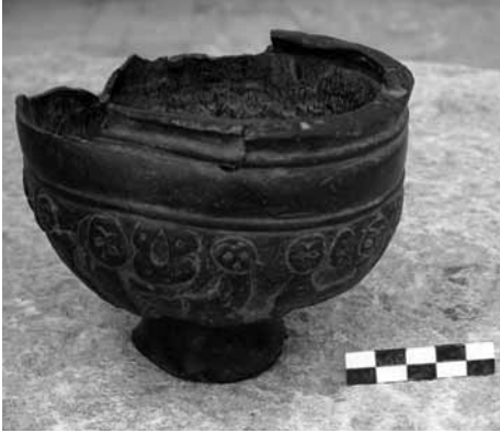
Levha 18- Mersin Müzesi 00.16.3 env.no.lu bronz buhurdanın görünümü.