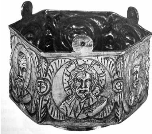
Levha 10- Gümüş Buhurdan, Kıbrıs Lambousa buluntusu, Londra, British Museum, 7. yüzyıl.