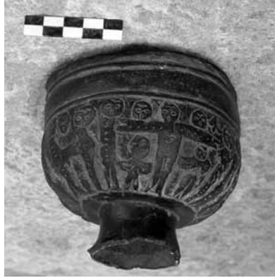
Levha 19- Çarşıta İsa sahnesi, Mersin Müzesi 00.16.3 env.no.lu bronz buhurdandan ayrıntı.