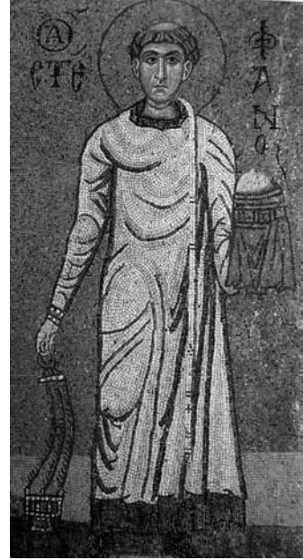
Levha 7- Diyakon Aziz Stephanos, Kiev, Mykhailus'ky Zolotoverkhyi Manastır Kilisesi, 12. yüzyıl ilk çeyreği (Evans- Wixom 1997, 290-2, fig 195B).