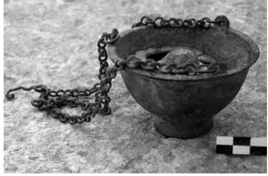
Levha 15- Mersin Müzesi 00.16.2 env.no.lu bronz buhurdan.