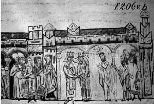
Levha 6- İmparator IV. Mikhaïl Doukas ve İmparatoriçe Zoe'nin düğün töreni, Ioannes Skylitzes el yazması, Madrid Bibliotheca Nacionale (Estopanan 1965, 394, no. 551, f206vb), 11. yüzyıl.