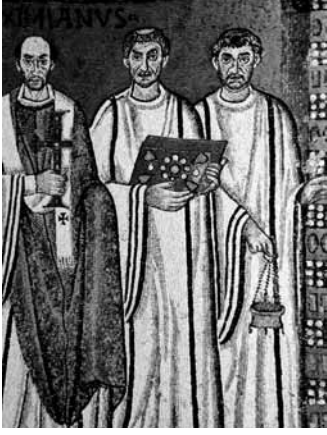
Levha 1- İmparator İustinianus ve maiyetini birlikte gösteren mozaik panodan ayrıntı, Ravenna San Vitale Kilisesi beması, 6. yüzyıl ortaları (Boyd 1998, 168, fig. 6.16).