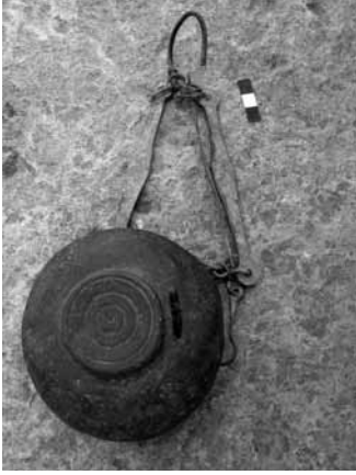
Levha 13- Mersin Müzesi 00.16.1 env.no.lu bronz buhurdanın kaide kısmı.