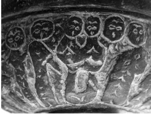
Levha 20- Meryem ve Elizabet'in buluşması, Mersin Müzesi 00.16.3 env.no.lu bronz buhurdandan ayrıntı.