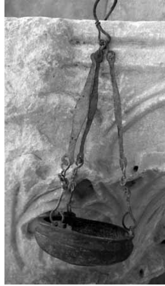
Levha 12- Mersin Müzesi 00.16.1 env.no.lu bronz buhurdan.