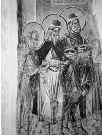
Levha 3- Kutsal altar önünde Harun ve oğulları, Pammakaristos Manastırı Kilisesi (Fethiye Camisi) Mezar Şapeli'nin güney dehlizi kuzey duvarı, 14. yüzyıl.