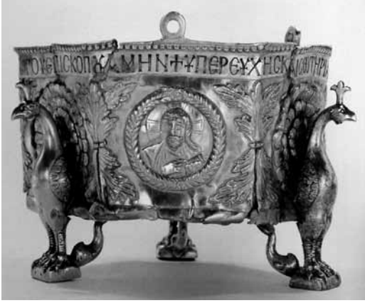
Levha 9- Gümüş Buhurdan, Kumluca/Sion definesi, Washington D.C., Dumbarton Oaks Koleksiyonu, 5-6. yüzyıl (Boyd 1998, 168, fig. 6.15).