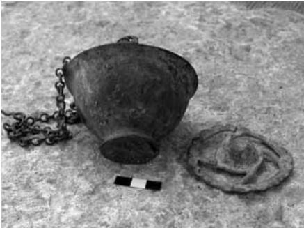
Levha 16- Mersin Müzesi 00.16.2 env. no.lu bronz buhurdanın yandan görünümü.