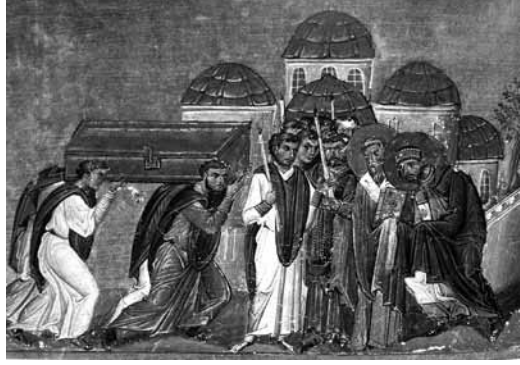
Levha 2- Patrik İoannes Khrystomos'un rölik sandığının Kutsal Havariler Kilisesi'ne taşınması sırasında tütsülenerek kutsanması, II. Basil Menologia'sındaki (Biblioteca Apostolica Vaticana, Gr. 1613) 10. yüzyıl.