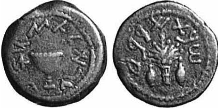
Lev. 7 Iudaea sikkesi (SNG Volum VI 1950, Fitzwilliam Musuem, şurada: http://www.s110120695.websitehome.co.uk/PHP/SNG_PHP/04_03_Reply.php?Series=SNGuk&AccessionNo=0602_1950 ).