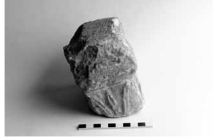
Lev. 5b Sunak üzerinde lulav bitkisi betimi.