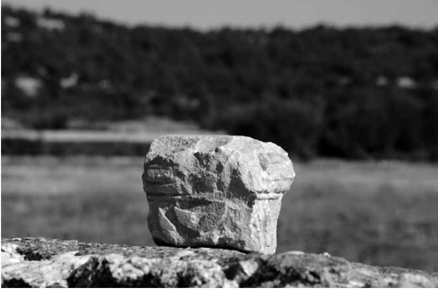
Lev. 8 Olba Kazılarında bulunan menorah kabartmalı sunak.