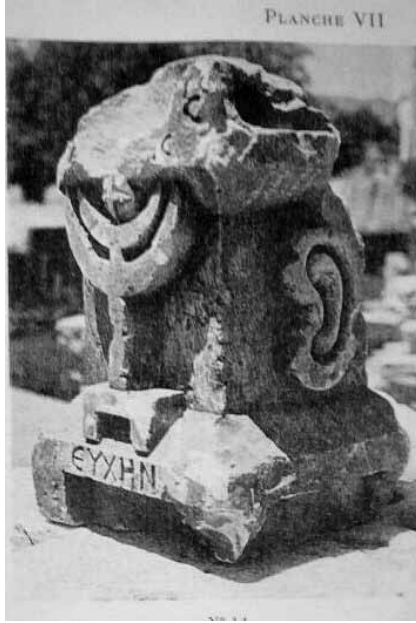
Lev. 4 Silifke Müzesi'nde bulunan menorahlı sunak (Dagron Fiessel 1987, Planche VII, No: 14).