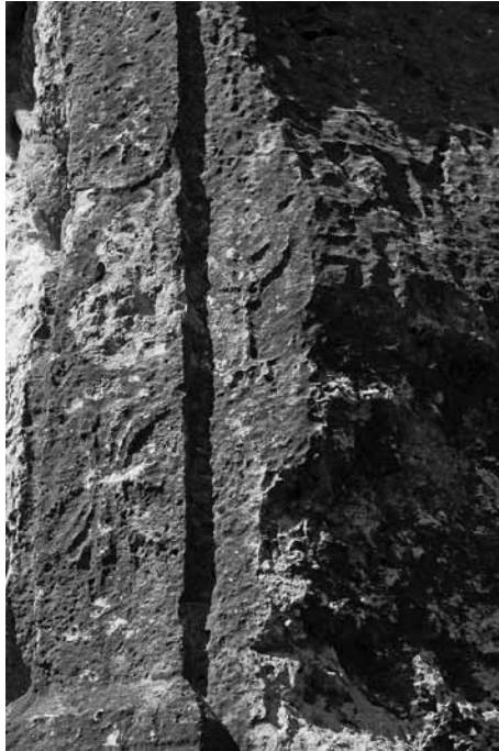
Lev. 2 Sömek Athena kabartmasının yanında bulunan menorah.