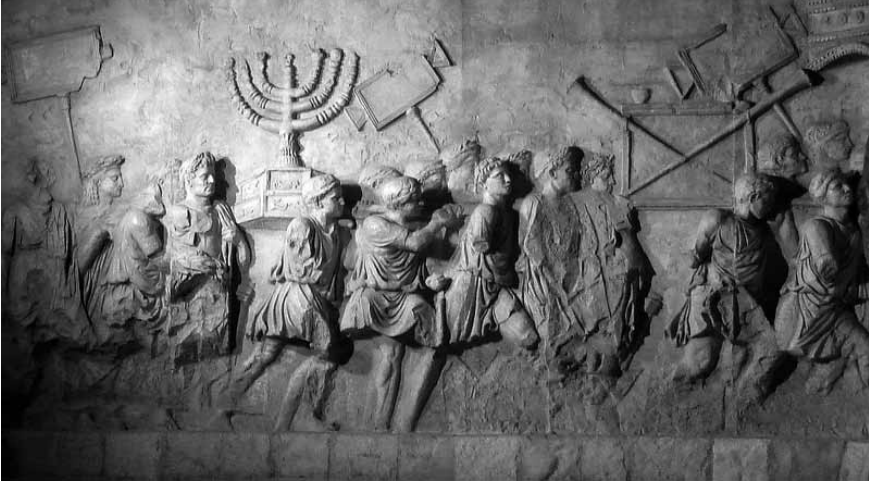
Lev. 1 Titus Zafer Takı'nda menorahı taşıyan Romalı askerler.