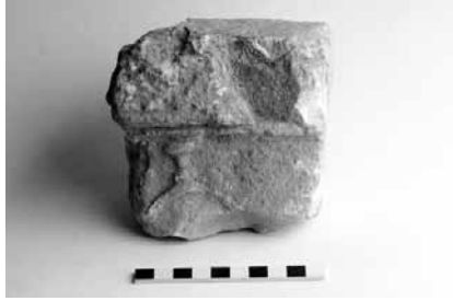
Lev. 5c Sunak üzerinde çevrilmiş kadeh betimi (Fot. Dr. Tuna Akçay).

MANASTIR M4-BATI KESİT DOĞU TOPRAK -169 CM 21.07.2015 TE-M4.01