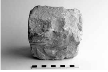
Lev. 5a Sunak üzerinde menorah betimi.