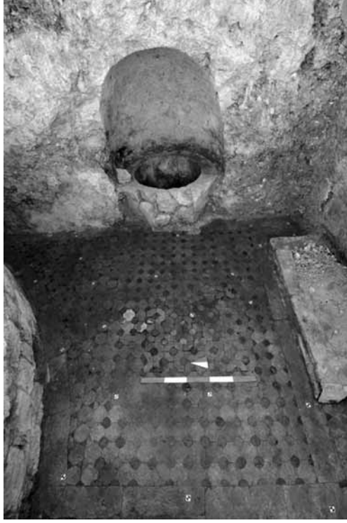
Levha 6. Diakonikon opus sectile taban döşeme.