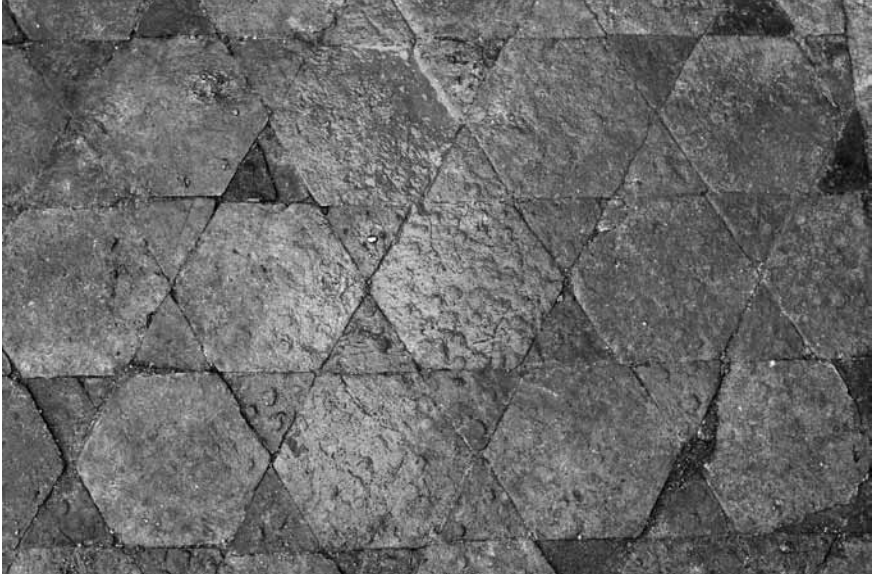
Levha 7. Diakonikon opus sectile süsleme detay.