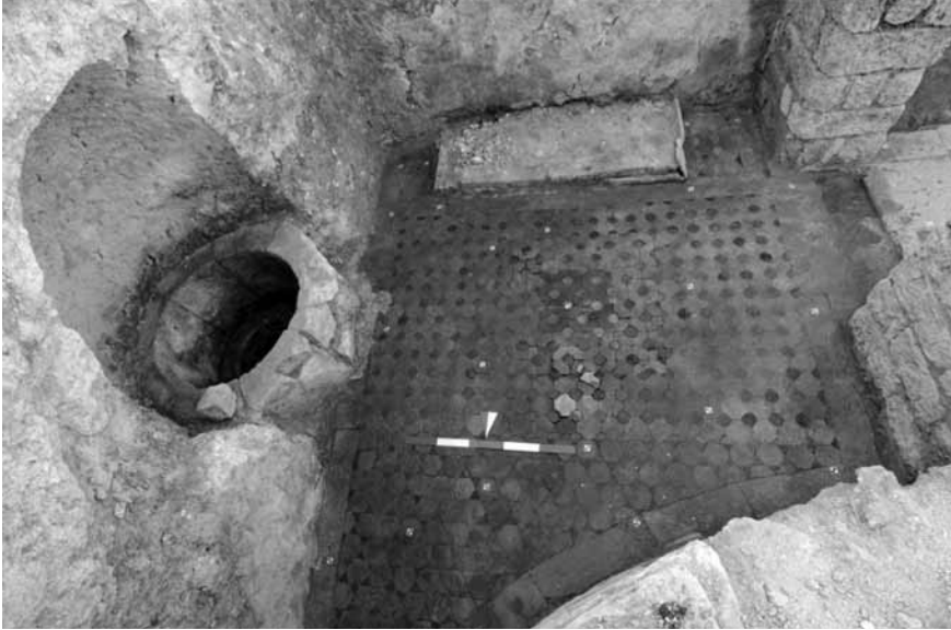
Levha 4a. Diakonikon.