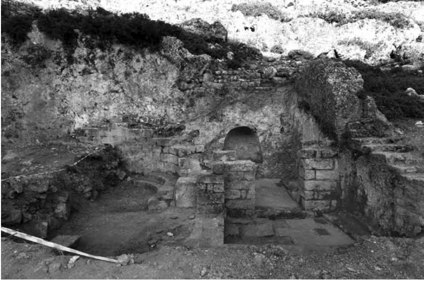
Levha 3. Kuzey Kilisesi.