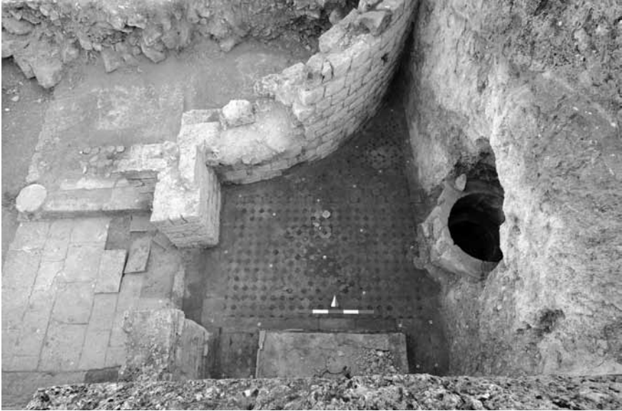
Levha 4. Diakonikon .