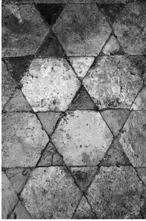
Levha 8. Diakonikon opus sectile süsleme detay.