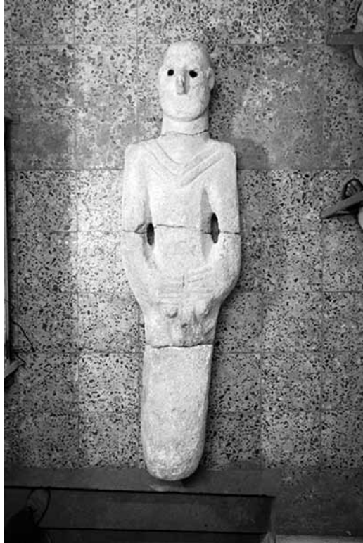
Levha 2. Urfa-Yeni Mahalle Heykeli.