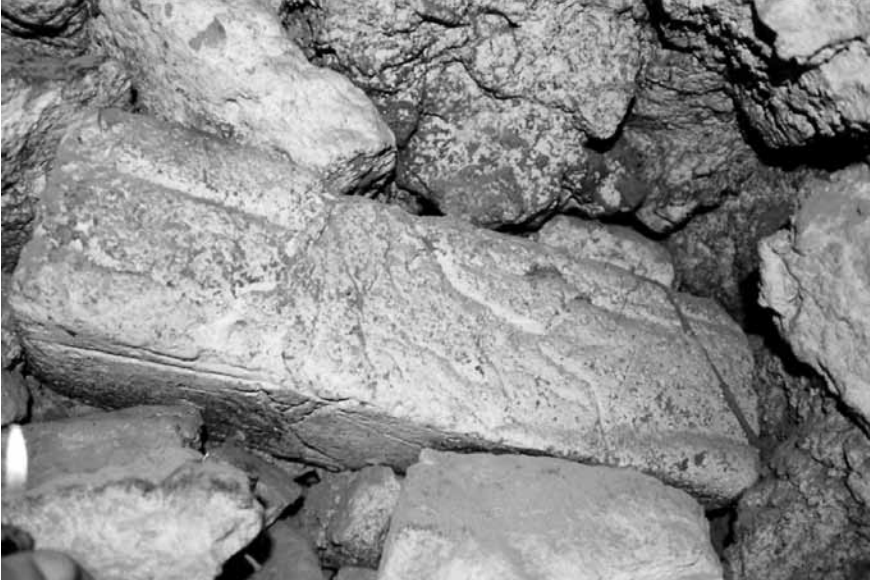
Levha 3. Urfa-Yeni Mahalle Semtinden Bir Dikmetaş Parçası.