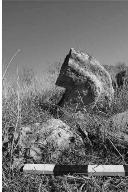
Levha 13. Ayanlar Höyük'ten Oyuk Bir Kaide Parçası Örneği.