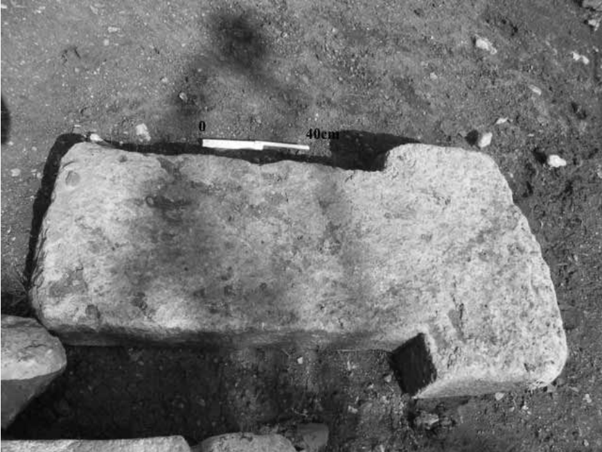
Levha 8. Sefer Tepe'den T Şeklinde bir Dikmetaş.