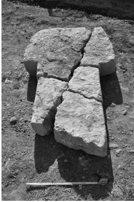
Levha 9. Taşlı Tepe'den bir Dikmetaş Örneđi. (Foto B. elik)