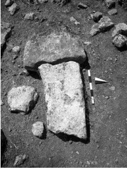
Levha 11. Harbetsuvan Tepesi'nden bir Dikmetaş Örneği.