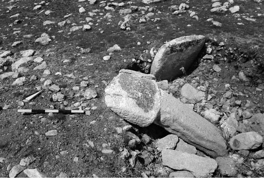
Levha 5. Karahan Tepe'den Yılan Kabartmalı Dikmetaş. (Foto B. elik)