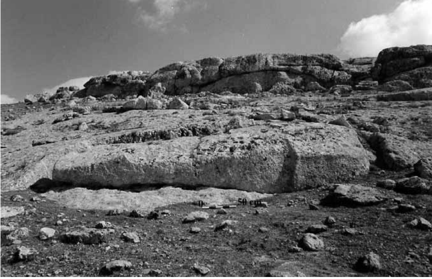
Levha 7. Karahan Tepe'den Dikmetaşın Çıkarıldığı Taş bir Ocağı.