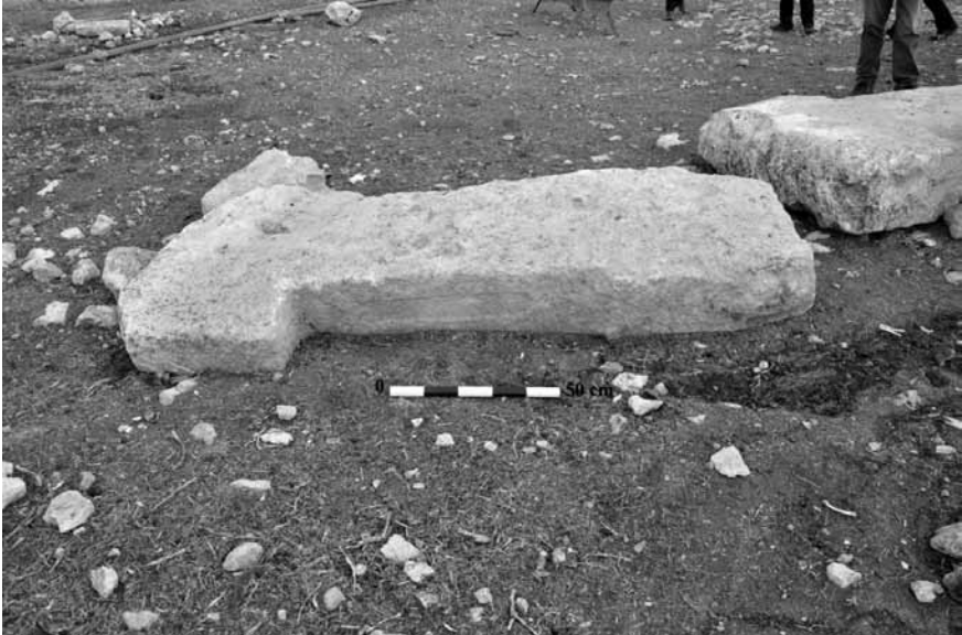
Levha 10. Kurt Tepesi'nden Motifli bir Dikmetaş Örneđi. (Foto B. elik)