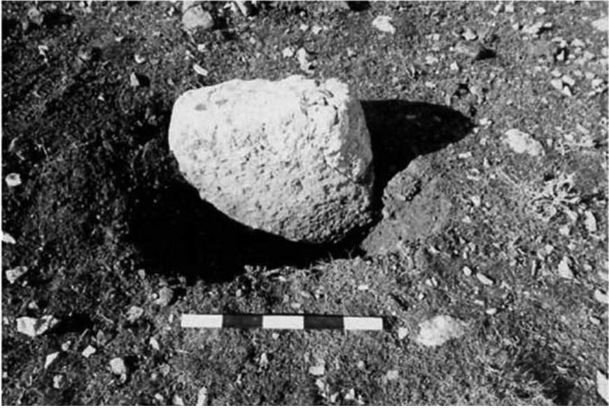
Levha 4. Hamzan Tepe'den in-situ Durumda bir Dikmetaş.