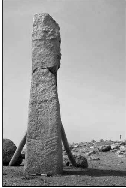
Levha 12. Harbetsuvan Tepesi'nden Kabarmalı bir Dikmetaş Örneği.