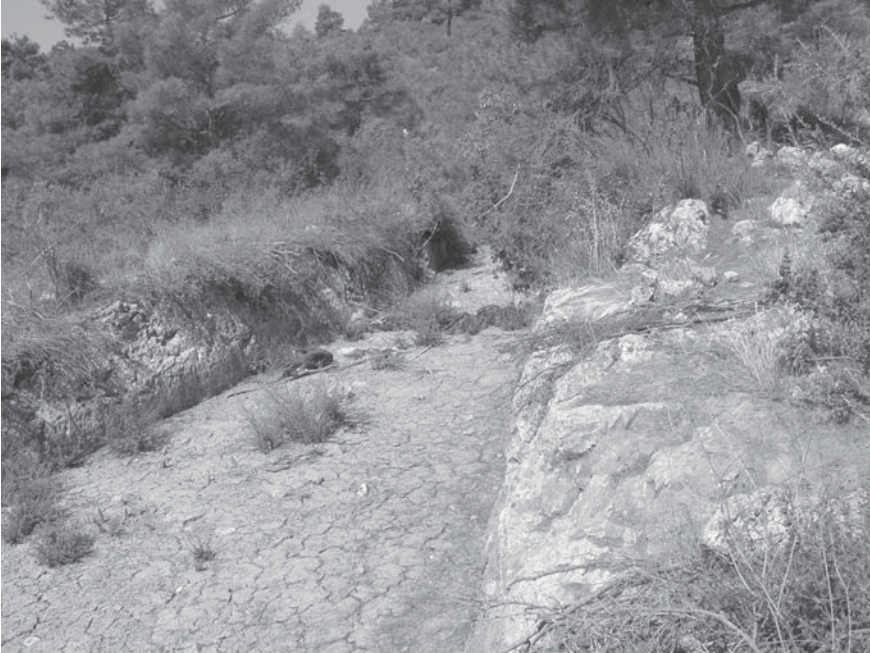
Levha 4: Antik yol kalıntısından görünüş.