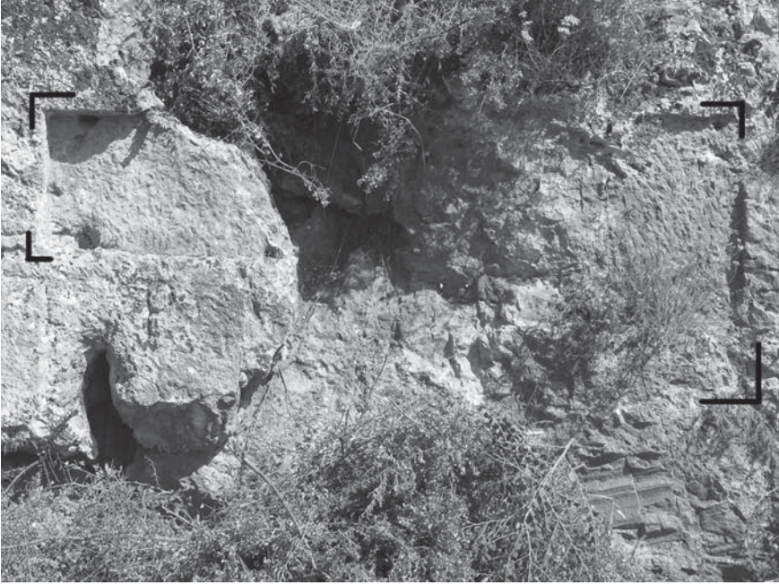
Levha 7: Antik yolun kuzey duvarında yer alan yazıt yuvaları.