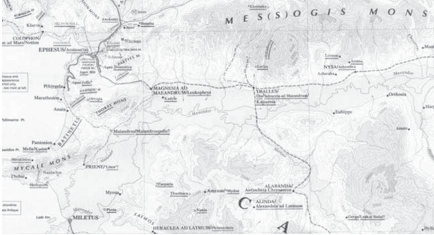
Levha 1: Roma Dönemi'nde bölgenin yol ağı (Taibert, Richard. J. A. 2000. Barrington Atlas of the Greek and Roman World. Princeton and Oxford Princeton University Press).