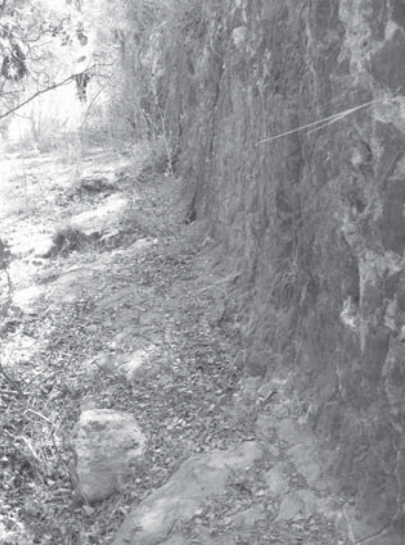
Levha 6a: Antik yolun zemininden görünüş.