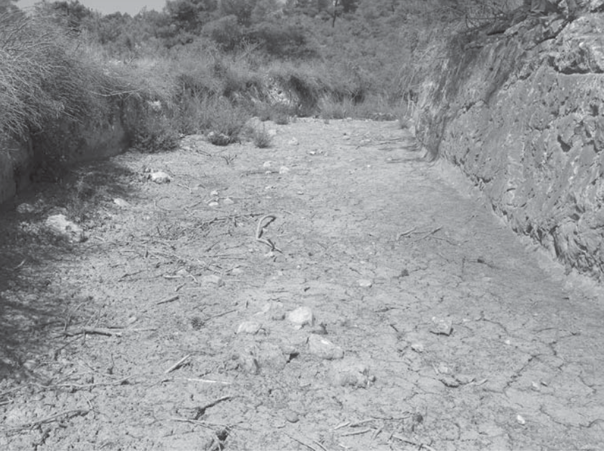
Levha 5: Antik yol kalıntısından görünüş (Fotoğraf: İbrahim Ethem KOÇAK).