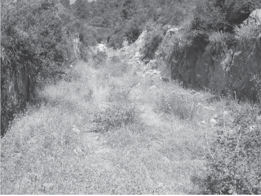
Levha 3: Antik yol kalıntısından görünüş.