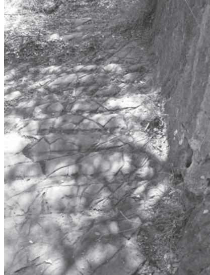
Levha 6b: Antik yol zemininde yer alan kasistlerin görünüşü.