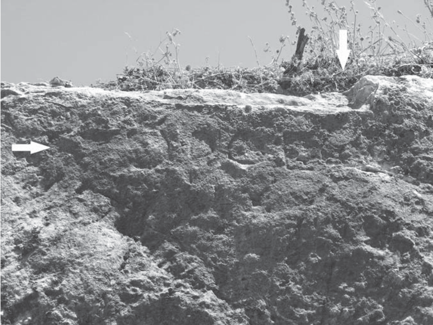
Levha 8: Naipli Köyü'nde tespit edilen sınır yazıtı.