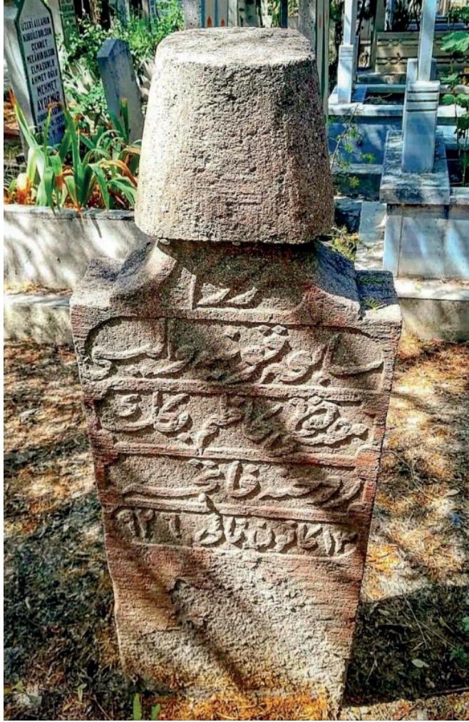
Ek 3: Mustafa Kâzım Bey'in Tekke Mezarlığı'ndaki Kabir Taşı (Fotoğraf: Hasan opur).