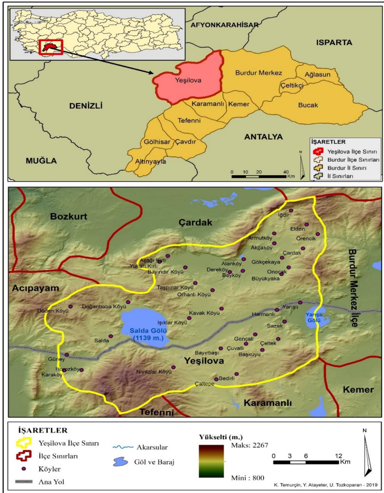
Şekil 1: Çalışma Sahasının Lokasyonu ve Topoğrafik Görünümü

sonucunda farklı çekici özelliklere sahip yerler ve turizm faaliyetleri daha çok tercih edilmeye başlanmıştır (Emekli, 2005; Kervankıran & Özdemir, 2013). Dünya Turizm Örgütü WTO'nun 2011 yılında yayınladığı raporda da bu değişimin göstergeleri yer almıştır. Bu raporda, günümüzde turist tercihlerinin sadece deniz, kum, güneş turizmine bağlı olmaktan ziyade farklı turizm aktivitelerinin ön plana çıktığı kırsal turizm alanlarına doğru bir yönelim olduğuna dikkat çekilmiştir (Orhan & Karahan, 2010). Bu değişim sonucunda turistlerin tercihleri, eşsiz bir doğal görünüme, doğallığı bozulmamış doğal kaynaklara, flora ve fauna açısından zengin bir yapıyı barındıran sahalara da kaymış, bu