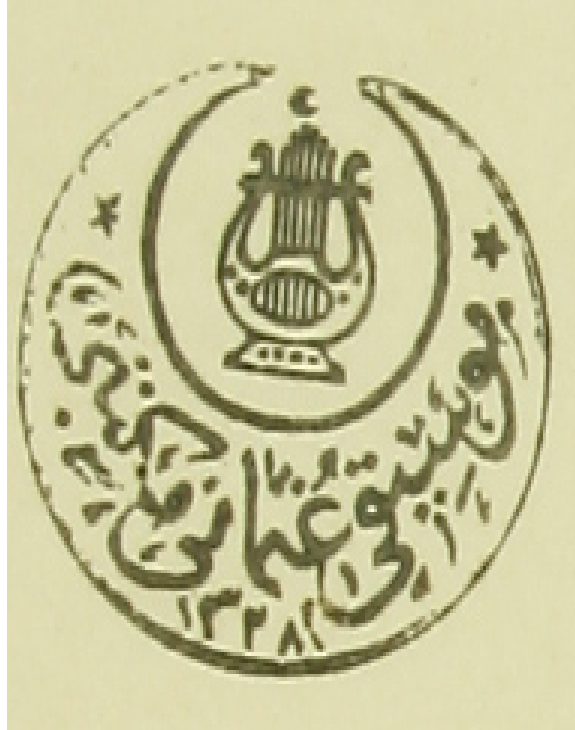
EK-IV: 24 Nisan 1910 tarihinde Mûsikî-i Osmanî Mektebi amblemi ve mühürü.