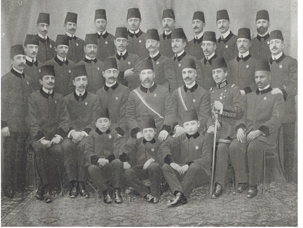
EK-I: 14 Temmuz 1909 tarihinde Mûsikî-i Osmanî Cemiyeti.