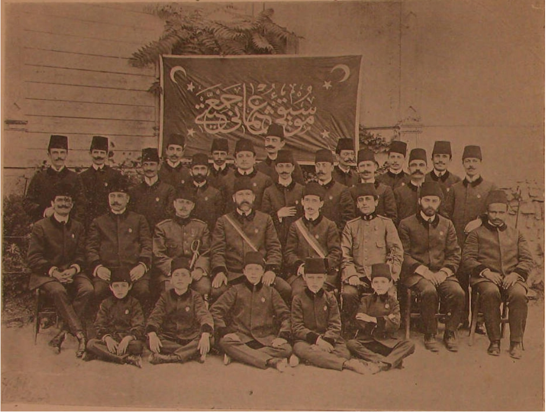
Ek 1: Musavver Hale Dergisi. (1325/1909). Sayı: 1. s. 9. "Mûsikî-i Osmanî Cemiyeti."