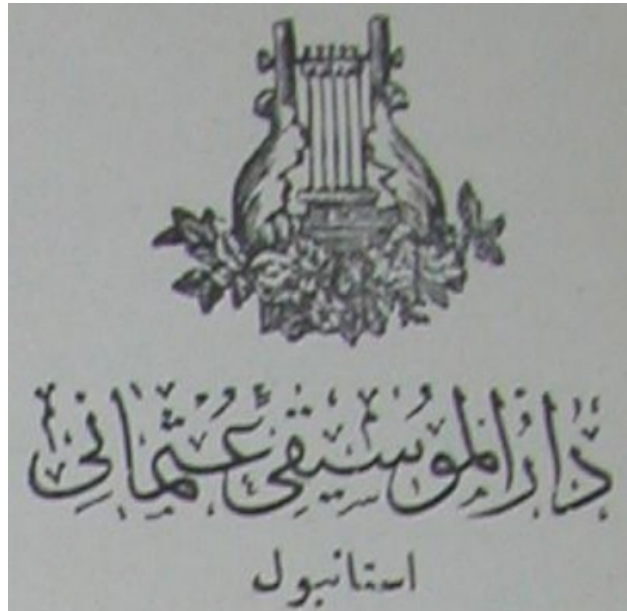
Ek 4: 1912 tarihinde "Dârülmûsikî-i Osmanî-İstanbul" amblemi.