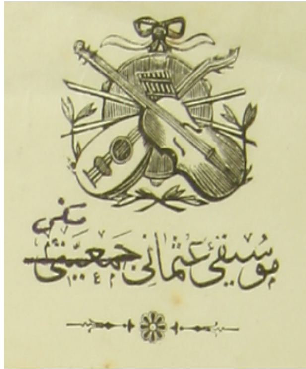
Ek 2: 24 Nisan 1910 tarihinde "Mûsikî-i Osmanî Mektebi" amblemi.