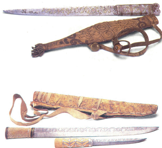
Рис. 5. Ножи нивхов и коряков.

А – Нож и ножны. МАЭ: колл. 36-162 а, б (нивхи). Б – Нож и ножны. АМNH – American Museum of Natural History 70/3441 (коряки).