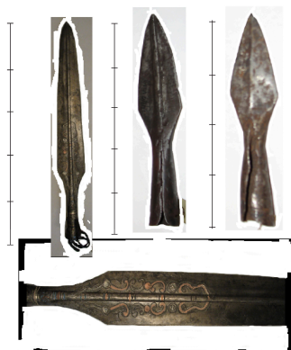
Рис. 1. Наконечники копий.

нивхов шло в русле сложившейся традиции народов Сибири и Дальнего Востока России.