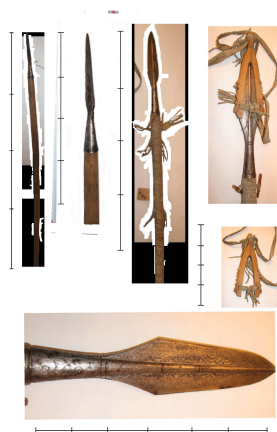
Рис. 2. Копья.

А – МАЭ: колл.36571. Б – МАЭ: колл. 44424-40. В – МАЭ: колл. 5530-198.