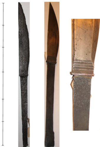
Рис. 3. Пальма. А – МАЭ: колл. 5334-17. Б – МАЭ: колл. 344-48а (нанайцы).