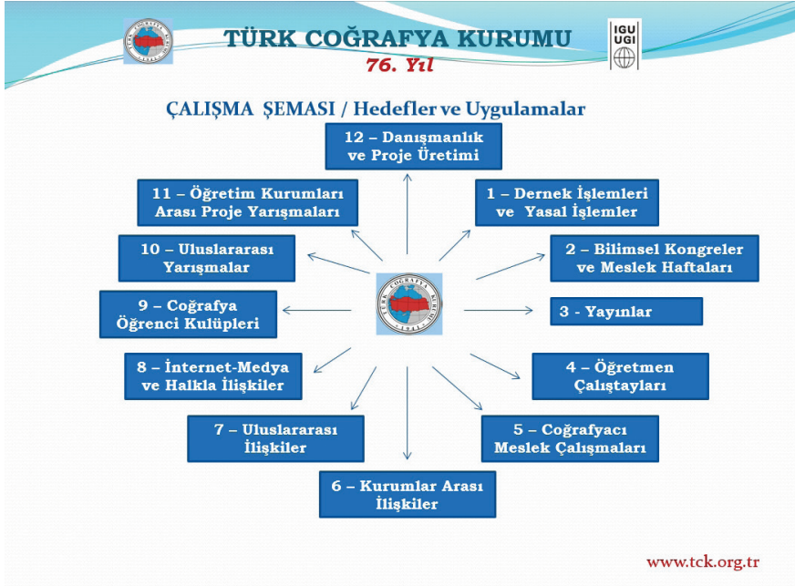
Şekil 1: Türk Coğrafya Kurumu Çalışma Şeması 7