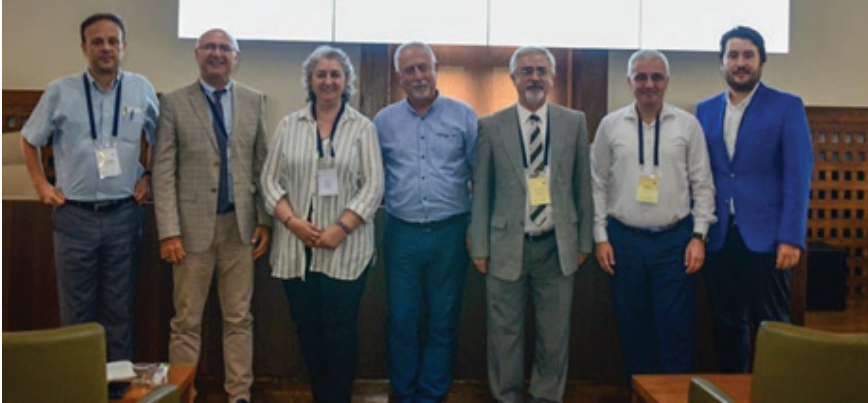
Foto 2: 2019–2021 Dönemi - Türk Coğrafya Kurumu Yönetim Kurulu Üyeleri