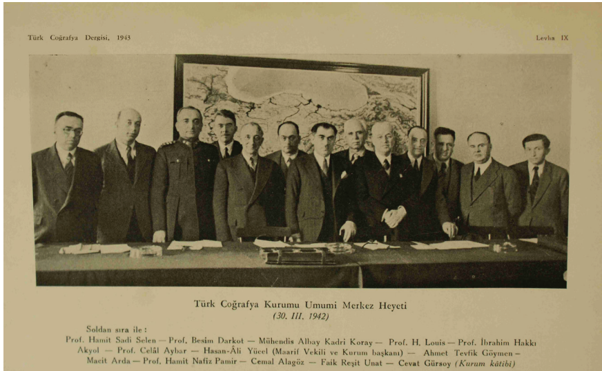
Foto 1: Türk Coğrafya Kurumu ilk Yönetim Kurulu Üyeleri (30 Mart 1942, Ankara)

Hasan Ali Yücel'in ilk kurum başkanlığı döneminde yapılan I. Coğrafya Kongresi'nin sonuçlarının, Milli Eğitim Bakanlığı tarafından 1941'de ilk yayınlanan raporudur. Yayının ismi: Birinci Coğrafya Kongresi (6-21 Haziran 1941)- Raporlar, Müzakereler, Kararlar. T.C. Maarif Vekilliği , Ankara, 1941. Bu raporun önemi, kongrede alınan 3 önemli karardan birisinin, Türk Coğrafya Kurumu isminde bir derneğin kurulmasıdır (Foto 1).