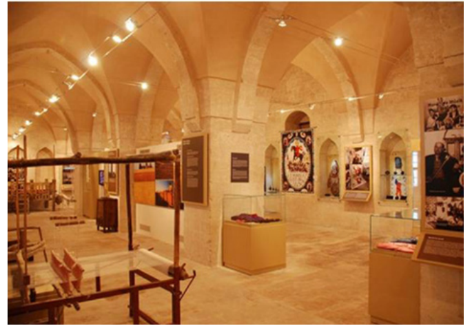
Figür 8. Mardin Kent Müzesi ( http://www.sakipsabancimardinkentmuzesi.org/ )