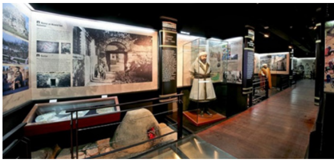
Figür 7. Bursa Kent Müzesi

2000’li yıllardan günümüze kadar İstanbul dışında Türkiye’nin birçok kentinde kent müzeleri açıldı. Bunlardan bazıları Bursa Kent Müzesi, Çanakkale Kent Müzesi, İzmir Ahmet Pıřtina Kent Arşivi, Sabancı Vakfı desteęiyle açılan Mardin Kent Müzesi’dir. (Gümüş, 2008, s. 38-43; İhtiyar, 2011, s. 56-62; Özden, 2008, s. 73-76; Silier, 2010, s. 1-7; Tekeli, 2009, s. 38-43) Bu kent müzelerinden özellikle Bursa ve Mardin Kent Müzelerinin alanında çok iyi ve aktif oldukları düşünülmektedir. (Calabi, 2009, s. 51-73; Dedeşayır, 2013, s. 18-23; İhtiyar, 2011, s. 29-43; Silier, 2010, s. 16-21; Tekeli, 2008, s. 1-13; Yücel, 2006, s. 1-15)