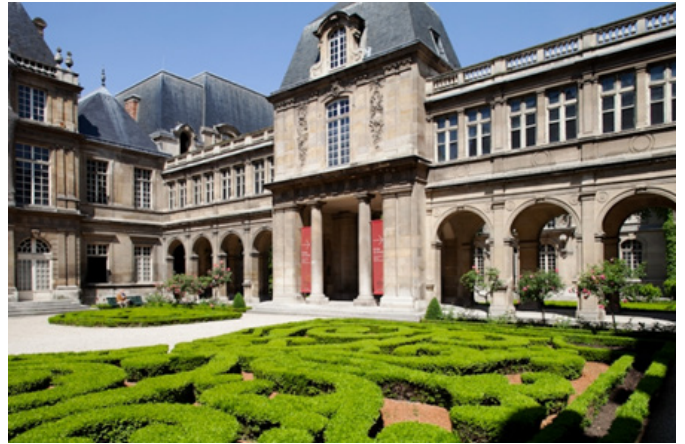
Figür 2. Carnavalet Müzesi (Fransa/Paris) ( http://www.carnavalet.paris.fr/en/museum-carnavalet/hotel-carnavalet )

Amerika'nın ardından Avrupa'da da kent müzeleri açılmaya başlandı. Önceleri Avrupa'da ulusal kimliğin öne çıktığı ulusal müzeler varken; artık kent vurgusu taşıyan, çoklu kültürü barındıran kent müzeleri açılmaya başlandı. Bu bağlamda Avrupa'da özellikle Fransa ve İngiltere çok aktif rol oynadılar. 1880'de Fransa Paris'te, ilk kent müzesi olan, Carnavalet Müzesi açılırken; 1891'de de İngiltere Londra'da ise Londra Kent Müzesi açıldı. (Binbir, 2017, s. 1-8; Dedehayır, 2013, s. 3; Keskin, 2014, s. 25-39).