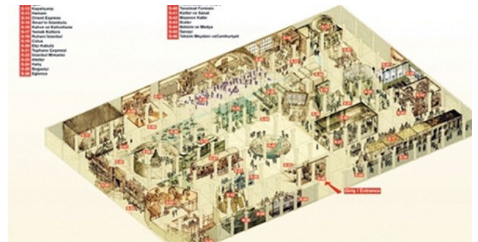
Figür 5. İstanbul Kent Müzesi Projesi

Bu ilk kent müzesinin ardından birçok proje ve çalışmalar geliştirilmiş olup özellikle 2000'li yıllarda bu konu hız kazanmıştır. Tarih Vakfı çeşitli konferanslar düzenleyerek müze ve kentli ilişkisini, kent müzelerinin önemini ve Dünya'da bu konuda yapılan çalışmaları, müzelerin eğitimdeki rolünü gündeme getirmiş olup bu konudaki bilinci artırmaya başladı. Yine Tarih Vakfı'nın desteğiyle Topkapı Sarayı içinde İstanbul Müzesi Projesi düşünüldü. Ardından ÇEKÜL Vakfı (Çevre ve Kültür Değerlerini Koruma ve Tanıtma Vakfı) bu konuda kitaplar, broşürler yaparak kent müzeciliğini tanıtmaya başladı. İstanbul Büyükşehir Belediyesi'nin desteğiyle kapsamlı bir proje olan İstanbul Kent Müzesi projesine başlandı. (Gümüş, 2008, s. 38-43; İhtiyar, 2011, s. 56-62; Özden, 2008, s. 73-76; Silier, 2010, s. 1-7; Tekeli, 2009, s. 38-43)