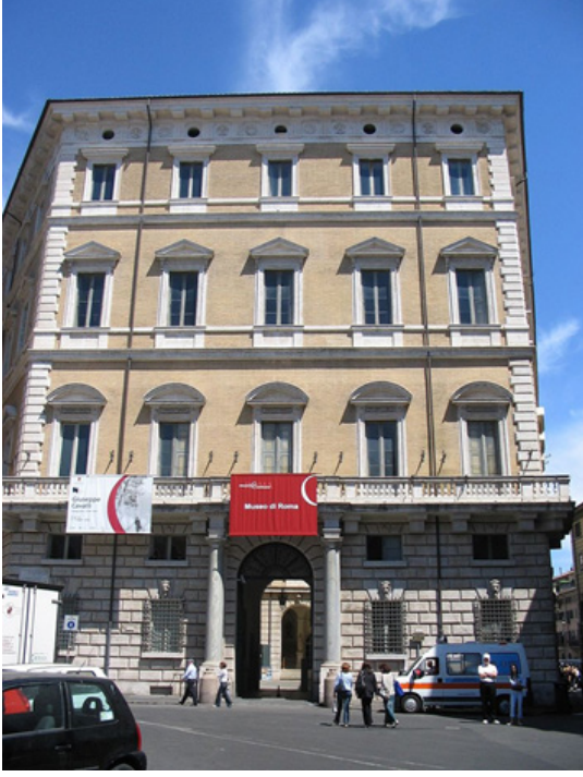
Figür 9. Roma Müzesi (Braschi Sarayı) ( http://www.museodiroma.it/ )

Kataloglamalar, koleksiyon düzenlemeleri, eğitim alanları oluşturuldu. Müzenin bir diğer kolu da S.Egidio Meydanı'ndaki Trastevere Roma Müzesi (Museo di Roma in Trastevere) adı altında 1977'de açıldı. Bu müze de restorasyon nedeniyle bir süre kapandıktan sonra 2000 yılında yenilenmiş haliyle yeniden halka açıldı. (Arthurs, 2009, s. 189-200; Ilie, 2009, s. 201-224; Manacorda, 2009, s. 225-236)