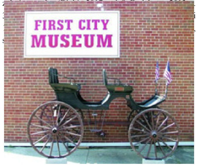
Figür 1. Amerika Leavenworth'taki İlk Kent Müzesi ( firstcitymuseums.org/first-city-museum )

19. yüzyıla kadar ulusal kimliği ön plana çıkaran, sanat eserlerini bir araya toplayıp sergileme amacı taşıyan ulusal / milli müzeler vardı. 19. yüzyılda kent kimliği kavramının ortaya çıkması müzecilikle ilgili bazı anlayışları ve ilkeleri de değiştirdi. Artık kentin kültürünü, tarihini bilme ve insanı merkeze koyup yaşadığı kentle iletişimini güçlendirme, eğitici olma amaçları da müzeciliğin kapsamına girmeye başladı. Küreselleşme birden çok kimliği de beraberinde getirince müzeler de yavaş yavaş kendini yenileme yoluna girdi. Böylece 19. yüzyılda kent müzeleri doğdu. (Calabi, 2009, s. 225-236; Danacıoğlu, 2010, s. 38-53; Hebditch, 2008, s. 39-48; İhtiyar, 2011, s. 29-38) 2013 yılında Çekül Vakfı'nın kent tarihi müzeleri adlı kitabında yer alanlara ve Keskin'in 2014 yılındaki makalesinde, Binbir'in 2017 yılındaki çalışmasında ifade ettiğine göre; insanı temel alan ve kentlilerin yaşadıkları kentin kültürel özellikleriyle tanıştıran ve bu bilinci yaratan kent müzeleri düşüncesi ilk olarak 19. yüzyılda Amerika'da ortaya çıkmıştır. Bilindiği gibi çok uluslu kozmopolit bir ülke olan Amerika'da göçmenler ortak bir kültür ve kent kimliği yaratma amacıyla yerel düzeyde kent mü-