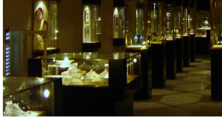
Figür 11. İstanbul Şehir Müzesi (Yıldız Sarayı) ( http://en.besiktas.bel.tr/entry/city-museum/ )

Karşılaştırmamız kapsamında İstanbul'u ele alacak olursak ise; Türkiye'de kent müzeciliği ile ilgili çalışmalar 1980 yılında başlamış olup İstanbul'daki ilk kent müzesi ise 1990 yılında açılmıştır. Yıldız Sarayı bahçesinde açılan İstanbul Şehir Müzesi, İstanbul'daki ilk kent müzesidir. Aslında bu müzenin kuruluş tarihi 1939 yılına kadar gitmektedir. Beyazıt'taki Belediye Kütüphanesi'nde açılmış olan bu küçük müze daha sonra 1945 yılında Saraçhane'de bulunan Gazanfer Ağa Medresesi'nde Belediye Müzesi adıyla çalışmıştır. Fakat bu dönemlerde kent müzesi adıyla anılmamaktadır. Son olarak 1990 yılında Yıldız Sarayı bahçesinde İstanbul Şehir Müzesi adıyla açılmıştır. (Artan, 2015, s. 1-5; Binbir, 2017, s. 1-8; Silier, 2010, s. 16-21; Şenel, 2014, s. 171-188; Tekeli, 2008, s. 21-23; Yücel, 2006, s. 1-10)