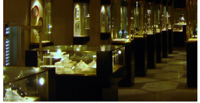
Figür 4. İstanbul Şehir Müzesi (Yıldız Sarayı)

müzesi Avrupa'daki diğer kent müzeleriyle kıyaslandığında oldukça küçük ve yetersiz olsa da, Türkiye'de ilk açılan kent müzesi olma bağlamında önemlidir. (Gümüş, 2008, s. 38-43; İhtiyar, 2011, s. 56-62; Özden, 2008, s. 73-76; Silier, 2010, s. 1-7; Tekeli, 2009, s. 38-43)