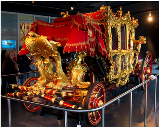
Figür 3. Londra Kent Müzesi

( https://www.museumoflondon.org.uk/museum-london )