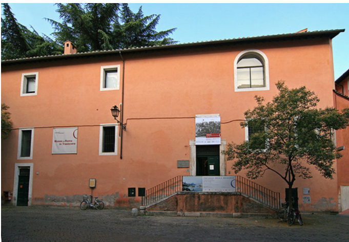
Figür 10. Trastevere Roma Müzesi ( http://www.museodiromaintrastevere.it/ )

Kataloglamalar, koleksiyon düzenlemeleri, eğitim alanları oluşturuldu. Müzenin bir diğer kolu da S.Egidio Meydanı'ndaki Trastevere Roma Müzesi (Museo di Roma in Trastevere) adı altında 1977'de açıldı. Bu müze de restorasyon nedeniyle bir süre kapandıktan sonra 2000 yılında yenilenmiş haliyle yeniden halka açıldı. (Arthurs, 2009, s. 189-200; Ilie, 2009, s. 201-224; Manacorda, 2009, s. 225-236)