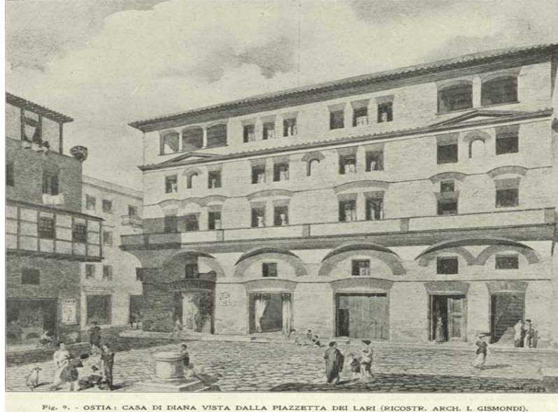
Şekil 3: Dikdörtgen Planlı Konutları (Insulae) Temsil Eden Bir Resim

Konutların boyutlarındaki büyüme, konut tiplerindeki gelişmelerle doğrudan ilişkilidir. Tek odalı konutlardan çok odalı konutlara geçişle birlikte sadece tek bir konut büyümekle kalmamış, tüm yerleşim alanı da bununla paralel olarak büyümüştür. MÖ. VII. yüzyılda yaygın olarak görülen dikdörtgen konut planı (insulae), mekânın daha ekonomik bir şekilde kullanılmasına ve daha yoğun organize edilmiş bir yerleşim sisteminin oluşmasına ön ayak olmuştur (Şekil 3) (Soy, 2015).