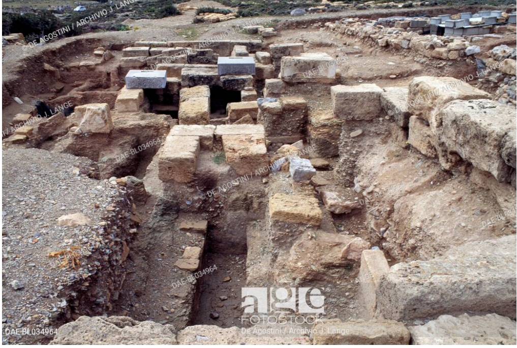
Fotoğraf 3: MÖ. IV. Yüzyılda Oluşturulmuş Bir Antik Yunan Nekropolisi (Girit Adası-Itanos)

Antik Yunan kentlerinin korunabilmesi için polisler kerpiç ya da taştan yapılmış surlarla çevrilmekteydi. Bu surların planlanması sadece stratejik amaçlarla ve kentlerin bulunduğu arazinin elverdiği olanaklar çerçevesinde yapılmıştır. Surlar çoğunlukla kentsel planı etkileyici özellikte değillerdi. Surların sınırladığı kentsel alan dışında ve özellikle kentlerin giriş kapılarının etrafındaki yollarda mezarlıklar göze çarpmaktaydı. Sözü edilen mezarlıklara “ölüler kenti” anlamını taşıyan nekropolis denmekteydi (Fotoğraf 3) (Akarca, 1998).