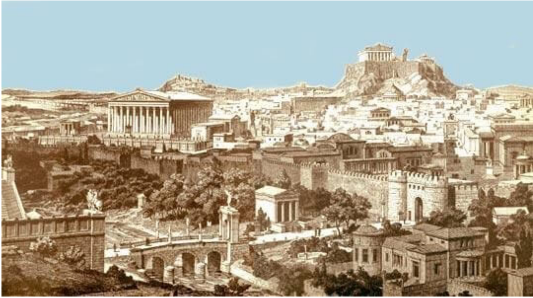
Şekil 1: Polisin Antik Dönemdeki Görünümünü Temsil Eden Bir Resim