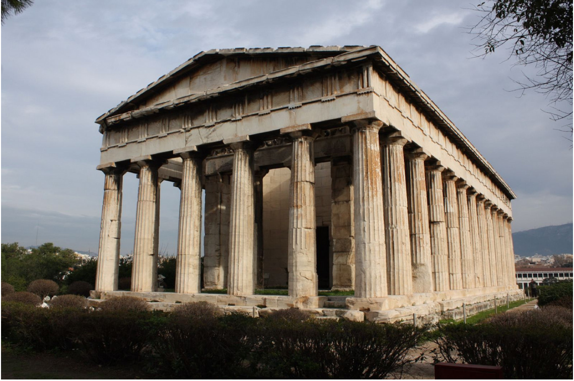
Fotoğraf 1: Antik Yunan Kentindeki Önemli Alanlardan Biri Olan Agora