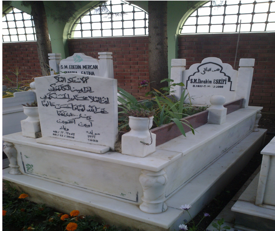
Adıyaman Menzil Markad'daki Kabri