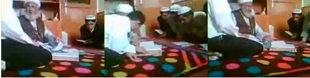
(Son Dönemlerinde Faraiz Dersi Verirken)