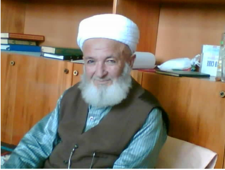
(Son Dönemlerinde Odasında Çekilmiş Bir Fotoğraf)

davranışlarında talebenin üzerinde olumlu etki bırakabiliyordu. Bu da öğrencinin ilim adamı olma yolunda bir kimlik edinmesinde etkide bulunup hocasının denetiminde yetişmesini kolaylaştırıyordu.