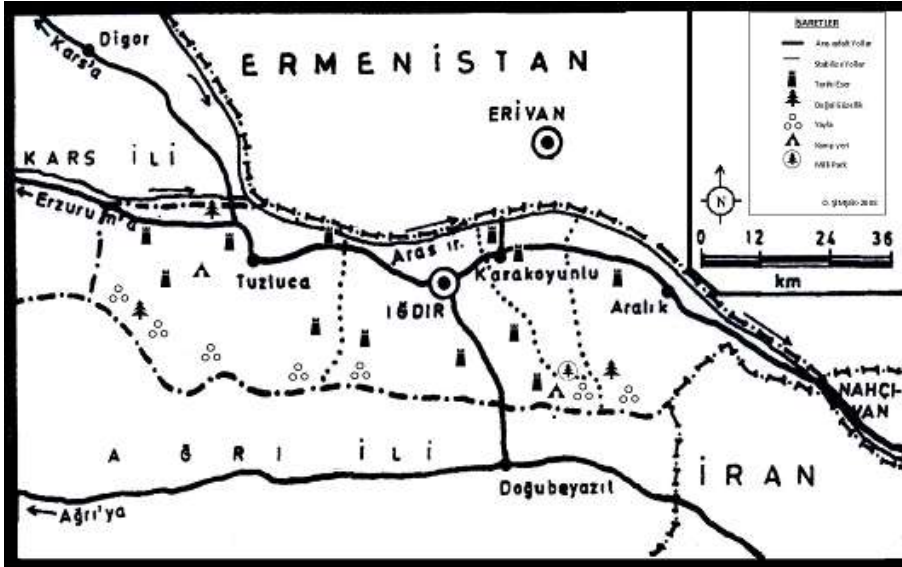
Şekil 2. Iğdır İlinin Turizm Değerleri Haritası (2008).