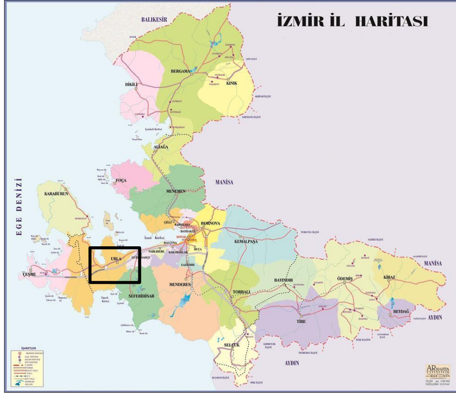
Harita 1.1. Araştırma Sahasının Yer Buldu Haritası