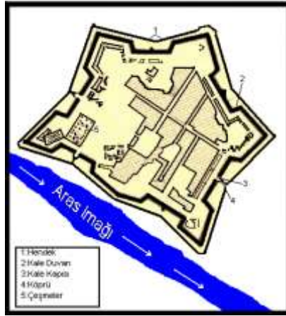
Şekil 1. Abbas Abad Kalesi (Zəhmət ŞAHVERDİYEV, NAXÇIVAN BÖLGƏSİ XIX-XX əsrin əvvəllərində, Sayfa 125'den Sadeleştirilmiş)