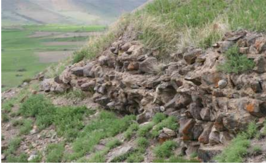
Resim 8.Başkale Kalesi/Narman