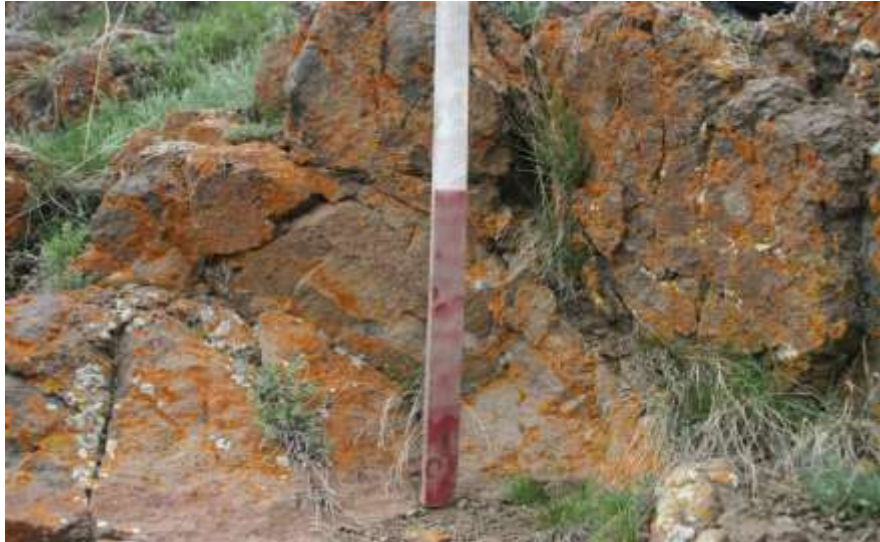
Resim 10.Boğakale Kalesi/Narman