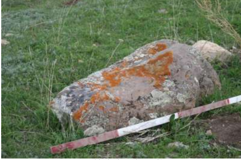
Resim 5. Eski Ekrek Yerleşmesi/Narman