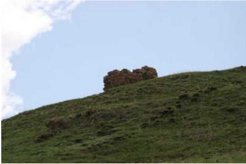
Resim 6. Başkale Kalesi/Narman