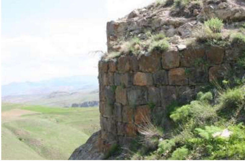
Resim 3.Yanıktaş(Ekrek Kalesi)/Narman