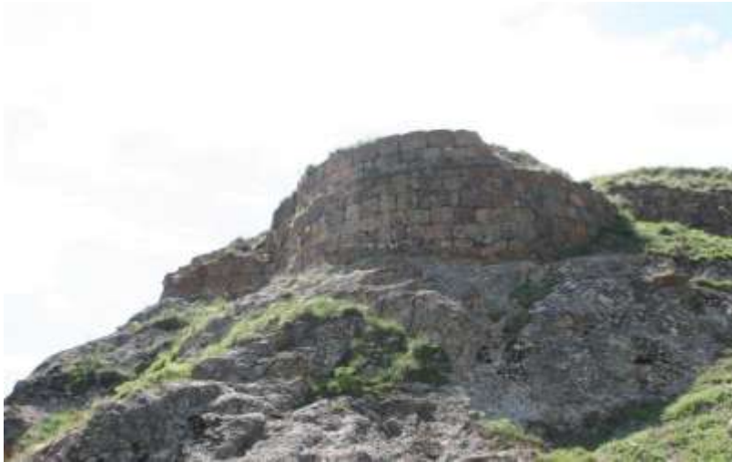
Resim 2. Yanıktaş(Ekrek Kalesi)/Narman