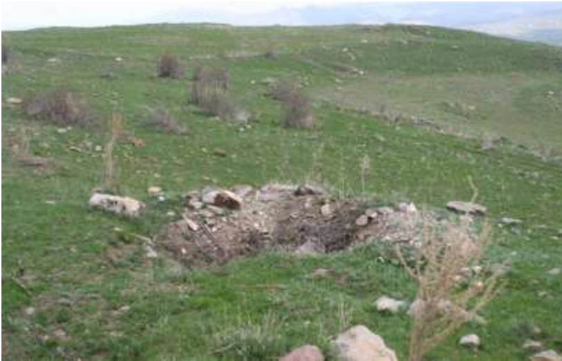
Resim 4.Eski Ekrek Yerleşmesi/Narman