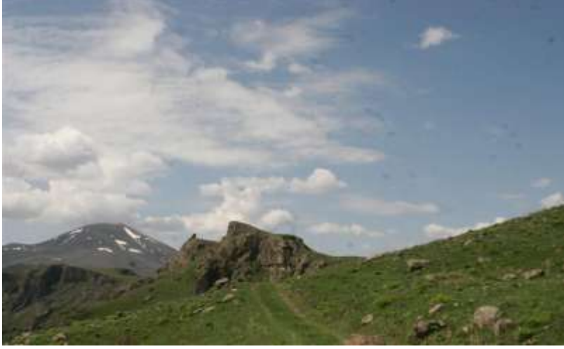
Resim 1. Yanıktaş (Ekrek Kalesi)/Narman