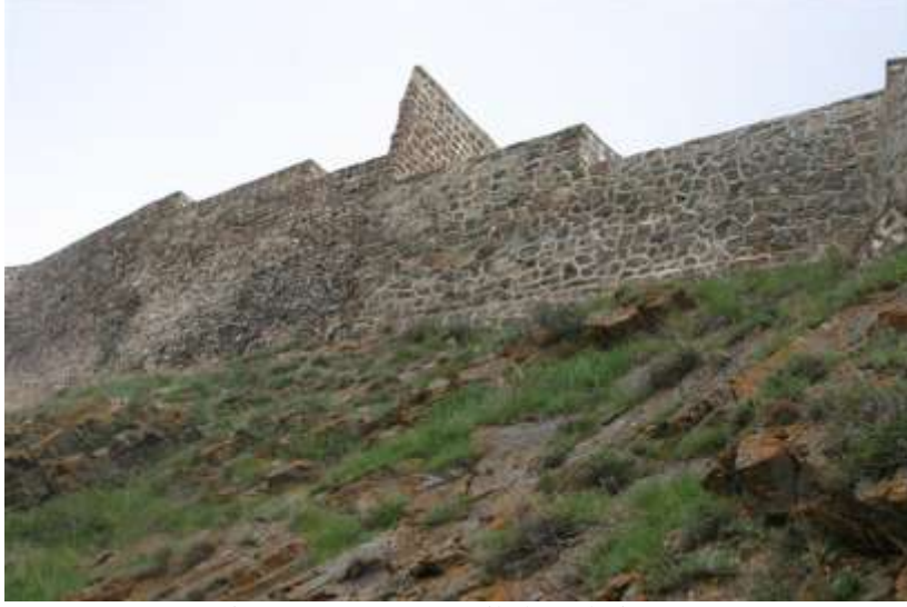
Resim 11.Samugara/Samikale/Kalesi Narman