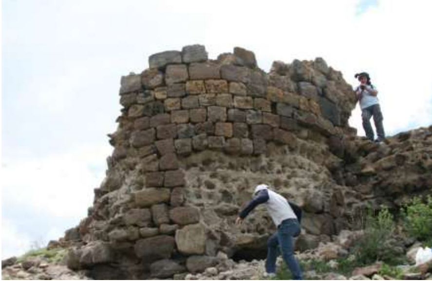
Resim 7.Başkale Kalesi/Narman