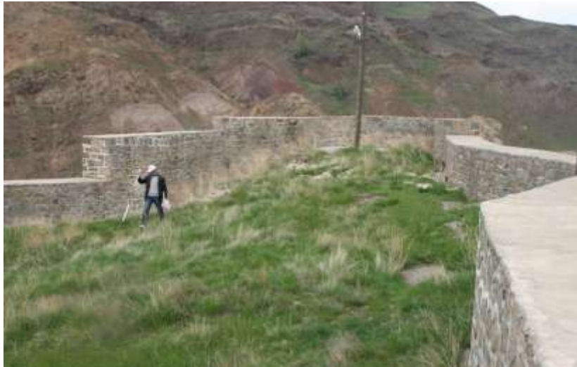
Resim 12.Samugara/Samikale/ Kalesi Narman