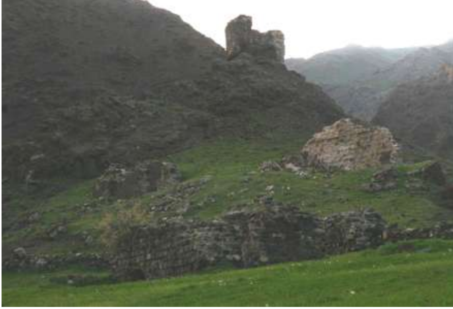
Resim 13. Alabalık Gözetleme Kule