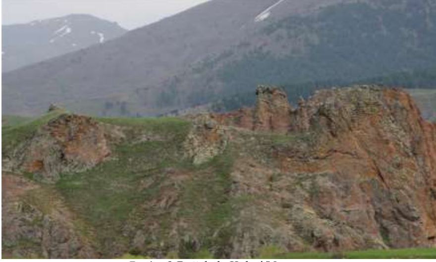
Resim 9.Boğakale Kalesi/Narman