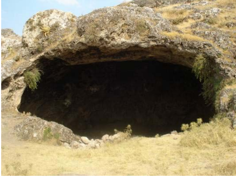
Fig.1. Sakçagözü Mağaraları