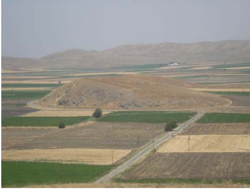
Fig.11. Küçük Gerçin Höyük