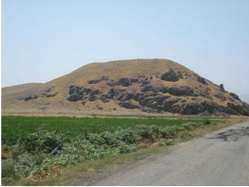
Fig.5. Büyük Gerçin