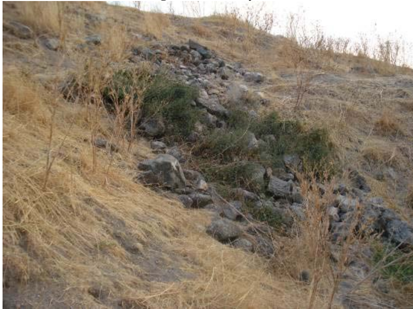
Fig.8. Coba Höyük