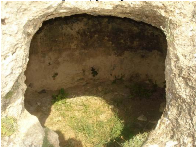
Fig.2. Sakçagözü Mağaraları