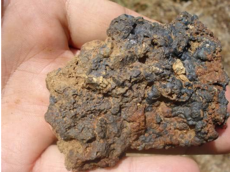
Fig.12. Küçük Gerçin Höyük