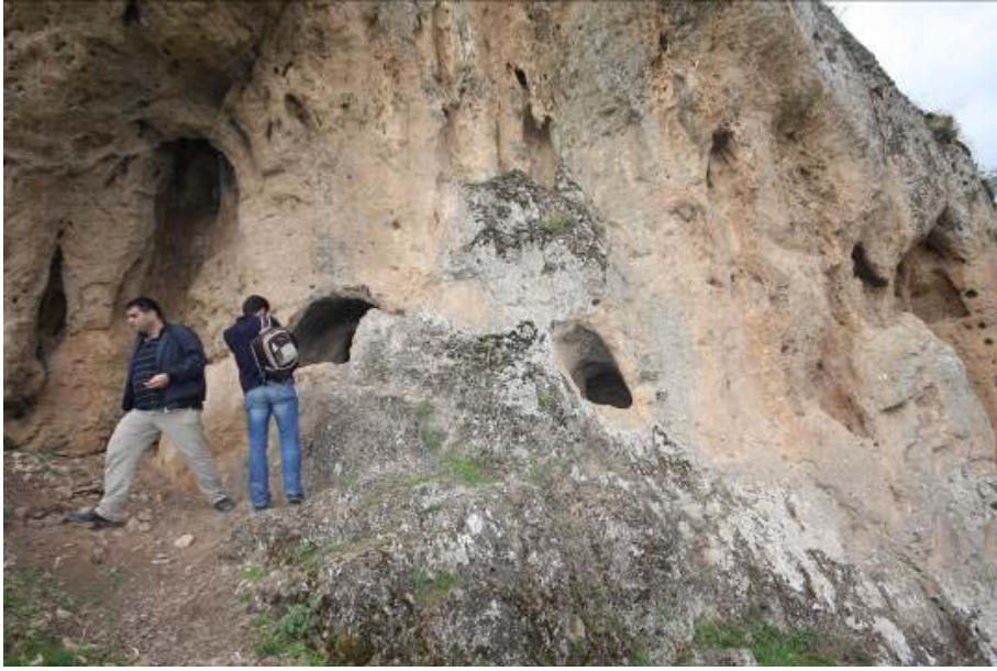
Fig.3. Sakçagözü Mağaraları Yerleşmeleri