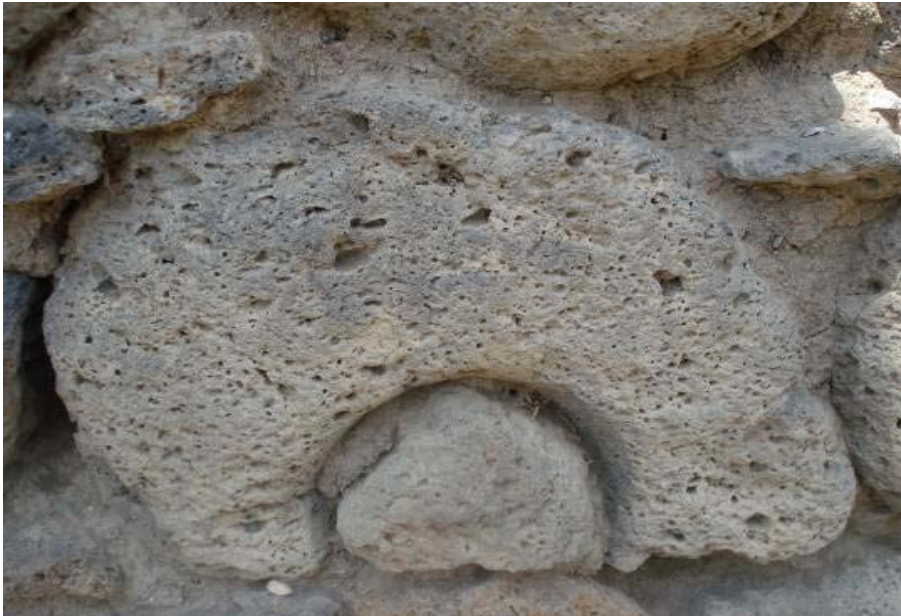
Fig.10. Elbistan Höyük