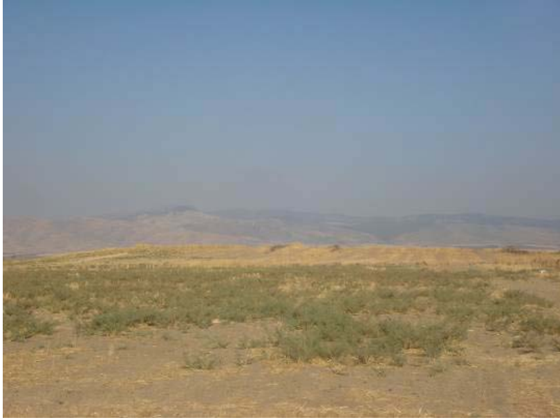
Fig.13. Pancarlı Höyük