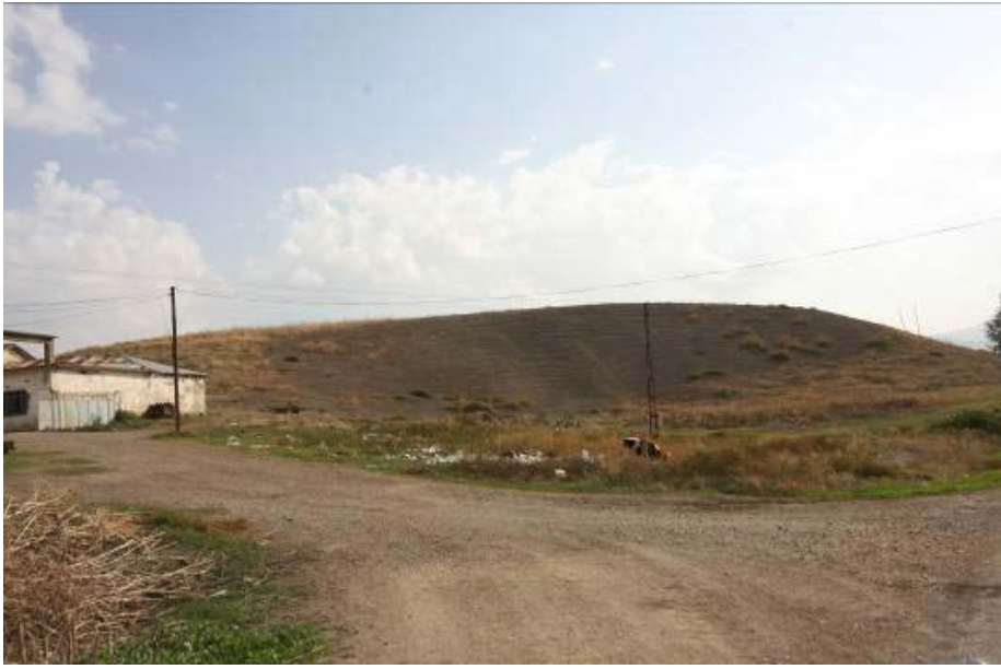
Fig.9. Elbistan Höyük