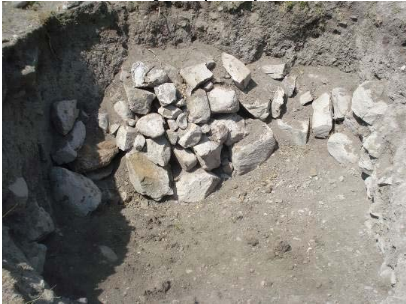
Fig.6. Büyük Gerçin