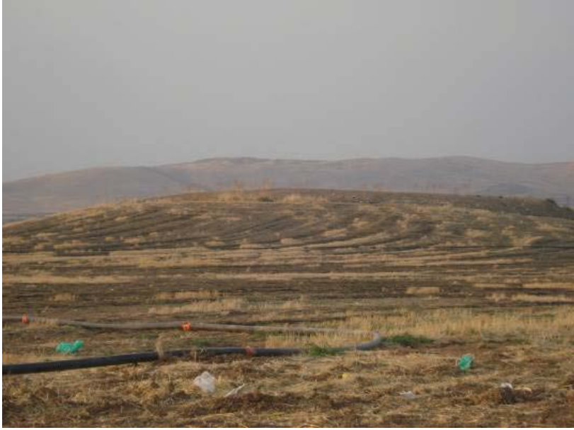
Fig.7. Coba Höyük