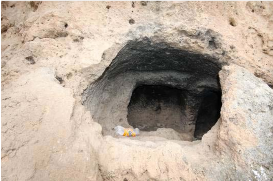
Fig.4. Sakçagözü Mağaraları Yerleşmeleri