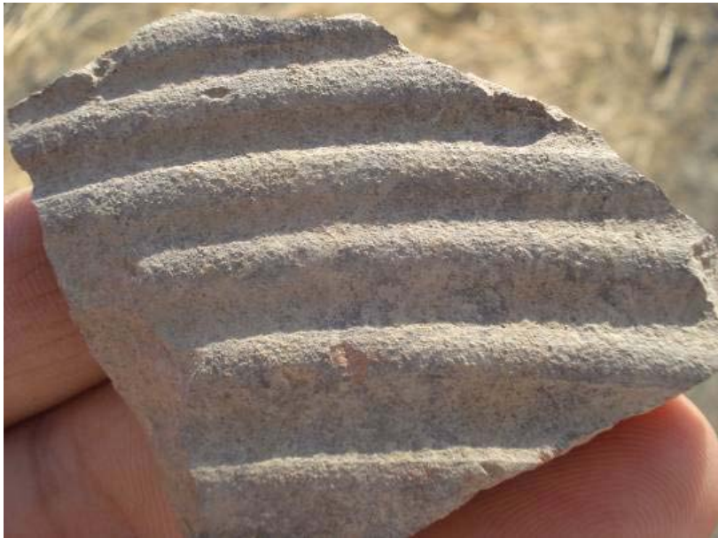
Fig.14. Pancarlı Höyük