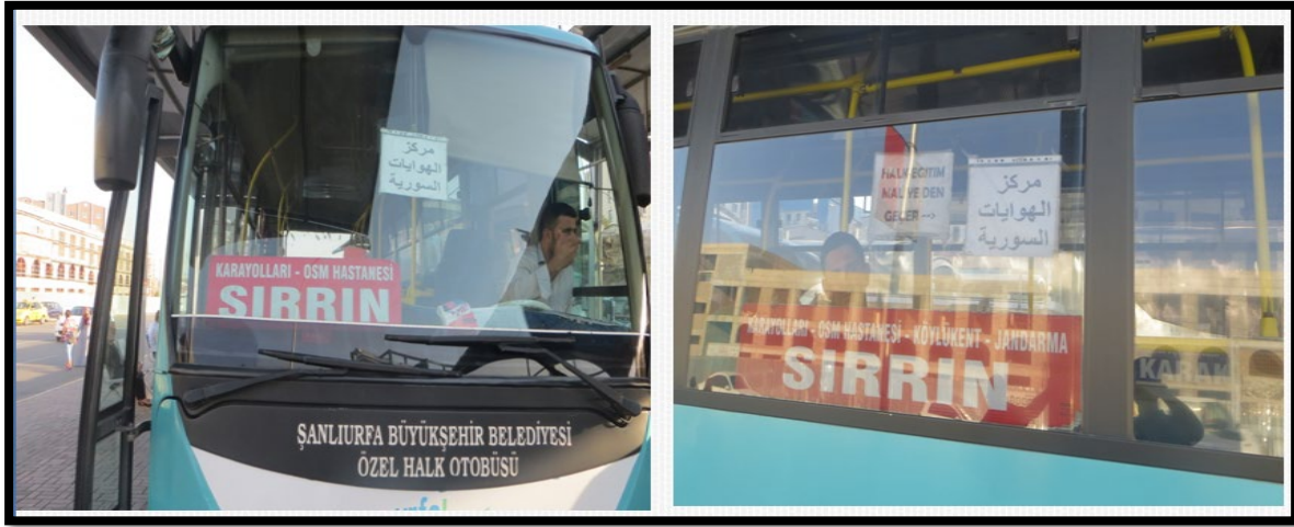
Fotoğraf 3. Suriyeli sığınmacıların yoğun olarak yaşadığı sırrın ve Eyyübiye bölgesine giden halk otobüsleri