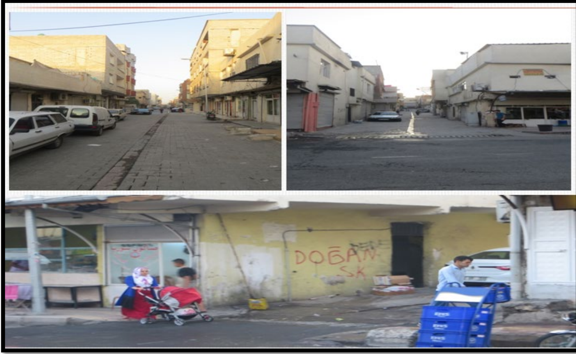
Fotoğraf 5. Sığınmacıların yoğun olarak yaşadığı Eyyübiye’de bulunan ev ve iş yerleri