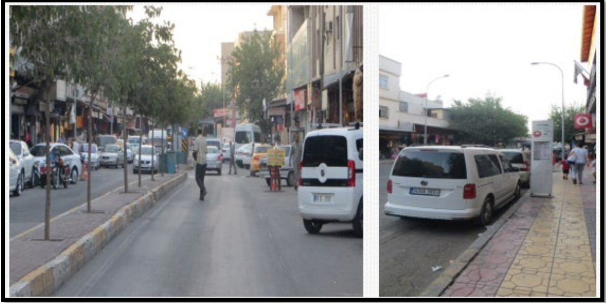
Fotoğraf 4. Eyyübiye-Haliliye yol güzergâhı üzerinde bulunan caddeler