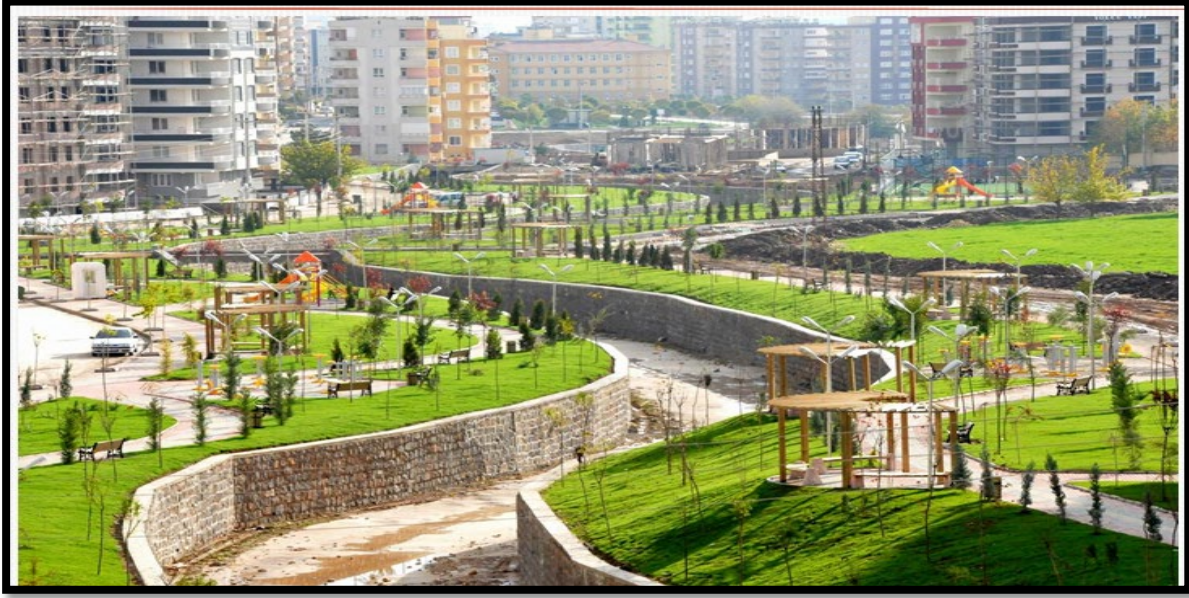
Fotoğraf 6. Yeni yerleşim merkezlerinden biri olan Karaköprü bölgesine ait bir fotoğraf