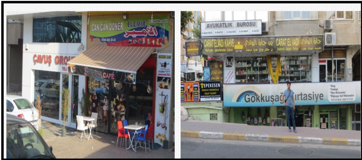
Fotoğraf 2. Şanlıurfa şehir merkezinde bulunan Suriyeli sığınmacılara ait iş yerleri