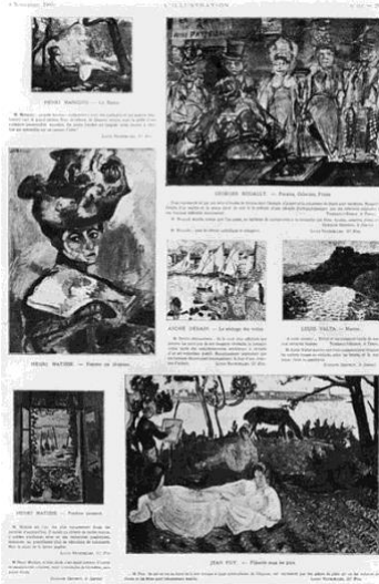
Resim 2. Basın kupürü, Les Fauves, L'Illustration'daki Salon d'Automne'de sergi, 4 Kasım 1905.

Henri Matisse, Maurice de Vlaminck, Andre Derain'ın eserleriyle katıldığı "Sonbahar Solanu"ndaki bir sergiye katılan eleştirmen Vauxcelles canlı renklerle öne çıkan eserlerin arasında 15. yüzyıl sanatını andıran bir üslupla yapılmış bir çocuk heykeli görerek eleştiri yazısının başlığında "Donatello aumilieu des Fauves." (Donatello Vahşilerin Ortasında) terimini kullanmıştır. Zamanla sanatçıları Fovlar ismini benimsemesiyle ismi de ortaya çıkmıştır (Yıldız, 2014: 25-26).