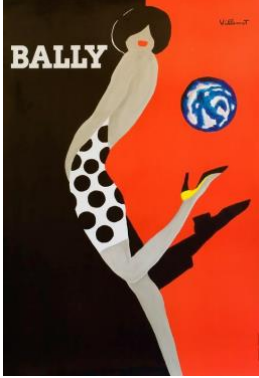
Resim 8. Bernard Villemot, Bally, 1989.

Fotoğraf sanatçısı olarak tanınan Avedon'un çekmiş olduğu Beatles fotoğrafıyla 60'lı yıllarda hem fotoğraf sanatına hem de grafik tasarıma yepyeni bir bakış açısı kazandırmıştır. Grup üyelerinin fotoğraflarını üst üste koyarak elde ettiği stilize figürü grubun yapısını ve müzik anlayışını yansıtacak bir şekilde canlı renklerle vermiştir. Sanatçının kullandığı fotoğraf tekniğiyle elde ettiği stilize figürle ve geniş ve canlı renkleriyle fovist bir görünüm yakaladığı ilerleyen yıllarda fovizm akımının etkisini sürdürmesine katkıda bulunduğu söylenebilir.