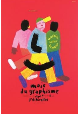
Resim 11. Michel Quarez, Mois Du Graphisme, 2000.

Kabaca karalanmış figürler biçimsel olarak fovizm akımını yansıtan tüm eserlerde görülen bir tavidir. Quarez de tasarım alanında sadece canlı renk ve fırça darbeleriyle elde edilmiş görünümündeki figürle kullanarak mesajı yansıtmıştır. Kullanılan doygun ve canlı renkler ve eskiz görünümündeki figürler 2000’li yıllarda fovist tavrın grafik tasarıma etkisinin devam ettiğini açıkça göstermektedir.