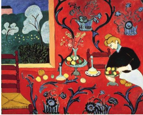
Resim 5. Matisse, The dessert: harmony in red (The red room), 1908, 180x220 cm, Hermitage Museum, St. Petersburg.

Fovist ressamlardan Matisse "Kırmızı Atölye" isimli çalışmasında alanı tek bir renk tonu ile betimleyerek bu alanı yüzeye dönüştürmektedir. Sanatçı bu yüzeyi günlük nesnelere süsleyerek resminin üç boyutlu görüntü kazanmasını sağlamıştır. Yaratıcı renk ve çizgisiyle Matisse, neşeli ve yalın bir üslup yakalamıştır. Sanatçı bu durumu, "İnsanda içine gömülü bir koltukta dinleniyor duygusunu uyandırır" sözleriyle ifade etmiştir (Eren, 1981: 654).