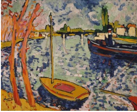
Resim 4. Maurice de Vlaminck, The Seine at Chatou, 1906, 81.6×101 cm, Metropolitan Museum of Art.

1900 yılında Vlaminck, Derain ile tanışınca eserlerine yeni bir yön ve bunun üzerine Matisse ile tanıştıktan sonra Van Gogh'un resim sanatının derinliğini hissetmiştir (Cumming, 2006: 346).