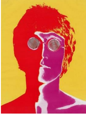
Resim 7. Richard Avedon, Beatles, 1967.

Fotoğraf sanatçısı olarak tanınan Avedon'un çekmiş olduğu Beatles fotoğrafıyla 60'lı yıllarda hem fotoğraf sanatına hem de grafik tasarıma yepyeni bir bakış açısı kazandırmıştır. Grup üyelerinin fotoğraflarını üst üste koyarak elde ettiği stilize figürü grubun yapısını ve müzik anlayışını yansıtacak bir şekilde canlı renklerle vermiştir. Sanatçının kullandığı fotoğraf tekniğiyle elde ettiği stilize figürle ve geniş ve canlı renkleriyle fovist bir görünüm yakaladığı ilerleyen yıllarda fovizm akımının etkisini sürdürmesine katkıda bulunduğu söylenebilir.