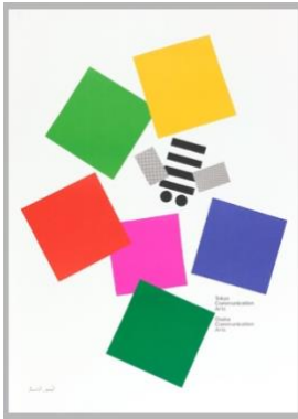
Resim 10. Paul Rand, Osaka Communication Arts, 1991.

Türk grafik tasarımının öncülerinden olan Sait Maden, kitap kapaklarında genellikle kullandığı stilize figürlerle öne çıkan sanatçıdır. Stilize biçim, fovizmde nesnelere formlarının bozularak resmedilmesiyle karşılaşılan bir durumdur. Muhakkak ki fovizm sonrasında ortaya çıkan kübizm akımının da stilize figürlerde etkisi vardır. Fakat kübizmin de kendinden önceki sanat akımlarından esinlendiğinden yola çıkıldığında özünde fovizme yoğunlaşılabilir. Buna ek olarak Maden'in oluşturduğu tasarımlarda geniş alanlarda kullandığı canlı renkleriyle de fovizm etkisini Türkiye'ye taşıdığı söylenebilir.