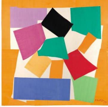
Resim 6. Henri Matisse, The Snail, 1953, 287x288 cm, Tate Gallery, London.

Fovların getirdikleri yenilik, sanata renkli bir bakış açısı katmaktadır (İpşiroğlu, 1993: 24-25). Ayrıca renk dışında çizgi ve biçimleriyle fovist eserler özgün bir tavır sergilemişlerdir.