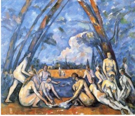
Resim 1. Paul Cézanne, The Large Bathers, 1898-1905, 210.5×250.8 cm, Philadelphia Museum of Art, US.