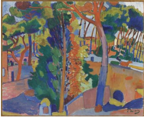
Resim 3. Andre Derain, Bridge Over The Riou, 1906, 82.6x101.6 cm, MoMA.

Özellikle Derain ve Vlaminck yoğun renklerini Van Gogh'dan miras kalan bir yöntemle kalın, ağır fırça darbeleriyle uyguluyorlardı. Fovist resimler ayrıntıların çoğunun saf dışı bırakıldığı dünyayı canlı biçimlere indirgiyorlardı. Sonuç olarak, resimler hemen her zaman parlak desenli düz yüzeyler olarak görünüyordu. Fovist bir manzarada uzaktaki tepeler uzakta görünmez, yalnızca renk örüntüsünün içinde bir parçadırlar (Little, 2016: 100).