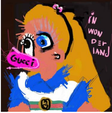
Resim 12. John Paul Fauves, Gucci Alice, 2017.

Kabaca karalanmış figürler biçimsel olarak fovizm akımını yansıtan tüm eserlerde görülen bir tavidir. Quarez de tasarım alanında sadece canlı renk ve fırça darbeleriyle elde edilmiş görünümündeki figürle kullanarak mesajı yansıtmıştır. Kullanılan doygun ve canlı renkler ve eskiz görünümündeki figürler 2000’li yıllarda fovist tavrın grafik tasarıma etkisinin devam ettiğini açıkça göstermektedir.