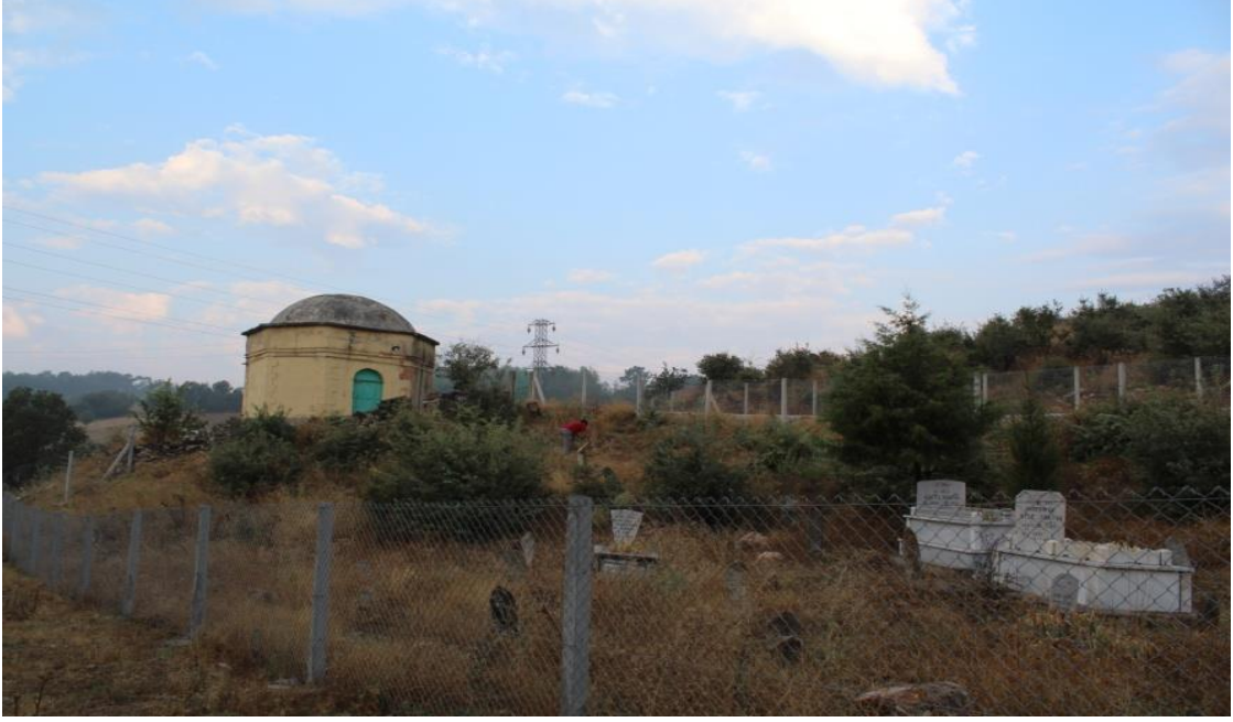
Fotoğraf 1. Hacı Ali Türbesi ve Hazire (06.09.2014).

Hacı Ali Türbesi, sekizgen planlı gövde ve örtüden meydana gelmektedir. Köşe taşları olarak kesme taşların kullanıldığı yapının beden duvarları sıvalı ve boyalıdır. Türbenin kubbesi dıştan çimento içerikli sıva ile sıvanmıştır.