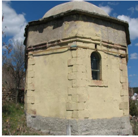
Fotoğraf 2-3. Hacı Ali Türbesi (22.03.2019).