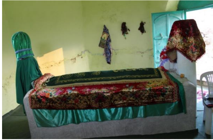
Fotoğraf 4-5. Hacı Ali Türbesi (sol foto: 22.03.2019-sağ foto: 06.09.2014).