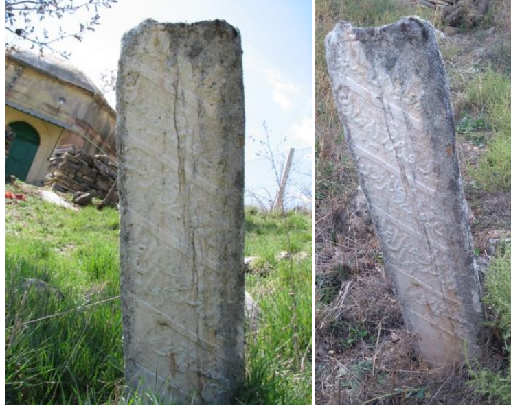
Fotoğraf 6-7. Haziredeki Mezar Taşı (22.03.2019- 03.10.2019).

mezar taşının üst kısmı ve sağ tarafı tahrip olmuştur, tarih kısmından ise sadece 1 ve 9 rakamları (١٩) okunabilmektedir. 4