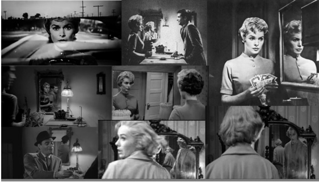
Görsel 4: Psycho, Sapık, Alfred Hitchcock, 1960. Filmde çok sayıda ayna yer alırken katilin yansımaya neredeyse aynada hiç görünmez. Genellikle kurbanların yansımaları cinayet öncesinde farklı ayna yansımalarıyla seyirciye servis edilir.

Beyazperdede ayna, önemli bir metafor ögesidir. Kırık ayna 21 , bakan kişinin şizoid kimliği/ borderline kişilik bozukluğu ile ilgili izleyiciye ipucu verir. Parçalanmış, kırık aynada kendine bakan karakter, sinematik bir anlatım yoluyla, kişiliğinde bölünmeler olduğu yolunda izleyiciye işaret verir. Ya da aynada kendisiyle konuşan karakter, merdümگیرiz biri olarak toplumdaki soyutlanmış olabilir. Bu duruma en güzel örnek Taxi Driver (Taksi Şöförü, Martin Scorsese, 1976) filminde aynada kendisiyle konuşan Travis Bickle (Robert DeNiro) karakteridir. Çarpıtılmış ayna ise düzensizliği, kaosu ve bilincin kaybolmasını sembolize eder. Hitchcock da benzer şekilde Psycho (Sapık, Alfred Hitchcock, 1960) filminde aynayı ustacı kullanır. Psycho 'da aynada kurbanın yansımaya yer alırken, katilin yansımaya görünmez.