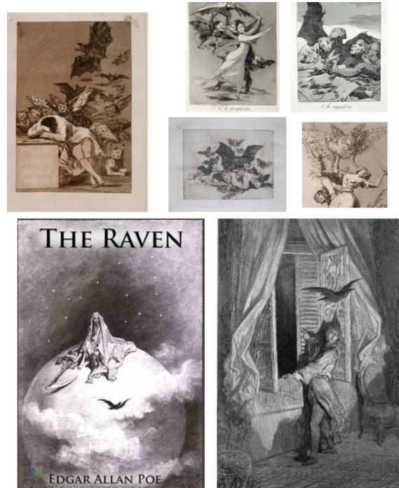
Görsel 6: Goya'nın baskı ve çizimlerinden örnekler ve Gustave Dore'un Poe İllustrasyonları