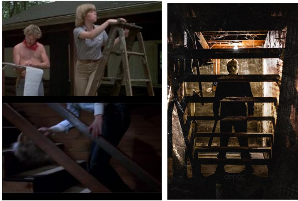
Görsel 3: Teen Slasher korku filmlerindeki merdiven sahneleri

Korku sinemasında merdiven gibi diğer bir meşum nesne, aynalardır. Mitolojiden antik hurafelere ayna (yansıma) önemli bir sembol olurken çok çeşitli anlamlarda karşımıza çıkar. Mitolojide, Narcissus, kendi yansımasına aşık olurken, Perseus, Medusa'yı ayna sayesinde alt edebilmiştir. Aynanın, ruhu hapsettiği, aynayla ilgili bir inanışken, Antik Yunan ve Roma dışında yerli kabilelerin birçoğunda aynaya bakan insanın ruhunun aynaya geçtiği inancı yaygındır. Bu sebepten, aynanın zedelenmesi ruhun zedelenmesi manasına gelir. Ayna, ruhun zapt edildiği, yakalandığı bir nesne olarak da karşımıza çıkar. Eski bir