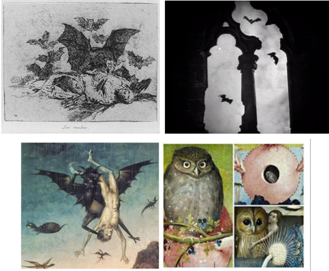
Görsel 5: (Üst) Francisco José de Goya y Lucientes'in yarasa içeren baskılarından bir örnek (Sağ Üst) Dracula (Dracula, Tod Browning, 1931) (Alt) Bosch ve Goya'nın çalışmalarından örnekler.