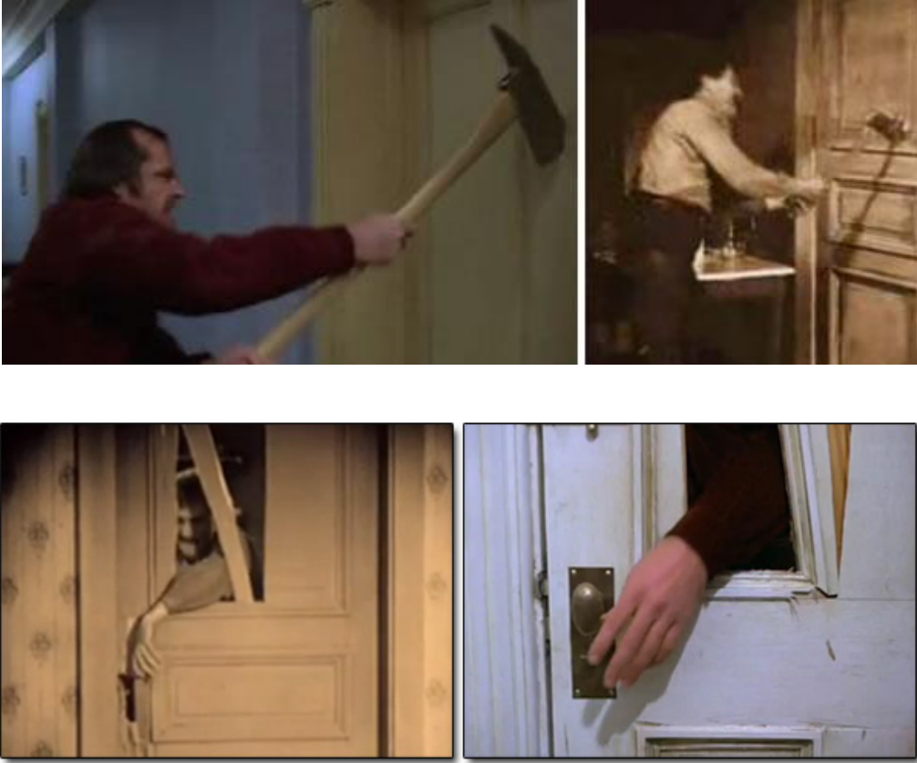
Görsel 1: Cinnet (1980) filminde Johnny'nin kapıyı balta ile kırarak karısını öldürmeye çalıştığı sahne ve referans olan The Phantom Carriage (Victor Sjöström, 1921).

Pagan inançlara uygun olarak kurban etme eyleminin gerçekleştiği malikâne ya da kutsanmış toprakların üzerine yapılan ev, mutlak suretle uğursuzluk getirir. Stanley Kubrick'in The Shining (Cinnet, 1980) filminde Overlook Otel'i Kızılderili mezarlığı üzerine inşa edilmiştir. Johnny (Jack Nicholson), Amerikan üst-beyaz tavrını yansıtan alter egosuyla, otele girmek isteyen aşçı 10 karakterini öldürmek gibi aşırıya kaçan eylemleriyle dışarıdan gelen tehditlere karşı saldırgan bir üslup sergiler. Güney Gotiği'ne özgü "kasabaya dışarıdan gelenin tehdit oluşturması" durumu Cinnet filminde hayaletlerin otelin daimi sahiplerinin kendilerinin olduğu vurgusuyla dile getirilir. Robert Rodriguez'in yönetip Quentin Tarantino'nun senaryosunu yazdığı, From Dusk Till Dawn (Gün Batımından Şafağa, 1996) filminde vampirlerin 11 ortaya çıktığı bar, tapınağın görünen yüzüdür. Bütün bu ve benzer filmlerde eski Amerikan kabilelerinin batıl inançlarından kaynaklı felaketler gün yüzüne çıkar.