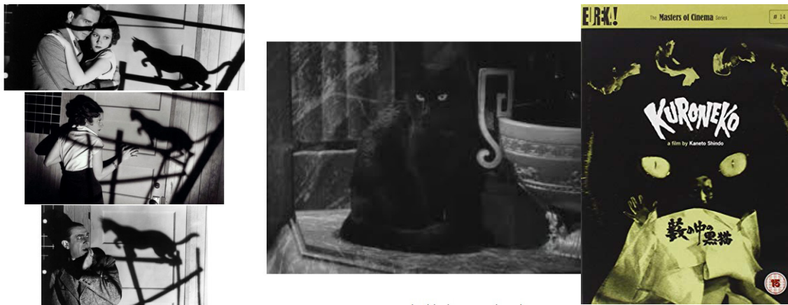
Görsel 7: Poe'nun Kara Kedi öyküsünün sinema uyarlamaları