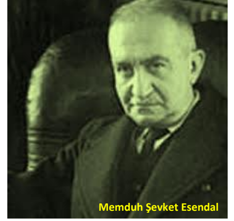
Memduh Şevket Esendal

Peyami Safa'nın Gençliğimiz adlı eserinde konu evlenme nedenidir. Yazarın Câzibeli Kız ve Aşağı Katın Kiracıları adlı eserlerinde aldatma konusu işlenir. Yazarın Ava Giden Avlanır adlı eserindeyse evlenme nedeni, aldatma konularının yanında eş seçimi ve eşlerde aranan özellikler konusu yer alır. Sanatçının Siyah Beyaz Hikâyeler adını verdiği çok sayıda hikâyeyi bünyesinde barındıran eserinde boşanma, aldatma, aile içi ilişkiler, aile ve miras; savaş, yangın, doğal âfet ve kazalar; fakir aileler, aile ve ölüm, eş seçimi ve eşlerde aranan özellikler ve evlenme nedeni konuları ele alınır. Yazarın bir diğer hacimli eseri Asrın Hikâyeleri' nde çok yaşlı bir erkekle çok genç bir kadının evlenmesi, fakir aileler; aile-savaş, yangın, doğal âfet ve kazalar; aldatma, aileye yardımcı elemanlar; hikâye kahramanlarının ve yazarlarının aile ve aileyle ilgili meselelere bakışı; eş seçimi ve eşlerde aranan özellikler, aile içi ilişkiler, evlenme nedeni, ilk evliliğin herhangi bir sebeple bitmesi sonrası evlenme, aile ve ölüm, aile ve miras konuları işlenir.