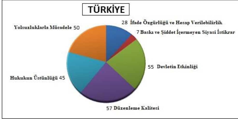
Şekil 2: Yönetişim Göstergeleri Türkiye

Şekil 2’de Türkiye’nin yönetim oranlarının dağılımı grafik şeklinde gösterilmiştir. Yönetişim göstergeleri skorlarına göre sıralanırsa (Şekil 2): (1) Düzenleme Kalitesi, (2) Devletin Etkinliği, (3) Yolsuzluklarla Mücadele, (4) Hukukun Üstünlüğü, (5) İfade Özgürlüğü ve Hesap Verilebilirlik, (6) Baskı ve Şiddet İçermeyen Siyasi İstikrar. Görüldüğü üzere Türkiye’de yönetim göstergeleri kapsamında ilk sırada “Düzenleme Kalitesi” son sırada “Baskı ve Şiddet İçermeyen Siyasi İstikrar” göstergesi yer almaktadır.